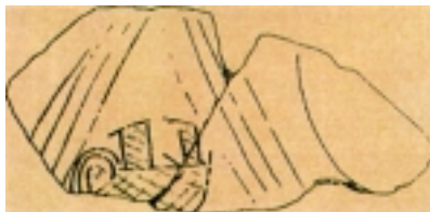
Crtež broda pronaden u Grapčevoj špilji

nuta kultura iščezava dolaskom Indoeuropljana (Predilira i Ilira) od kojih potječu brojne otočke gradine.