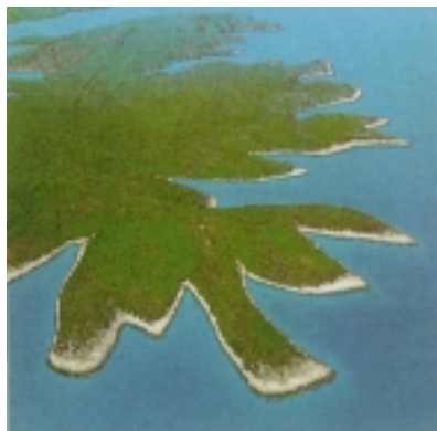
Dio poluotoka Kabla nalik na pticu

žitije prema 6 km dugom i 2 kilometra širokom polju, smještenom između Starog Grada, Vrbovske i Jelse te gorskih grebena sjevera i juga. Tu odlično, još iz antičkih vremena, uspijevaju vinova loza i maslina.