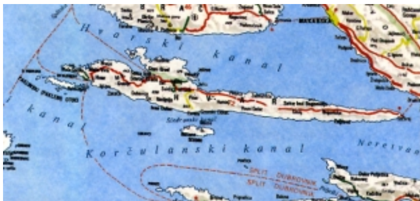
Zemljovid otoka Hvara

ili Paklinski otoci u neposrednoj blizini grada Hvara, koji su ime dobili po tome što se na njima kuhala paklina (zovu je i pakal), crna smola za premazivanje dna drvenih brodova i čamaca. Pakleni su otoci, zbog razvijene makije te šuma crnike (češvine ili česmine) i bora, s ukupnom površinom od 634,38 ha, svrstani u zaštićene krajolike. Sačinjavaju ih sljedeći otoci i hridi: Vodnjak Mali, Vodnjak Veli, Karbun, Travna, Lengga, Paržanj, Borovac, Sv. Klement, Dobri otok, Vlaka, Stambeder, Pločice, Baba, Borovac (drugi), Gojca, Planikovac, Marinkovac, Jerolim te Gališnik na samom ulazu u hvarsku luku i Pokonji Dol nešto istočnije. Najveći je Sv. Klement (5,31 km 2 ) koji ima tri povremeno naseljena zaselka (Momića Polje, Vlaka i Palmižana). Ističe se pješčana uvala Palmižana u kojoj je smještena i ACY marina. Uz južnu obalu nalaze se još dvije hridi (Lukavci) i najveći hvarski otok Šćedro (8,45 km 2 ) udaljen od Hvara 2,7 km. Taj je otok bio nastanjen u antici i srednjem vijeku, imao je i dominikanski samostan, a i danas je povremeno nastanjen. Ime je starohrvatsko i znači milosrdan.