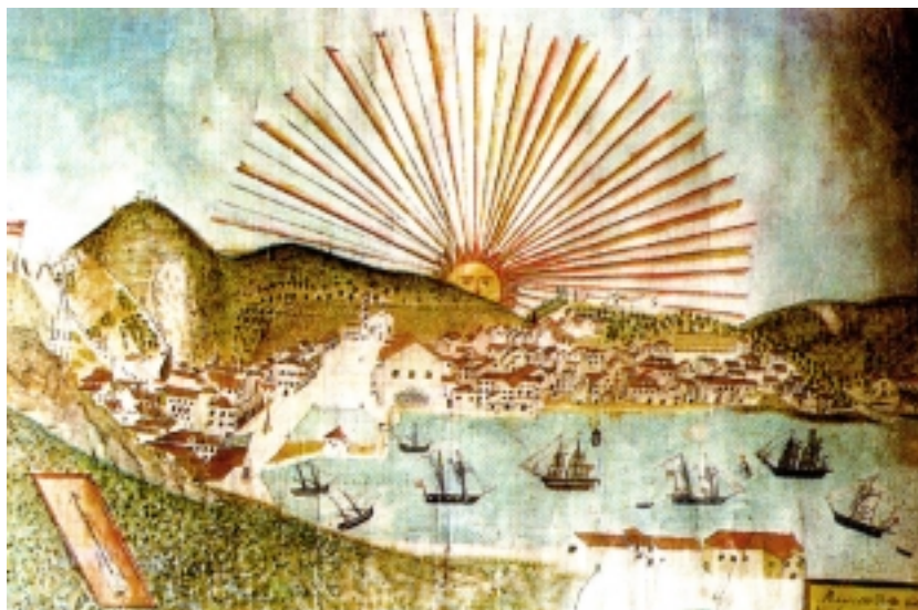
Razglednica grada Hvara iz 1834.

maciji i osnivač tamošnje Hrvatske čitaonice (1868.). I dalje su glavne značajke hvarskoga gospodarstva poljodjelstvo, stočarstvo i ribarstvo. Nedaće s vinogradarstvom, uzrokovane vinskom klauzulom i jeftinim talijanskim vinom te filokserom, potiču na Hvaru proizvodnju ružmarinova ulja. Osnivaju se i posebne ružmarinske zadruge, a intenzivno se sadi i buhač. Od 18. stoljeća gradovi Hvar, Stari Grad i Jelsa sve se više uključuju u razgranato trgovinsko-pomorsko poslovanje Jadranom