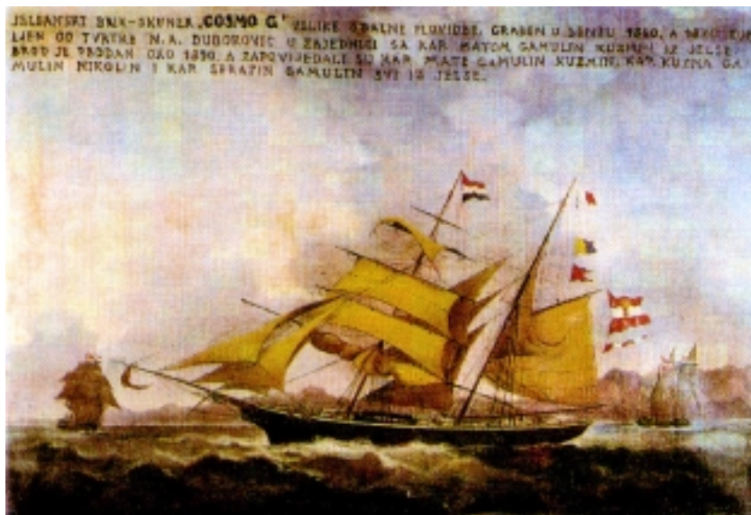
Jelšanski jedrenjak izgrađen 1860. godine

Sve su te nesreće zaustavile i usporile Hvar u trenucima najvećega gospodarskoga i kulturnog prosperiteta. Iako se Hvar postupno oporavljao, te i dalje bio jednim od vodećih mletačkih središta u Dalmaciji, sjaj prošlih vremena nikada nije dostignut. Velik je udarac Hvaru zadala odluka mletačkih vlasti sredinom 18. stoljeća o preseljenju kapetana Zaljeva iz hvarske luke u Kotor. Tadašnja gospodarska recesija i veliki troškovi održavanja gradske uprave izazvali su nezainteresiranost i plemića i pučana za komunalne poslove. To je ujedno vrijeme mletačko-turskih ratova u Dalmaciji (Kandijski i Morejski) pa se na Hvar, kao i na druge otoke, doseljava izbjeglo stanovništvo iz hrvatskih kopnenih područja. U to se vrijeme mnogo izvozi vino, ulje, smokve, bajami, rogači i drugo voće prvenstveno u Veneciju, gdje su Hvarani imali svoje posebne stolove. Na pristaništu glasovite Rive degli Schiavoni i danas se vidi kamerni blok koji pokazuje da su tu rezervirana sidrišta za brodove Hvara i Brača. Vrlo je razvijeno i ribarstvo, a sporovi započeti u 16. stoljeću između vlasnika trata i manjih mreža vojga o razgraničenju ribolovnih područja proširit će se kasnije na viško područje i postati dijelom povijesti našeg ribarstva u sljedećim stoljećima. Dio se ulovljene ribe tro-