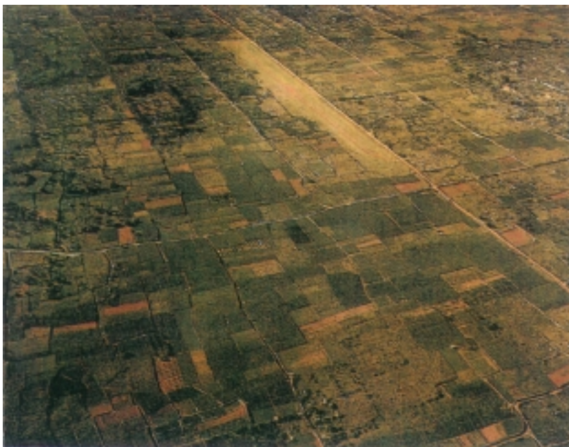
Starigradska polja snimljena iz zrakoplova

populi Romani". Na otok se doseljavaju mnogi rimski građani, ali mu se nekadašnji značaj znatno smanjuje.