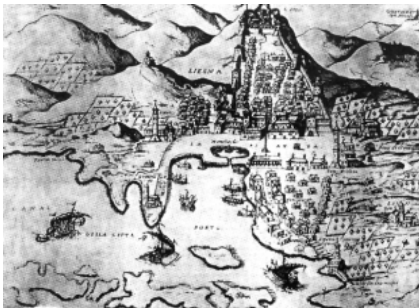
Crtež grada Hvara s početka 16. stoljeća

O materijalnoj moći svjedoče i danas kameni tragovi bogate umjetničke baštine: gradske zidine i kaštel (tvrđava Španjol), prostrani gradski trg (pjaca) knežev dvor (komunalna palača), loža, arsenal, mandrač (sklonište za brodove, od grčkog mandra što znači staja) sat-kula (Ieraj), fontik (spremište za žito), belvedere, vlastelinski ljetnikovci, crkve, kapele i zvonici. Svjedoči i jedno od naj-