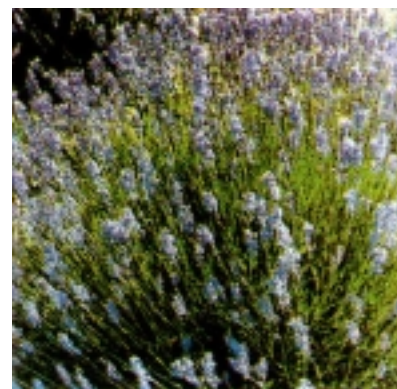
Grm lavande u cvatu

skim mjestima pa su spalili Stari Grad i Vrbosku, a stanovništvo se posakrivalo po okolnim brdima dok se Jelsa uspjela obraniti iz svoje crkve-tvrđave. Kako nesreća nikad ne dolazi sama u gradu je neposredno nakon turskog pustošenja izbila kuga koja je pokosila više od tisuću odraslih ljudi. No ni to nije bilo sve. Još neoporavljeni Hvar zadesila je 1579. godine nova nesreća. Grom je udario u tvrđavu na mjesto gdje se nalazila barutana. Posljedica lančanih eksplozija koje su potom uslijedile bila je potpuno uništenje tvrđave, kuća u neposrednoj blizini i oštećenje gradskih bedema. Mnoge su zgrade u gradu pretrpjele velike šte-