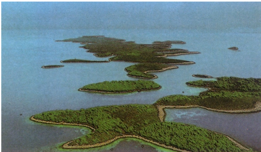
Pogled na Paklene otoke

Zapadni dio otoka Hvara mnogo je širi i tu su smještene najveća hvarska polja i najveći broj naselja. Zapravo se otok i sužava od zapada prema istoku i po svom obliku podsjeća na zmijolike likove iz dječjih crtanih filmova. Podsjeća i na šilo, a to je u obliku Lesina i bio talijanski naziv za grad i otok. Zapadni je dio i najrazvedeniji, tu su uz brojne otočiće smješteni i najveći zaljevi: Starogradski (dug 7,4 km, širok do 2,8 km), Nedomišaljski, Vrboški, Hvarski i dr. Uostalom razvedeni oblici najsjevernijeg dijela Hvara, oko rta Smočiguzica na poluotoku Kabal (koji zatvara Starogradski zaljev), postali su posljednjih godina, po avionskim snimcima koji podsjećaju na pticu, gotovo zaštitnim znakom mnogih naših turističkih publikacija.