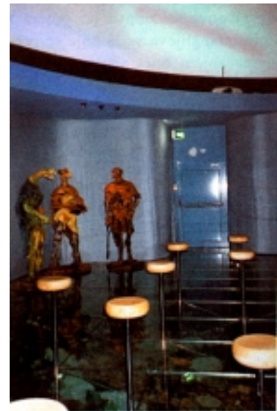
Detalj interijera paviljona