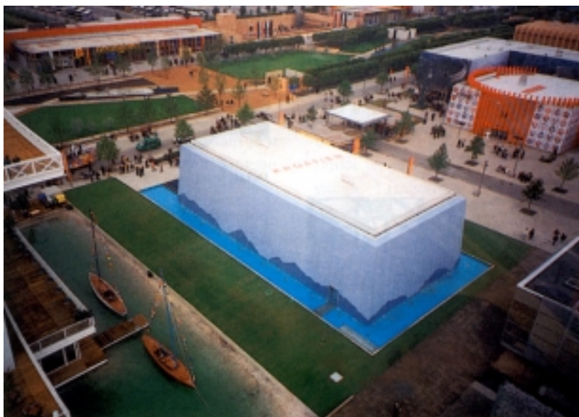
Hrvatski paviljon u prostoru izložbe u Hannoveru

Organizaciju cijelog posla preuzeo je Institut građevinarstva Hrvatske iz Zagreba, koji se posebno brinuo o tome da svi troškovi izgradnje i opremanja paviljona ne prijeđu odobrenu svotu od 25 milijuna kuna. Ta je svota točno za polovicu manja od prije planirane. Izgradnja paviljona započela je 4. siječnja 2000. godine, a završena je prije roka i pretekla mnoge koji su s izgradnjom svog paviljona počeli znatno prije. Čelična se konstrukcija izrađivala u Zagrebu (počela se izrađivati 10. prosin-