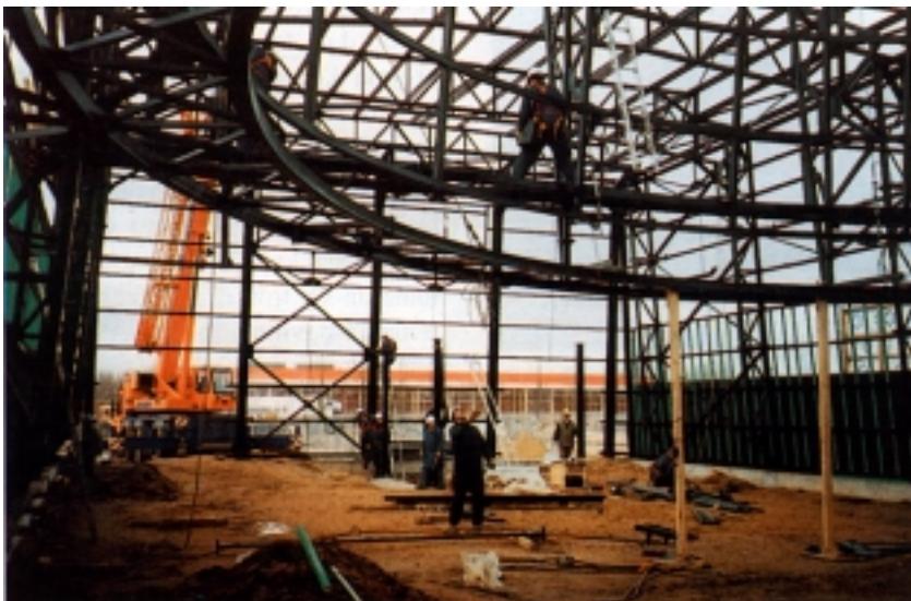
Montaža čelične konstrukcije

Ideja da se paviljon s jedne svjetske izložbe vraća u Hrvatsku nije ni neobična ni nova. Prije nekoliko godina proslavili smo stogodišnjicu postojanja Umjetničkog paviljona u Zagrebu, koji je svojedobno bio uređen kao paviljon za svjetsku izložbu u Budimpešti. O tome su naši čitatelji detaljnije mogli pročitati u ovom časopisu broj 1/2000. u pretisku članka iz Viesti Društva arhitekta u Hrvatskoj i Slavoniji .