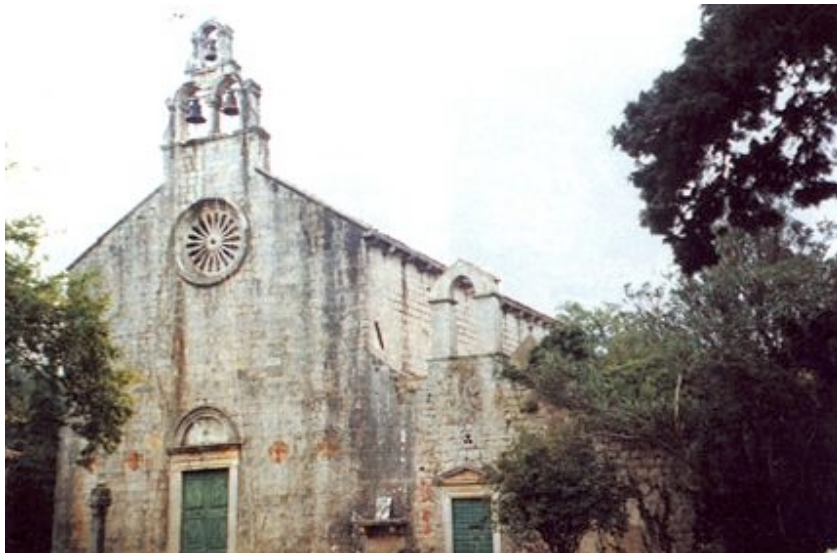
Crkve u sklopu benediktinskog samostana u Pakljenju

je sudbinu ostalih dijelova Dalmacije. Zabilježeno je da je šipanska općina među prvima u kojoj su 1865. godine na vlast došli narodnjaci.