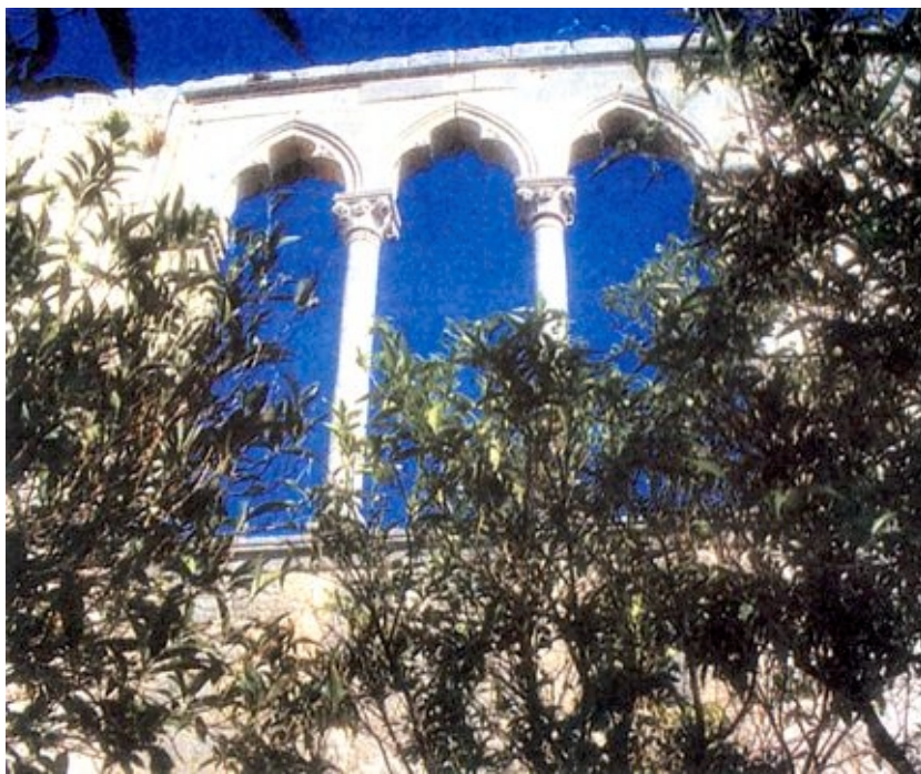
Ostaci kneževa dvora u Lopudu

mostana, 30 crkava i velikim brojem udobnih kuća s parkovima raznovrsne vegetacije. Po bogatstvu je od kraja 15. do 17. stoljeća nazivan "malim Dubrovnikom" i imao je mnogo više stanovnika nego danas (348 u popisu iz 1991.). U nekim izvorima se čak spominje i nemogućih 14.000 stanovnika, no ako je i riječ o jednoj ništici previše i ta je brojka zaista impresivna za tako malen otok.