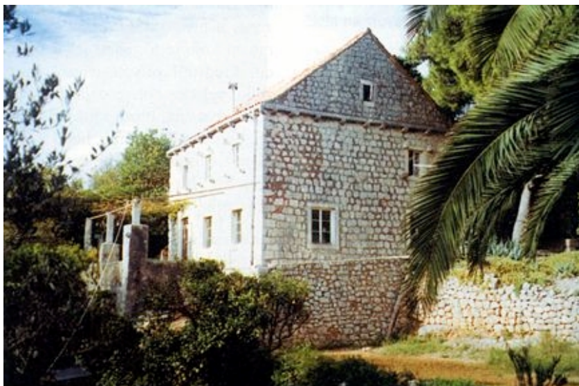
Osnovna škola u Koločepu

nja započne ove zime. Inače ih ljeti opskrbljuju vodonosci, a voda se po kućama razvodi improviziranim cijevima. Mnogi se koriste i pomalo boćatom podzemnom vodom, a inače i svaka kuća ima svoje 'gustijerne'. Kanalizacija je u planovima zajedno s izgradnjom vodovodne mreže. Hotel ima svoju kanalizaciju, a buduća će se kanalizacija graditi zajedno i za Gornje i za Donje Čelo. Otpad se redovito odvozi rano ujutro, ali utovar budi goste pa treba razmisliti o odlagalištu izvan naseljenog područja. Električne instalacije su vrlo slabe pa struje nestaje čim negdje jače zapuše ili zagrmi. Na Koločep redovito jednom tjedno iz Dubrovnika dolazi svećenik.