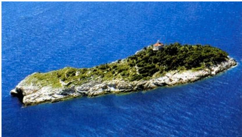
Otočić Sv. Andrija sa svjetionikom

Otočić Daksa je pošumljeni otok na ulazu u zaljeve Rijeka dubrovačka i Gruž. Dug je oko 500 m, a širok 80-100 m. Na njemu se nalazi svjetionik važan za ulaz u grušku luku. U dokumentima se spominje i kao Daxa i Axa, a na njemu je 1281. godine vlastelin Sabo Getaldić izgradio franjevački samostan s crkvom Sv. Sabine. Za francuske okupacije samostan je srušen, a kamenje upotrijebljeno za izgradnju utvrde. Otočić je važan u hrvatskoj i dubrovačkoj staroj i novijoj povijesti, a posebno za povijest književnosti. Zna se, naime, da je na otočiću svoju poemu Suze sina razmetnoga napisao jedan od najvećih hrvatskih pjesnika Ivan Gundulić.