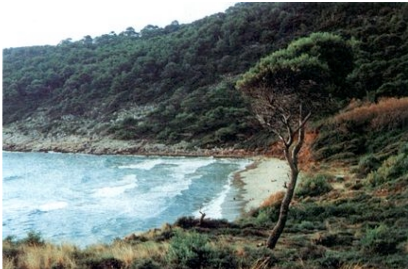
Uvala Šunj na Lopudu

rovniku postavljeno mu je brončano poprsje i to je jedini spomenik koji je Republika podigla nekom svom građaninu. S Lopuda je podrijetlom i pomorac i diplomat Vice Buna (1559.-1612.), koji je bio u službi španjolskog kralja Filipa II. i vjerojatni potkralj Meksika te dubrovački konzul u Napulju.