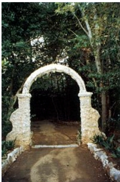
Detalj iz parka Đorđić-Mavneri

čane plaže u uvali Šunj. Usput smo saznali da na Lopudu djeluje novo dobrovoljno vatrogasno društvo, ali da je 1989. godine bio veliki požar u kojem je izgorio veći dio šume i makije na jugoistoku otoka. Razgovor i druženje s tajnikom Mjesnog odbora zaključili smo razmjenom informacija o ratnim danima. Lopud je bio u blokadi i nekoliko se puta na njega pucalo. Bili su i bez struje no probleme su rješavali s velikim agregatom i redukcijama.