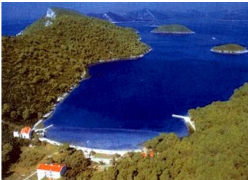
Pogled s Jakljana na uvalu i Koločepski kanal

Olipa je najzapadniji Elafitski otok površine od točno 1 km 2 . Najviši je vrh 206 metara, a otočić je gotovo ovalnog oblika, osim izduženog Rta jezika okrenutog prema sjeveru. Na jugozapadu otoka, uz važan morski prolaz Veliki Vratnik nalazi se svjetionik, baš kao i na malom otočiću Tajanu s druge strane prolaza. Jakljan (zovu ga i Lakljan) koji se na Olipu nastavlja i pruža prema jugoistoku i ima 3,45 km 2 (postoje podaci i o 5,34 km 2 ), a najveća je visina vrh Katine staje 222 m. Otok je obrastao bujnom vegetacijom, a u središnjoj udolini ima slatke vode. U vlasništvu je stanovnika Šipanske Luke koji ga obrađuju (maslinarstvo i vinogradarstvo), koriste se njime za stočarstvo i ribarenje te povremeno naseljavaju. Jakljan se prvi put spominje 1285. kao Isola Luciniana, a pretpostavlja se da je ime dobio po vlasniku Lucianusu još u rimsko vrijeme. Na zapadnom dijelu otoka nalaze se ostaci benediktinske crkve Sv. Sidora (Izidora) iz 1285. godine. Danas na otoku uz nedirnutu plažu postoji veliko dječje odmaralište s restoranom i kampom, koji sada služe za istu svrhu hercegovačkim franjevcima. Jakljan s južne strane zatvara prostrani zaljev Šipanske Luke.