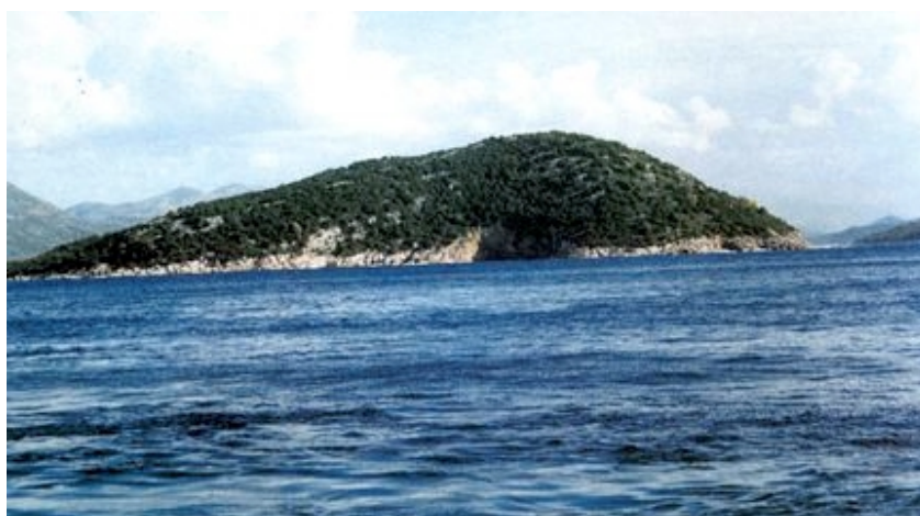
Otočić Ruda u blizini Sudurda

Nenaseljeni otočić Ruda , površine 0,4 km 2 , smješten je nedaleko jugoistočnih obala Šipana. Otočić je nekada bio prekriven gustom samonik-