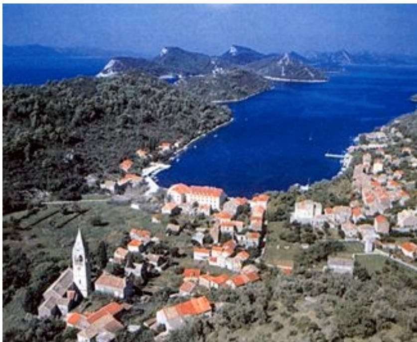
Pogled na Šipansku Luku