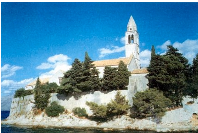
Franjevački samostan na Lopudu

U crkvi Gospe od Šunja na glavnom su oltaru drveni kipovi dvanaest apostola u naravnoj veličini s Djevicom Marijom, a po legendi ih je ovdje prenio iz Westminsterske katedrale Miho Pracat za sukoba katolika i protestanata u Engleskoj. Od brojnih vrijednih slika u ovoj crkvi ističe se i slika na drvu Gospe s djetetom i svecima J. Palme starijeg.