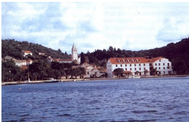
Obala i hotel u Šipanskoj Luci

U toj su uvali još otoci Crkvine , Goleč i Kosmeč te Mišnjak uz najzapadniji šipanski rt Stari brod.