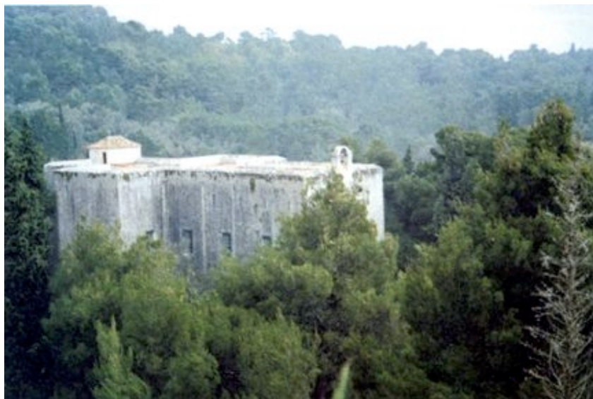
Crkva-tvrđava Sv. Duha na Šipanu

Stanovništvo se tradicionalno bavilo poljoprivredom, pretežno u velikom plodnom polju bogatom podzemnom vodom, koje se na svom najnižem središnjem dijelu i danas zimi pretvara u jezero. Po plodnosti i bogatstvu svoga velikog polja otok su još u vrijeme Dubrovačke Republike nazivali "zlatnim otokom". Svoje poljoprivredne proizvode, pretežno vino i maslinovo ulje, ali i smokve, rogače, bademe i naranče te usoljenu ribu, njihovi su brodovi razvozili u sve krajeve Jadrana. Pomorstvo se na Šipanu počelo razvijati u 14. stoljeću, a posebno se razvilo u 15. sto-