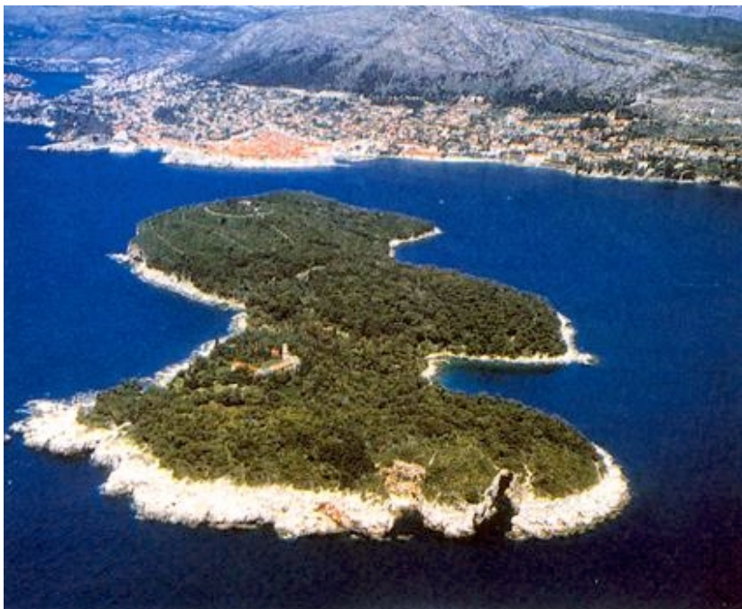
Pogled na Lokrum i Dubrovnik

Kada je dubrovačka vlast upala u financijske teškoće prodala je 1799., uz papino dopuštenje, cijeli otok privatnicima. Priča se da su tada, 4. siječnja 1799., dok je obližnji grad čvrsto spavao, benediktinci tri puta obišli otok s upaljenim svijećama okrenutim prema zemlji, izgovarajući riječi prokletstva za one koji su otok prodali i za one koji će ga u budućnosti kupiti. Kletva se vrlo brzo počela ostvarivati. Trojica plemića koji su predložili prodaju umiru neprirodnom smrću: jedan se utopio,