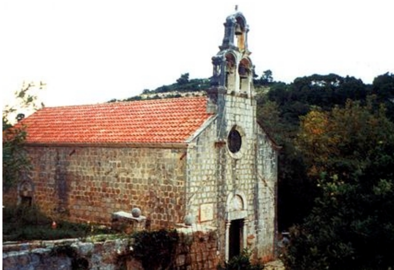
Župna crkva na Koločepu

Na mjestu parka sa suptropskim drvećem u 15. je stoljeću izgrađena kapelica Sv. Vincenca. Park je podigao Pasko Baburica, koji je rođen u Koločepu 1875. godine, a umro u Čileu 1941. godine. Sa 17 je godina napustio rodni otok i postao najbogatiji proizvođač čilske salitre u svijetu, koji je držao 30 posto ukupne proizvodnje čileanskoga 'bijelog zlata'. Imao je tridesetak tvornica i zapošljavao je mnogo radnika. Često je i obilno pomagao rodnu zemlju, posebno za vrijeme Prvoga i Drugoga svjetskog rata. Utemeljio je zakladu za pomoć i školovanje djece siromašnih i bolesnih Hrvata. Zvonik na Stradunu u Dubrovniku obnovljen je 1929. godine zahvaljujući njegovoj darežljivosti. Financirao je gradnju kamenog mola, čekaonice i ceste uokolo zaljeva u Donjem Čelu. Blizu Valparaisa u Čileu utemeljio je poljoprivredni institut Pasqual Baburizza koji se financira iz njegove zaklade, a njegova je vila u istom gradu pretvorena u spomen-muzej. Ime mu nose ulice u Dubrovniku, Zagrebu i Santiagu. Inače na Koločepu su zaštićene dvije park-šume. Uz spomenutu šumu makije s posađenim eukaliptusom i akacijom u Donjem Čelu, zaštićena je i šuma alepskog bora u Gornjem Čelu.