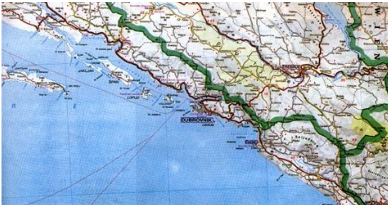
Zemljovid najjužnijeg dijela Hrvatske

otoka Lapad u sastavu grada Dubrovnika. No u tu skupinu još nisu uključeni otočić Bogutovac, sedam hrđi (Barabant, Crna seka, Galeb, Jabuka, Kuk, Lučin kamen, Opančar i Sutmihajlo) i tri grebena (Dimović, Skaleta i Vranjac). Zbrku oko ukupnog broja elafitske otočke skupine nadopunjuje i činjenica da se u njih svrstava i otočić Lokrum, smješten