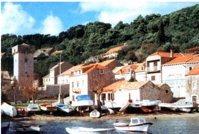
Središnji dio Suđurđa

zajedničku poljoprivrednu zadrugu, a osnovna škola, koja je u sastavu OŠ Slano , ima za svojih tridesetak učenika dva odjela. Jedan u Suđurđu