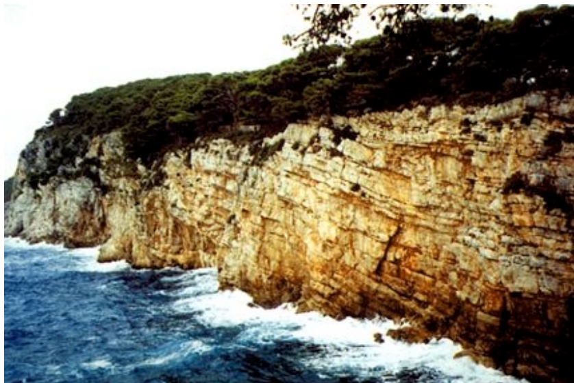
Klifovi na pučinskoj strani Koločep

Mjesni je odbor smješten u zgradi u kojoj je svoj privremeni smještaj našla i ambulanta, a liječnik s Lopuda dolazi jednom tjedno. Uskoro započnje gradnja nove ambulante što će biti zajedničko ulaganje županije i države. Voda je stigla na otok, izgrađena je i vodosprema, ali nije izgrađena lokalna mreža. Možda izgrad-