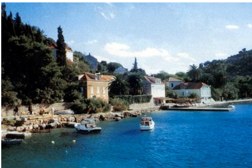
Donje Čelo na Koločepu

Zlatno doba Koločepa započinje u 15. stoljeću. Tada je izgrađeno mnogo crkava i ljetnikovaca. Elafiti i Koločep su u to vrijeme, posebno u 16. stoljeću, privlačan cilj mnogih gusarskih napada. Napad turskih brodova 1571. godine (istih onih koji su rušili Hvar, opsjedali Korčulu i opljačkali Mljet) poharao je Elafite. Tada se na Elafitima grade obrambene utvrde na svim istaknutim otočkim točkama. Na Koločepu je sagrađena