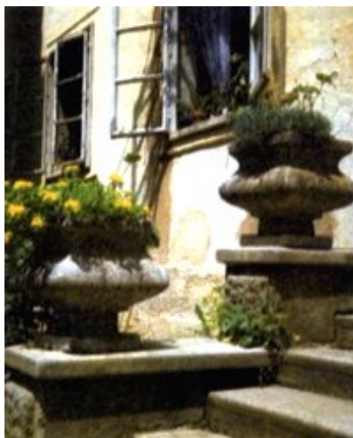
Ulaz u dvorac II.

Tloris je dvorca u obliku kvadrata sa stranicom od 46 metara i s unutrašnjim dvorištem veličine 23 x 23 metara. Tlocrt još odaje kasnorenensni odnosno ranobarokni predložak poznat pod imenom četverokrillnoga dvorca. Vanjska pročelja toga velikoga baroknoga dvorca imaju tri razine prizemlje, prvi i drugi kat), a dvorišna su pročelja jednokatna jer je prizemna razina zgrade posve zatrpana zemljom. Ulazno pročelje s portalom i prilaznim ubama ima petnaest, a bočna, također vanjska pročelja imaju 14 prozorskih otvora. Vanjska su pročelja u prizemlju oblikovana s rustikalnim horizontalnim plohamama, a na katu s pilastrima, između kojih se pojavljuje po jedan prozor. Dvorišna pročelja imaju po sedam prozorskih otvora. Izvorno su to bile otvorene kade četverokrillnoga hodnika, danas jasno uočljive, a poslije su zazidane s umetnutim prozorima. U sklopu dvorca, izbočena na sjeverozapadnom pročelju, nalazi se mala kapela, tlorisne površine oko 18 m 2 , u koju se može ući iz prvoga drugoga kata. Usprkos promjeni namjene, tlocrtna zamisao dvorca nije bitno izmijenjena. Izgrađeno je nekoliko pregradnih zidova za potrebe bolnice, ali tloris iz 1851. godine nije bitno narušen. Usporedimo li taj izvedeni tlocrt s onim iz 1742., vidjet ćemo da se od ideje do ostvarenja mnogo toga promijenilo, ponajprije u arhitektonskoj i tlorisnoj zamisli. Projekt 1742. godine bio je odviše