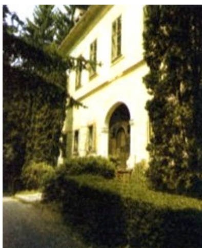
Južno pročelje dvorca II.

Ispred ulaznoga (jugoistočnoga) pročelja velikoga dvorca (dvorac I.), istodobno s njim podignuta je, na udaljenosti od 24 metra, prizemna dugačka zgrada koja je vjerojatno služila kao konjušnica, spremište za kočije i upravu gospositije. Ta zgrada,