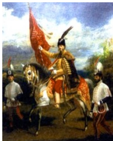
Aleksandar V. Erdödy na konju za krunidbe Franje Josipa I. u Budimpešti 1867. (ulje na platnu). Autor: Kis

Erdödyji su podrijetlom mađarska obitelj, koja je u srednjem vijeku živjela u Županiji Szatmár (danas Szabolcs-Szatmár, na istoku Mađarske), na posjedu Erdöd, kojega je vlasnik bila obitelj Dragfy de Beltek. Sinovi Franje Bakoča (Bakocs; u Hrvat-