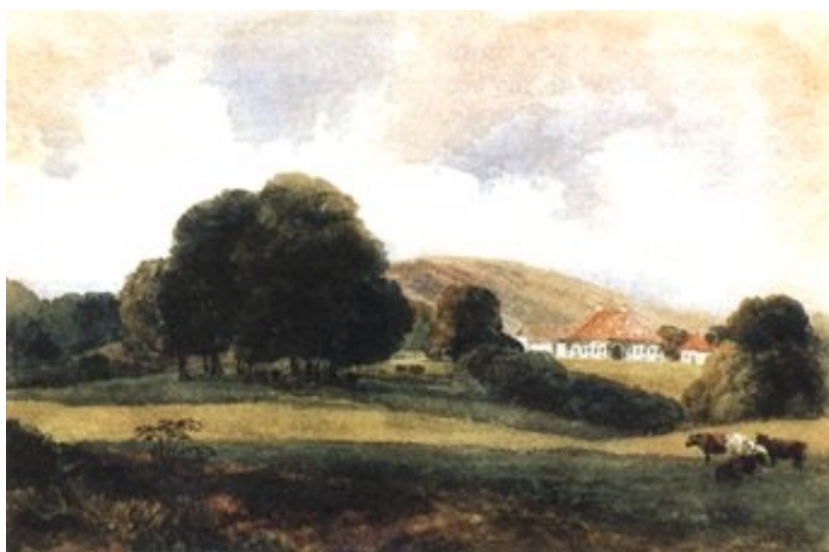
Posjed Moslavina (ulje na platnu, 1837.). Autor: Aleksandar Erdödy

Bečki je dvor pokušavao oteti Erdödyjima Moslavinu, ali bezuspješno. Erdödyji nisu imali nikakve koristi od Moslavine cijelo 17. stoljeće, jer je to bila pusta i nenaseljena zemlja koje su se stanovnici raselili prilikom turskih osvajanja. Prva polovica 18. stoljeća prošla je u naseljavanju te ustrojavanju i jačanju gospoštije, a u drugoj polovici 18. stoljeća gradi se nov veliki dvorac kao sjedište moslavačkoga vlastelinstva, zatim poštanska cesta (Božjakovina, Križ, Popovača, Kutina ... ) i prve manufakture sukna na rječici Jelenka (1780. god.).