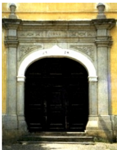
Ulaz u dvorac I.

Arhitektonski i povijesno najvrjedniji i najzanimljiviji jest veliki dvorac (dvorac I.), koji je građen za Jurja te za braću Ladislava i Ludovika grofove Erdödy. Gradnju dvorca, započetoga oko 1746. godine, vodio je Matija Marković, upravitelj slavonskih i posavskih (Sisačka Posavina) dobara Jurja Erdödyja. Osim dvorca izgrađen je majur s brojnim zgrada-