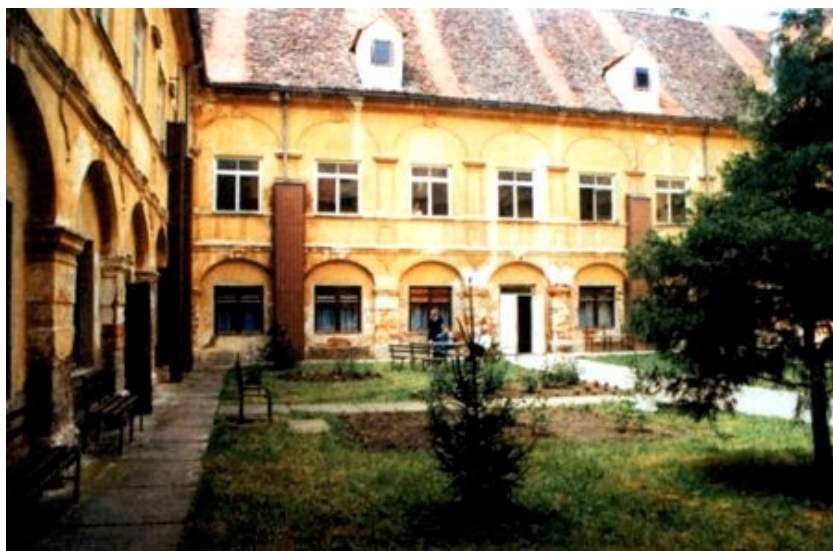
Unutrašnje dvorište dvorca I.

tena u sva tri popovačka dvorca i u mnogim drugim uz njih izgrađenim građevinama. Mučnom dojmu pridonosi i ne odveć lijep park s brojnim bolesnicima koji šeću uokolo. Ovaj je veliki posjed očigledno dobro rješenje za smještaj jedne velike psihijatrijske bolnice, ali bi bolje održavanje dvorca i više brige o održavanju okoliša, posebno održavanju novih i zaista neprikladnih građevina, vjeroj-