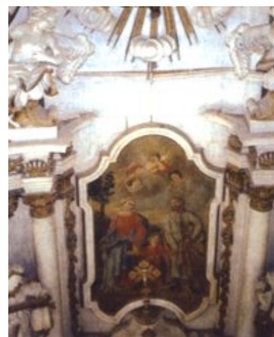
Pogled s pjevališta na oltar dvorske kapele

Sjedište gospoštije bilo je još od srednjega vijeka utvrđeni feudalni grad Moslavina, izgrađen nakon provale Tatara u Hrvatsku, između 1242. i 1294. godine. Budući da su Erdödyjevi vojnici napustili utvrdu prije ulaska Turaka, grad je ostao neoštećen. Pošto je hrvatski ban Toma II. Erdödy protjerao Turke iz Moslavine 1591. godine, zapalio je i razorio staru djedovsku utvrdu kako ne bi opet bila cilj napada turske vojske. Budući da se oslobođenje Slavonije od Turaka još nije slutilo, a Turci su kanili obnoviti obližnji Jelengrad, Toma grof Erdödy i Hrvatski sabor razmišljali su o obnovi Moslavine. Osobito je to bilo potrebno nakon mira sklopljenoga s Turcima 1606., kada je Moslavina pripala Hrvatskoj i tako postala granična utvrda prema