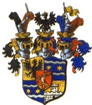
Grb grofova Erdödy

Popovači, kao mjestu između Moslavačke gore i Lonjskoga polja, prepoznatljivost i povijesno značenje daje sklop nekadašnjega vlastelinskoga sjedišta, poznatoga pod imenom Moslavina. Od sredine 19. stoljeća naziv Moslavina počinje se koristiti i kao zemljopisni pojam za područje omeđeno na istoku rijekom Ilovom, na jugu i zapadu rijekom Lonjom, a na sjeveru rijekom Česmom, unutar kojih se nalazi Moslavačka gora. Ime Moslavina u ovom se tekstu koristi u tradicijskom značenju, tj. kao ime za posjed, vlastelinstvo i njegovo sjedište, koje se danas nalazi u Popovači.