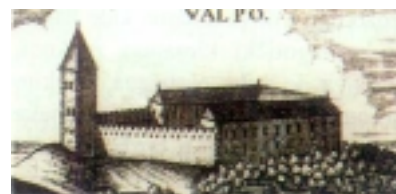
Valpovačka utvrda 1690. godine (grafika)

beg Murad-beg Tardić. Nakon 144 godine turske vlasti, austrijski general Dünnewald prisilio je 30. rujna 1687. tursku posadu u valpovačkoj tvrđavi na predaju.