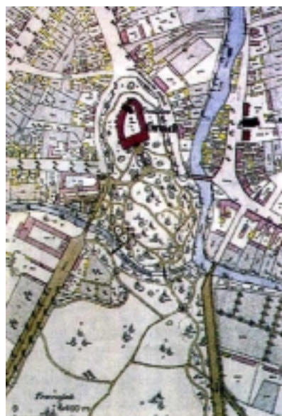
Katastarska karta, 1863.

je jedino omogućivalo širenje i izgradnju dvorca po tadašnjim baroknim načelima. Utvrda je tijekom 18. stoljeća popravljena i prilagođavana novoj ulozi. Taj prvi dvorac bio je sličan današnjem i može se vidjeti na portretu Petra Antuna Hillepranda iz 1750. godine. Nije se sačuvao jer je nestao u požaru zajedno s dvorskom knjižnicom i obiteljskom pismospremom na Silvestrovo 1802. godine. Izgorjeli dvorac počinje se obnavljati već početkom 1803. Obnova dvorca pokrenula je živu graditeljsku djelatnost jer su se osim dvorca gradile i brojne gospodarske zgrade jugozapadno od dvorca. Gradnja