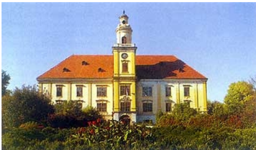
Glavno (južno) pročelje dvorca

nutim obiteljima: Hilleprand von Prandau i Normann-Ehrenfels. Obitelji Hilleprand, podrijetlom iz Tirola, dodijeljeno je plemstvo 1579. u doba cara Rudolfa, a viteško plemstvo 1674., kada im je car Leopold I. proširio grb i dodao pridjevnik de Prandau. Postoji priča koja kaže da Prandau dolazi od njemačkih riječi Brand-Au što znači "gorući gaj", čime se htjelo obilježiti velik šumski požar na njihovu imanju u Tirolu. Goruće stablo na obiteljskom grbu podsjeća na taj događaj. Barunski naslov Sv. Rimskog Carstva obitelj nosi od 3. siječnja 1704. kada je on dodijeljen Petru Antunu. Ugarski indigenat dobio je Petar Antun 1723. godine. Obitelj Normann potječe od staroga plemstva iz 13. stoljeća. Podrijetlom je, prema obiteljskoj predaji, s otoka Rugen, a poslije iz Würtenberga (Njemačka). Obitelj je dobila grofovstvo 1809. u Würtenbergu. Obitelji Normann podijeljeno je, prema zaključku Hrvatskoga sabora, ugarsko-hrvatsko plemstvo 1896. i nakon toga upisano je u maticu plemstva Virovitičke županije.