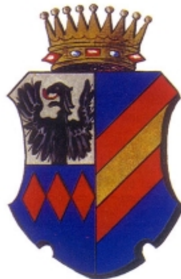
Grb grofova Normann-Ehrenfels

Povijest dvorca, vlastelinstva i samoga mjesta Valpovo isprepletено je i povezano s dvjema, već spome-