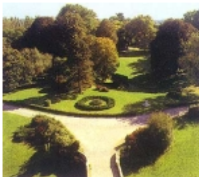
Pogled na perivoj s tornja dvorca nakon obnove započete 1988. godine

perivoj između Jadike i šume te šuma koja se protezala do Zvjerinjaka. Perivoj u cijelosti posjeduje obilježja pejzažne parkovne arhitekture, koja su osobito prepoznatljiva u dijelu perivoja između Jadike i šume. Tu se isprepliću dopadljivi vidici s pros-