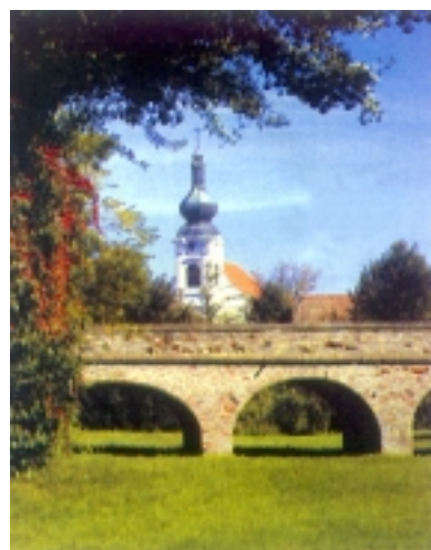
Prilazni most na ulasku u dvorac. U pozadini župna crkva u središtu grada

nude skladno isprepletanje raznolikih stilskih elemenata: od srednjovjekovne robusne kule i pune, dugačke plohe srednjovjekovnoga ziđa, preko jednostavnih baroknih dvorišnih fasada i uresnih baroknih profilacija sjevernoga pročelja kapele do barokno-klasicističkoga reprezentativnoga ulaznog pročelja, okrenutoga perivoju. Južnom, glavnom (ulaznom) pročelju dvorca prepoznatljivost daje istaknut središnji rizalit koji poput kvadratičnoga tornja izlazi iz krovništva te svojom visinom i valjkastim završetkom s malom kupolom nadvisuje inače visoko barokno krovništvo. Pilastri sedmoosno raščlanjenoga pročelja dijele fasadnu plohu na polja u koja su, osim na uglovima, postav-