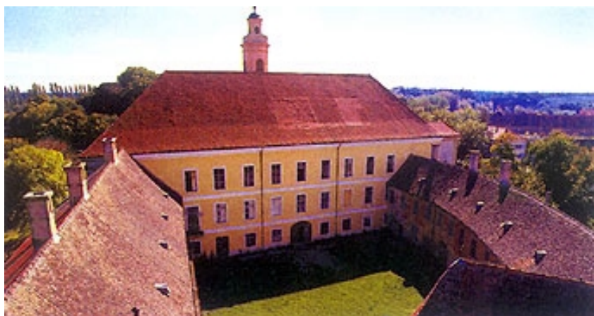
Unutrašnje dvorište snimljeno sa srednjovjekovne kule

Kada je Rudolf I. grof Normann-Ehrenfels preuzeo valpovačko vlastelinstvo 1892. godine, počeo je preustrojavati upravu. Početkom 20. stoljeća vlastelinstvo je posjedovalo 16.190 hektara (28.157 jutara) poljodjelskoga zemljišta i 9822 hektara šuma. U prva dva desetljeća 20. stoljeća slabi poljodjelstvo na posjedu, a povećava se sječa šuma. Kriza vlastelinstva bila je najveća nakon 1918. godine, kada ono potpada pod agrarnu reformu koja završava 1934. oduzimanjem poljodjelskih površina i likvidacijom poljodjelskoga imanja. Vlastelinstvu je ostalo samo 865 jutara poljodjelskih površina i 18.835 jutara šume pa se to podijelilo među djecom Rudolfa I. prema njegovu darovnom ugovoru iz 1928. godine. Rudolfu II., odnosno valpovačkom vlastelinstvu, ostala je polovica šuma i preostala zemljišta. Takvo je imanje dočekalo završetak Drugoga svjetskog rata i konačno ukidanje.