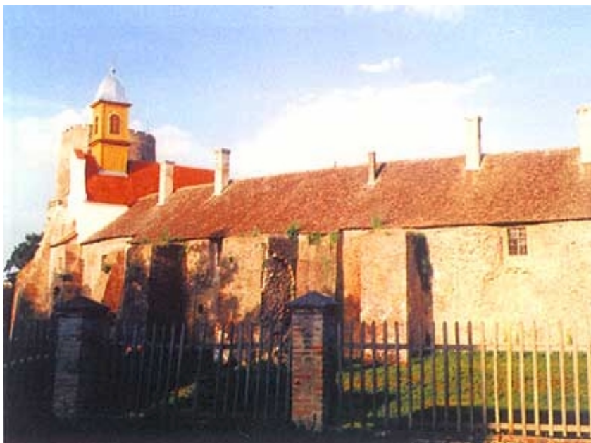
Sjeverozapadni dio dvorca s obnovljenom kapelicom i kulom

pad. Potom se u fatalnu ljepoticu zaljubio i osvajač - Murad-beg, koji ju je htio uključiti u svoj harem. No to je ona također odbila pa je bila