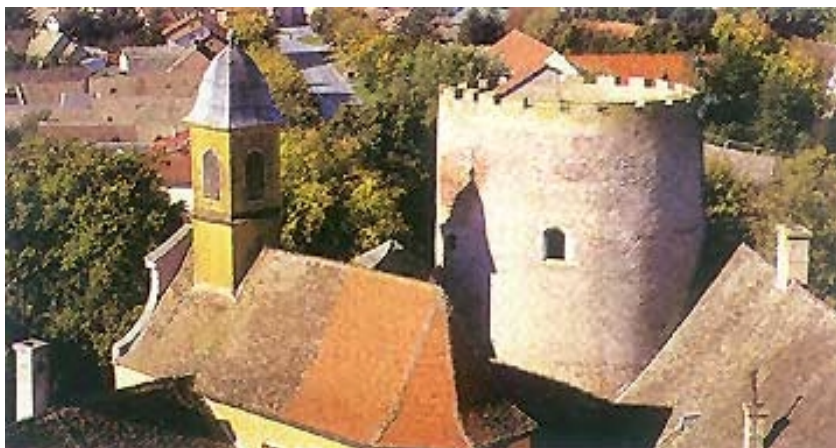
Sjeverni dio utvrde s kapelom i kulom

Valpovački sklop dvorca i utvrde slikovit je i arhitektonski vrijedan. U njemu se zamjećuju različita stilska razdoblja izgradnje. Osobito je to prepoznatljivo na pročeljima koja