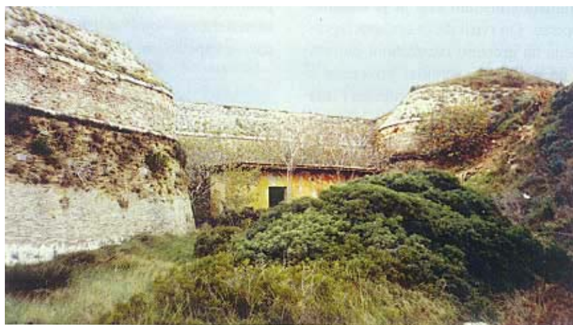
Između krakova "klijesta" tvrđave

izvještaju Senatu 1542., Gian Girolamo se žalio da mu nedostaje građevnog materijala, ponajprije sedra, vapno, cigla i drvo te razni alati potrebni za građenje. Ako se osigura novac doveli bi se prijeko potrebni klesari za klesanje kamena na gradilištu i za vađenje i obradu sedre koja se dopremala s rijeke Krke. Naime, tvrđava se u donjem dijelu gradila od kamena, a u preostalom dijelu od