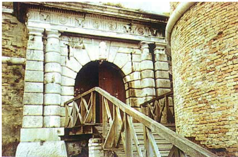
Glavna ulazna vrata u tvrđavu

države. Lava i prigodni natpis oštetili su francuski vojnici. Car Franjo I. je nakon svog posjeta tvrđavi 1824. naredio da se iskleše novi lav i postavi na vrata.