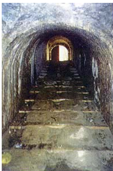
Stubište za izlaz na terasu tvrđave