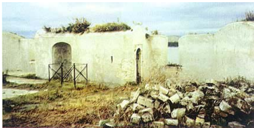
Obrambeni kasteljeri na terasi

U prostorima na morskoj razini razlikuje se kružna forma od dugih pravokutnih prostora. U torionu je sačuvano sedam kazamata s topovskim otvorima. Na istoj razini u zapadnom dijelu, prema otvorenom moru i otoku Zlarinu, i danas je sačuvano šest kazamata, a prema kopnom dijelu dva topovska otvora. Prostor je tvrđave pod svodovima zaista impresivan. Sastoji se od tri pra-