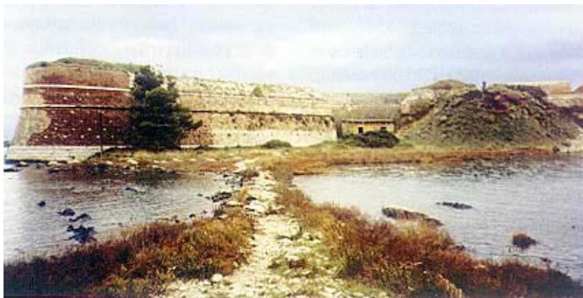
Prilaz tvrđavi s kopnene strane

O izgradnji tvrđave postoji jedan dokument iz 1540. godine koji do detalja opisuje građenje i mjere nove građevine. Kako je to vrijeme početka izgradnje, riječ je o svojevrsnom tehničkom opisu. Kada je tvrđava završena ne može se pouzdano ustanoviti. Zna se da je već 1544. godine na nju postavljen kastelan, što znači da je bila djelomično izgrađena, ali ne i završena. No za fortifikacijske se građevine nikada ne može reći da su u cijelosti završene jer se