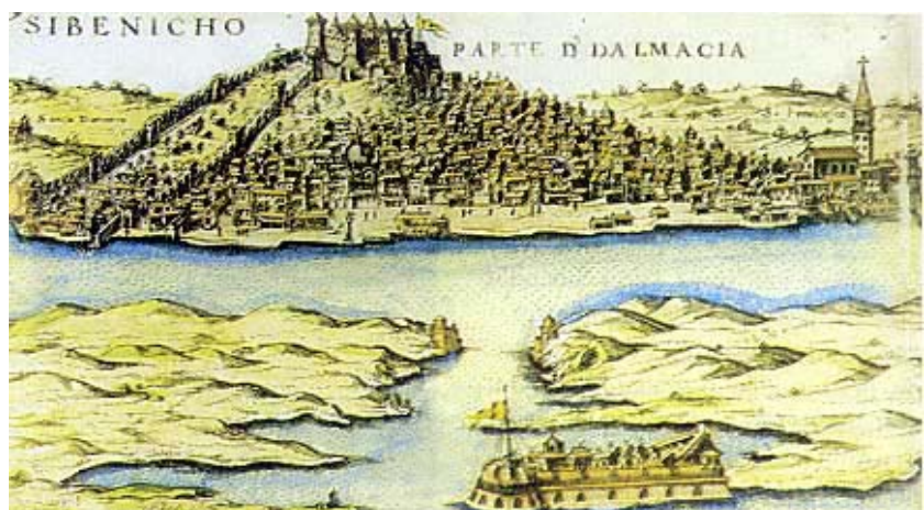
Prikaz Šibenika iz 17 stoljeća (iz djela Viaggio da Venetia a Cistantinopoli G. Rosacia). U donjem dijelu je tvrđava Sv. Nikola

utvrđenom kaštelu Sv. Mihovila (prvog zaštitnika Šibenika), a ta se utvrda poslije zvala Sv. Ana da bi joj nedavno opet bio vraćen najstariji povijesni naziv. Poslije se vlast nad Šibenikom mijenja u skladu sa sudbinom ostalih dijelova Dalmacije, pa Šibenikom vladaju naizmjenice hrvatsko-ugarski kraljevi, kneževi Šubići, bosanski kraljevi i Venecija. Velika je vrijednost Šibenika u