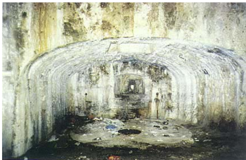
Otvor za top s tragovima postolja

Najveće je promjene tvrđava doživjela na svojoj terasi, još u vrijeme mletačke uprave kada se visina mjestimično povećavala, a značajno su se