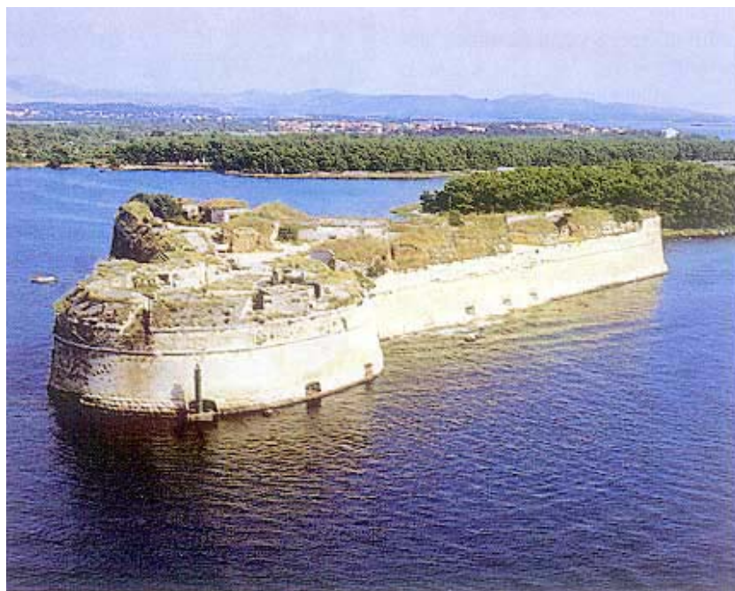
Tvrđava Sv. Nikole snimljena s mora

vrijeme kada M. Baglion obilazi moguće lokacije, crkva Sv. Nikole na otoku Ljuljevcu je u ruševnom stanju, a ruševne su i zgrade neka-