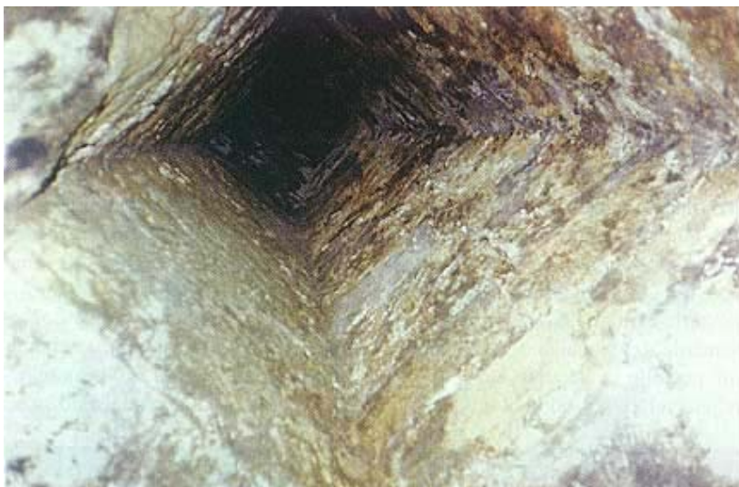
Otvori za odvod barutnog dima

mijenjali i zaštitni kavaljeri uz rub terase. No velike su se promjene dogodile početkom 19. stoljeća, iako su zadržane neke čvrste građevine na terasi, ponajprije one koje su služile za smještaj posade i kao skladišta baruta. Krajem 19. stoljeća uslijedila je još jedna velika rekonstrukcija i ti su radovi pretežno obavljani na terasi. Radovi su izazvani instaliranjem velikih obrambenih topova, zapravo uvođenjem žlijebnih umjesto glatkih topovskih cijevi. Postavljeni su novi topovi prema kanalu Sv. Ante i izvedeni novi otvori. Ta je gradnja, za