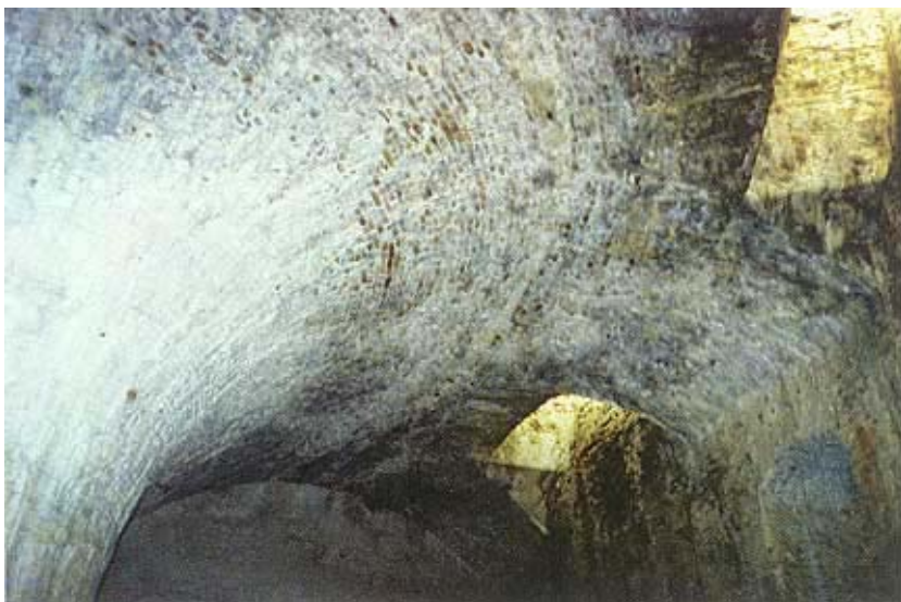
Svjetlarnici u stropovima