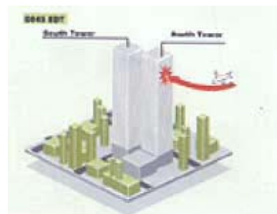
Grafčki prikaz pogotka zrakoplova u sjeverni toranj

Za prihvaćanje tih golemih opterećenja inženjeri su konstruirali tornjeve World Trade Centra ponajprije kao velike gredne presjeke, objasnio je sljedeći sudionik u raspravi Robert McNamara, predsjednik inženjerske tvrtke McNamara i Salvia . Iako poslovno nazvani konstrukcijskim cijevima, svaki je od tornjeva bio jaka okvirna čelična konstrukcija. Okvir se sastojao od unutarnje i vanjske pravokutne sandučaste cijevi koju su sačinjavali zbijeni čelični sandučasti stupovi povezani čeličnim gredama koje su pridržavale više od 3700 četvornih metara križno napetih stropova. Ta je konfiguracija učvršćivala vanjsku cijev koja je obuhvaćala