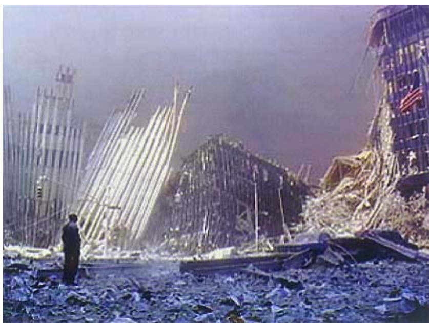
Ruševine World Trade Centra

Putnički zrakoplovi Boeing 767 , koji su pogodili tornjeve blizance, nešto su veći od starog tipa Boeing 707 (871 t u odnosu prema 741 t) čijim je udarima, kažu, konstrukcija po proračunima mogla odoljeti. Ali ti zrakoplovi sadržavaju slične količine goriva (otprilike 109.000 l u odnosu prema 105.000 l), pojasnio je prof. Eduardo Kausel. Ističe do tome ne bi mogla odoljeti ni jedna zgrada, a od male je koristi bilo kakav sustav