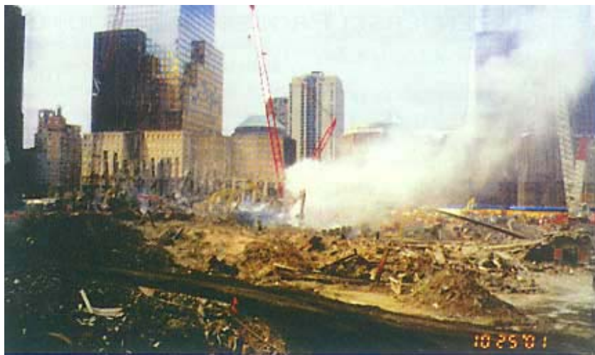
Šest tjedana nakon tragedije i dalje je tinjala vatra

Od brojnih pitanja upućenih okupljenim stručnjacima svakako je najzanimljivije ono da li bi se dogodilo isto da su oteći putnički zrakoplovi na isti način udarili sadašnju najvišu zgradu na svijetu - 452 metra visok Petronas Towers u Kuala Lumpuru u Maleziji. Odgovoreno je da bi betonska konstrukcija vjerojatno izdržala nekoliko sati više, ali da bi se ipak srušila. Ing. McNamara je dodao kako su mnogi suvremeni super-