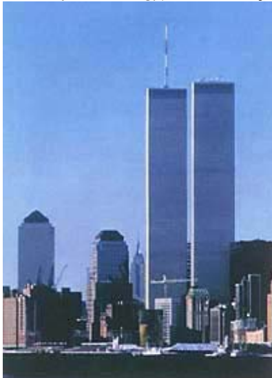
Pogled na dio New Yorka i zgrade World Trade Centra

Od mnogobrojnih rasprava znanstvenika i stručnjaka koje su se tim povodom održale, ili će se još održavati, izabrali smo raspravu u sveučilišnom kampusu MIT-a ( Massachusetts Institute of Technology ), održanu mje