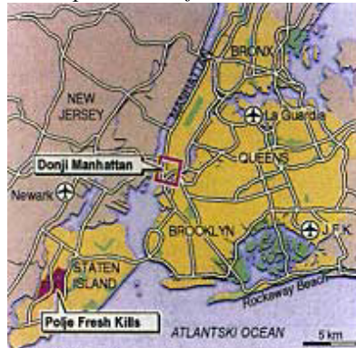
Dio Manhatana s označenim položajima srušenih tornjeva i odlagališta ruševina

sec dana nakon napada, a objavljenu u časopisu Scientific American . Me