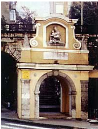
Portal trsatskih stuba pokraj Rječine na Sušaku

i na Trsatu. No kasnije im se izgubio svaki trag, posebno jer je Trsat pao pod odlučujućim utjecaj Habsburgovaca te se time odvojio od ostalog Vinodola. Knapi su bili podanici oslobođeni nekih kmetskih dužnosti, ali su imali obvezu čuvati kaštel i održavati javni red.