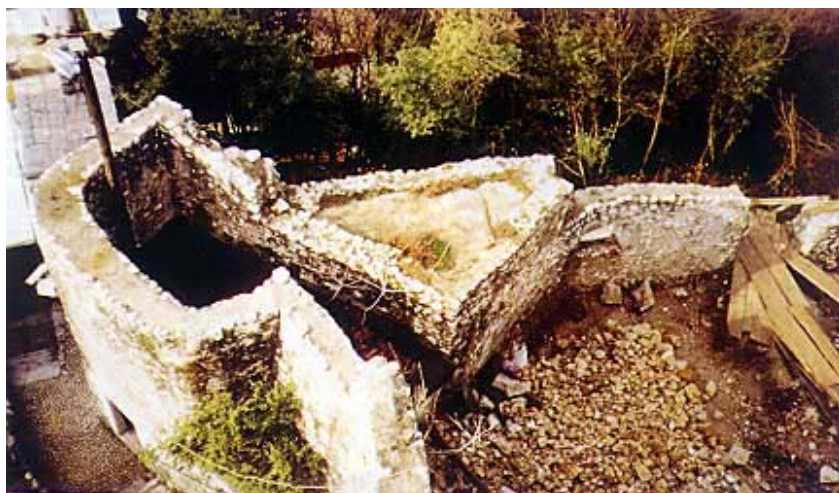
Dio trsatskih utvrda koji se sada istražuje i restaurira

No već je početkom 1843. zabranjeno Ilirsko ime zbog čudnih memoranduma Ljudevita Gaja ruskom caru, ali je za Hrvatsku politički bilo još pogubnije da je Laval Nugent maknut s položaja zapovjednika Vojne krajine. Grof je Metternich naime procijenio da je njegov negdašnji suradnik iz napoleonskih ratova postao prejak u Hrvatskoj.