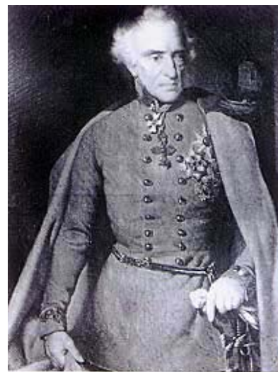
Felmaršal grof Laval Nugent of Westmeath iz 1851. (kopija prema Amerlingu)

Priči o trsatskoj utvrdi valja dodati još nekoliko povijesnih zanimljivosti. Ponajprije one koje se odnose na po-