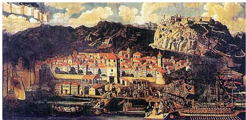
Doček cara Karla VI. u Rijeci 1728.

O Trsatu nema mnogo tragova iz 13. i 14. stoljeća i za njegovu povijest nisu bitna trvenja među frankopanskim knezovima i njihovim diobama. Trsat, Bakar, Bribir, Modruš i Novi mijenjali su raznorazne gospodare iz ove slavne obitelji. Bili su od 1360. pod zajedničkom upravom Stjepana I. Kako su preostali okolni frankopanski gradovi imali poseban sloj privilegiranih stanovnika, nazvanih knapima, vjerojatno su oni postojali