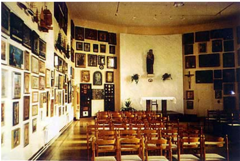
Kapela zavjetnih darova pomoraca

Novo je svetište primilo mnoge i vrijedne darove. Pisali smo već (u napisu o kliškoj utvrdi) o izgradnji stuba prema trsatskom svetištu, koje je započeo graditi legendarni junak Petar Kružić, čija je otkupljena glava i sahranjena u trsatskoj crkvi. On je dogradio kapelicu Sv. Nikole i izgradio prvih 128 stuba. Preostale četiri kapele izgradili su drugi donatori, a stuba je do broja 561, koliko ih danas ima, izgradio zapovjednik Brinja Gavro Aichelburg. Zabilježeno je da su se nerijetko misionari znali po stubama penjati na koljenima, od čega je na kamenju bilo i krvavih tragova.