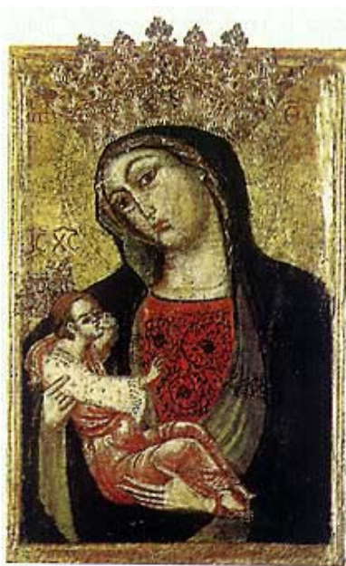
Čudotvorna slika Gospe Trsatske

Prema predaji je vlasnik Trsata krčki knez Nikola I. poslao već 1294. izaslanstvo na čelu s župnikom Aleksandrom u Palestinu da provjeri navode o prijenosu kućice. Njihovo je izvješće bilo potvrdno, pa je odmah početkom 14. stoljeća na mjestu gdje je stajala Sveta kućica izgrađena kapela, a 1431. Martin Frankopan (sin Nikole IV.) počinje graditi crkvu i samostan koji dograđuje i dovršava 1453. te ga ustupa franjevcima Bosanske vikarije, koji su za razliku od konventualaca Dalmatinske franjevačke provincije pripadali opservantima, tj. strože su primjenjivali uredbu o siromaštvu. Frankopani u godinama što slijede dodjeljuju brojne prihode i posjede franjevačkom samostanu i marijanskom svetištu. Slava je tog svetišta značajno uvećavala njihov ionako visok značaj i ugled.