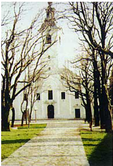
Pročelje crkve Gospe Trsatske

No ta je čudna kućica stajala tamo do 10. prosinca 1294. kada su je anđeli podigli i odnijeli u Italiju, najprije u blizini grada Ancone, a potom u Loreto, gdje je danas svetište Gospe Loretske, a preko kućice je izgrađena veličanstvena crkva.