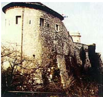
Sjeveroistočna kula i sjeverne zidine

Laval Nugent of Westmeath, grof, feldmaršal, vitez reda Zlatnog runa, zapovjednik reda Marije Terezije i rimski princ, rodio se u Ballynocoru u Irskoj 3. studenoga 1777., a umro je u Bosiljevu 21. kolovoza 1862. te sahranjen u mauzoleju na Trsatu. Pripadnik je slavne obitelji podrijetlom iz Francuske, iz Normandije, koja je bila u srodstvu s brojnim najstarijim europskim dinastijama. Davni predak Lavalov, Retrua III., istaknuo se u III. križarskom ratu kada se prvi uspeo na zidine već spominjanog Acra. I sin se tog Nogenta (kako su se onda zvali) također borio u Svetoj zemlji. Jedan se potomak s francuskim princem Louisom borio i poginuo u Engleskoj u bitci protiv kralja Johna. Gilbert de Nugent, najstariji predstavnik irske grane obitelji, došao je u tu zemlju u 12. stoljeću i odmah je imenovan barunom od Delvina. U obitelji je još bilo mnogo slavni ratnika. Jedan je Nugent pao u boju protiv Turaka pri opsadi Budima, a drugi poginuo u Laudonovoj vojsci, također protiv Turaka. Jedan je sudjelovao i istaknuo u Sedmogodišnjem ratu, a drugi pao u obrani Gibraltara 1707. Mnogi su tijekom stoljeća obavljali razne diplomatske, političke i administrativne funkcije.