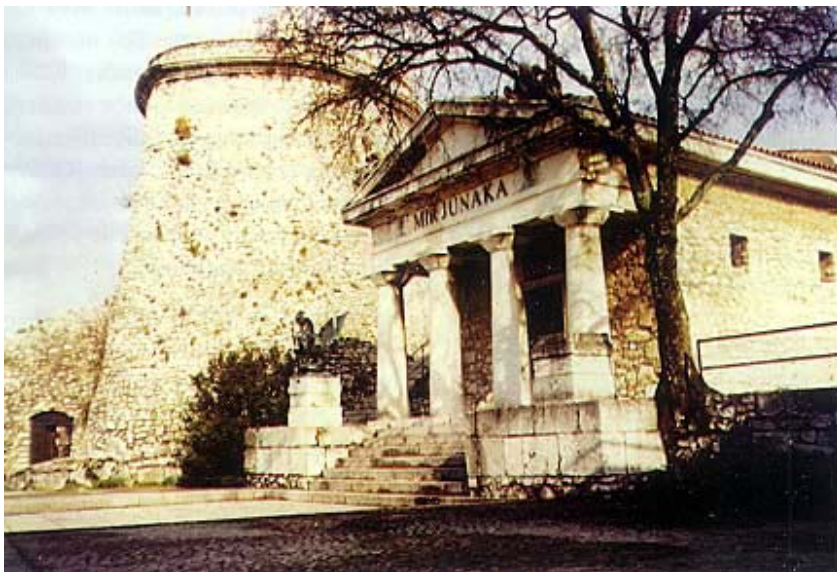
Mauzolej Mir junaka i tzv. rimska kula