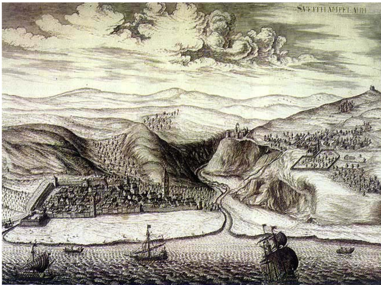
Crtež Rijeke i Trsata inženjera Martina Stiera iz 1660.

povezanosti Trsata i Tarsatice bilo je ponajprije zasnovano na sličnosti imena, iako na prostoru trsatske utvrde nikad nisu pronađeni nikakvi