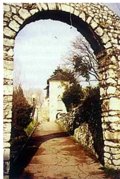
Glavni ulaz na trsatsku gradinu

Laval Nugent odlazi u Englesku gdje dobiva čin brigadnog generala. Bavi se povjerljivim diplomatskim zadacima te prenosi povjerljive informacije između pruskoga, austrijskoga i engleskog dvora. Od Wellingtona 1813. iz Španjolske donosi povjerljive dokumente u Beč, a nakon toga Austrija navješćuje rat Francuskoj. Laval se vraća u austrijsku vojnu službu. Vojnom vijeću predlaže da se sa svojom postrojbom probije kroz Hrvatsku do mora te tako odsječe francuske vojnike u Dalmaciji i poveže se s engleskom flotom. Pošto je prijedlog odbijen, na svoju ruku, sa samo tisuću vojnika, provodi svoj smioni plan. Njegova brigada, prethodnica feldmaršala von Radivojevića, prešla je Savu kod Zagreba i došla do Karlovca. Tu im se pridružila slunjska satnija, a nakon konta-