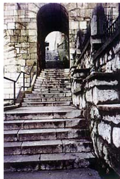
Detalj trsatskih stuba

Rekli smo već da je na Trsatsku utvrdu snažno utjecala blizina velikoga marijanskog svetišta Gospe Trsatske s velikim franjevačkim samostanom. Uz nastanak svetišta vezano je mnoštvo legenda. Najpoznatija je ona prema kojoj su anđeli prenijeli kućicu Sv. Obitelji iz Nazareta. Dogodilo se nakon pada posljednjeg uporišta križara obalnog grada St. Jean d'Acre (današnji Akkon u Siriji). Grad je pao 10. svibnja 1291., a iste je noći, prema predaji, nazaretska kućica osvanula podalje od župne crkve Sv. Jurja, na mjestu zvanom Ravnica, u vlasništvu neke udovice Agate. Bila je sagrađena od cigle sivozelene boje, 44 pedlja dugačka, 20 široka, a 28 visoka. Narod se ujutro vrlo začudio, ali je bolesni trsatski župnik Aleksandar smjesta objavio da mu se u snu ukazala Majka Božja i priopćila da je riječ o istoj kući u kojoj je an-