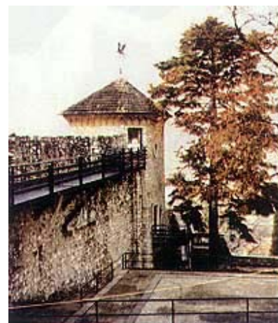
Ulazna kula u trsatsku utvrd

Izgradio je raskošni dvorac Stelnik kraj Bosiljeva u vrijeme dok je bio vojni zapovjednik Primorja. Potom je neko vrijeme zapovjedajući general u Šleskoj i Moravskoj, a u hrvatsku politiku otvoreno ulazi 1840. kada je nakon smrti bana Vlašića trebao preuzeti njegovu dužnost. No protiv toga su zbog njegova prevelikog hrvatstva bili Mađari, pa Laval Nugent postaje "samo" zapovjednik Vojne krajine. Ilircima kao najmoćniji velikaš pristupa početkom 1841. godine. Nastoji da ilirizam postane stranka koja će vladati Hrvatskom te veselo slavi, zajedno s ostalim velikašima