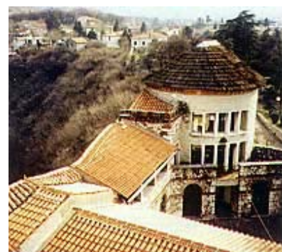
Pogled s rimske kule na krovšta i sjeveroistočnu kulu

(Drašković, Oršić, Kulmer, Zdenčaj...), prvu pobjedu 1842. nad mađaronima za činovništvo zagrebačke županije.