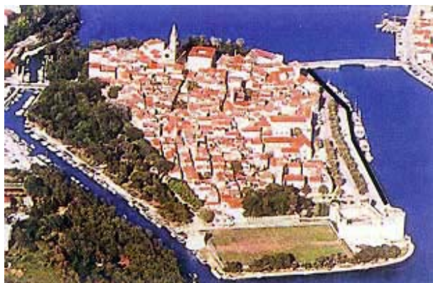
Slika 1. Glavna Trogirska obala

U radu je ukratko prikazano rješenje obnove Trogirske obale od mosta za Čiovo do kule Kamerlengo, u ukupnoj duljini od približno 400 m (slika 1.).