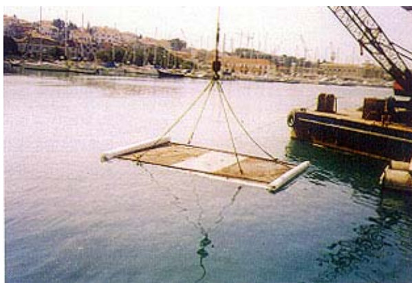
Slika 5. Polaganje geotekstilne mreže

Sukladno očekivanju, pri izvođenju radova ustanovljena su odstupanja u odnosu prema pretpostavljenim uvjetima temeljenja duž velikog dijela duljine zida. Na jednom dijelu obale naišlo se na drvene pilote i nešto lošiju kvalitetu temeljnog tla i na većoj dubini od očekivane (1-1,5 m). Stoga je na ovom potezu obale korigirano projektno rješenje temeljenja obalnog zida koje je opisano u nastavku.