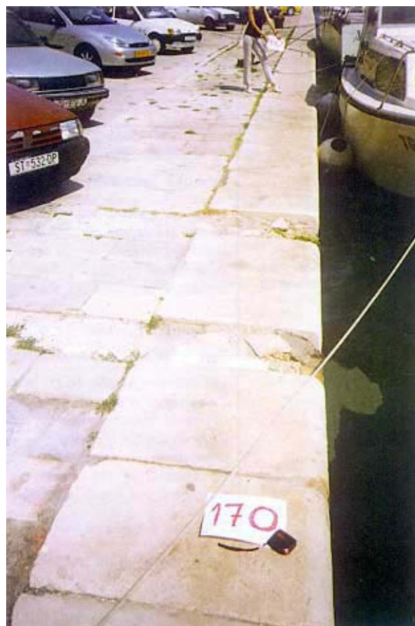
Slika 2. Tipični izgled obale prije sanacije

Na temelju provedenih istražnih radova i analiza, utvrđeno je da je postojeća obala u nezadovoljavajućem stanju i da ju je potrebno hitno sanirati [1], [2], [3]. Nedostaci i oštećenja obale (slika 2.) mogu se svrstati u tri osnovne grupe: