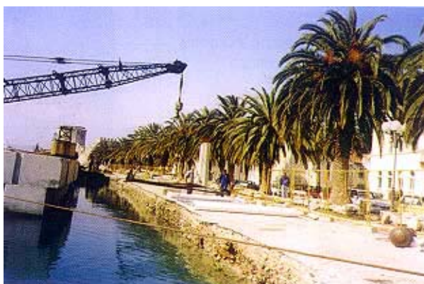
Slika 6. Predopterećenje kamenog nabačaja betonskim blokovima