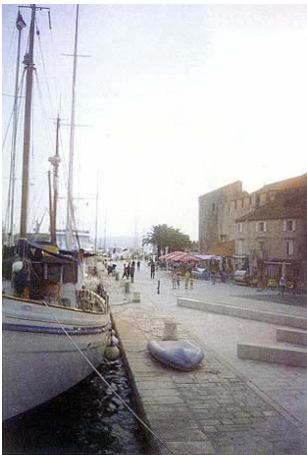
Pogled na obnovljenu obalu s Čiovskog mosta

Nakon iskopanog sloja mulja i slabo zbijenoga nenosivog nasipa, do kote prihvatljivo zbijenog tla, ugrađene su geotekstilne mreže (slika 5.). Njihova je najvažnija funkcija sprječavanje prodora mulja u temeljni kameni nabačaj.