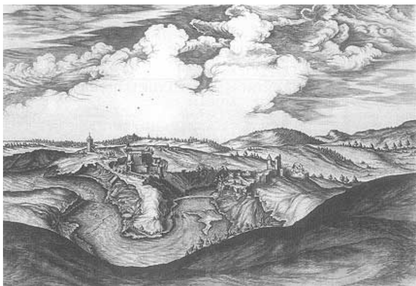
Stierov crtež Slunja s utvrdom (pogled s juga)

ska. Čak je pomalo nejasno je li se najstarija povijesna spominjanja Slunja odnose na taj prvobitni Slunj ili na sadašnji podignut na kamenitoj uzvisini velike okuke Slunjčice. Svakako valja uvažiti činjenicu da najpouzdaniji istraživač naših povijesnih utvrda Gjuro Szabo spominje odluku hrvatskih staleža još iz 1558. "da kralj utvrdi i Zrin, Komogovinu, Prekoverški Gradac, Svinicu i novi Slunj".