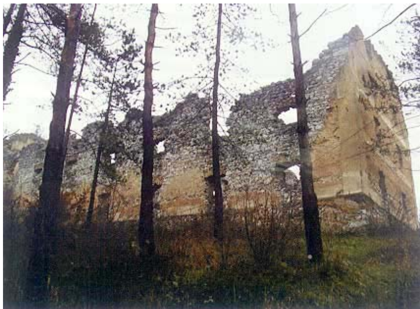
Ostaci zgrade zvane Magazin iz Napoleovih vremena

Slunj je 1876., zaslugom bana Ivana Mažuranića, dobio Građansku školu. U Slunju je rođen Eugen Kvaternik koji je 1871. podigao Rakovičku bunu. Rođen je u zgradi zvanoj Viličićeva sala, koju je u drugoj polovici 19. st. držala obitelj Kvaternik. Ta je kuća jednim dijelom služila kao prebivalište za poštanske kirijaše, a prizemno su bile staje za konje koji su prevozili poštu. Ta je kuća, baš kao i zgrada Građanske škole te Hrvatskog katoličkog doma, zapaljena u Drugom svjetskom ratu, kada su baš kao i za nedavne okupacije stradale mnoge slunjske kuće. Za okupacije u vrijeme Domovinskog rata bile su srušene i popaljene i Rastoke u kojima su neke kuće starije od 300 godina.