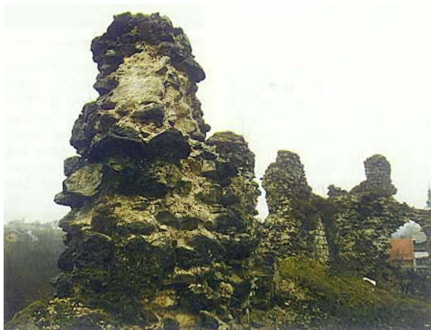
Pogled iz unutrašnjosti na ostatke zidova utvrde

Drugi je poznati crtež J. W. Valvasora, na kojem je pogled na slunjsku utvrdu sa zapada, ali je taj crtež, kao i mnogi drugi tog autora, potpuno nevjerodostojan. Nakon mira u Srijemskim Karlovcima 1699. nastalo je nekoliko crteža autori kojih su L. F. Marsiglije (voditelj stručnog tima za utvrđivanje granice) i J. F. Hollstein. Na tim je crtežima drukčiji raspored zidova i zgrada unutar glavne frankopanske građevine, ali je nemoguće ustanoviti je li to posljedica promjena pri obnovi ili su je izazvale nepreciznosti crtača. Istodob-