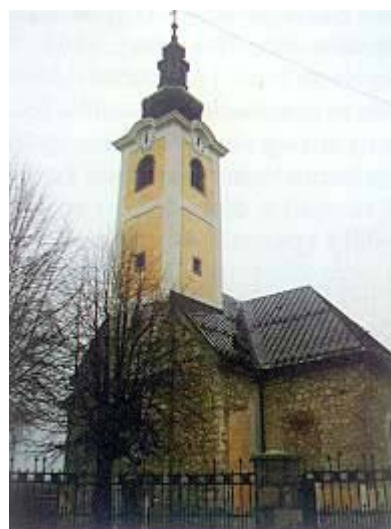
Obnovljena crkva Presv. Trojstva u Slunju

Nedavno smo posjetili Slunj i njegovu utvrdu. Ono što nas je odmah zadržalo je činjenica da su gotovo svi tragovi nedavnih ratnih stradanja gotovo potpuno uklonjeni. Još u početku saniran je prelijepi most prof. Tonkovića preko Korane, u međuvremenu su obnovljene Rastoke koje su opet zablistale u svojoj rasokošnoj ljepoti, a obnovljene su i gotovo sve srušene i popaljene kuće. Obnovljena je i crkva Presv. Trojstva kojoj je na zahtjev konzervatora vraćen nekadašnji izgled. Zapravo preostaje samo da se na pročelju uredi dekorativna plastika.