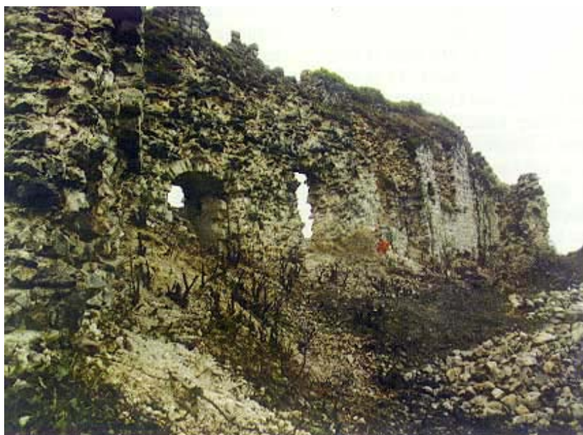
Najočuvaniji dio utvrde snimljen iznutra

Nakon reforme hrvatske Vojne krajine 1746. osnovana je Slunjska regimenta (pukovnija). Tako je Slunj u pravom smislu postao vojno središte svog područja. Regimenta je (kako se precizno navodi) obuhvaćala 64 naselja sa 2276 kuća i 5216 muškaraca od 16 do 60 godina, sposobnih za oružje. Bila je to četvrta regimenta u karlovačkom generalatu, a imala je 12 kompanija (četa): Lađevac, Vališselo, Krstinja, Blagaj, Budački, Vojnić, Poloj, Barilović, Vukmanić, Švarča, Oštrc i Žumberak. Svaka kumpanija imala je po četiri voda, zapravo četiri dijela ili 'ftrtalja'. Štab je regimente kasnije preseljen u Barilović te u Karlovac, ali i dalje nosi ime Slunjske regimente. Od 1788. do 1799. Slunj je, kao što je