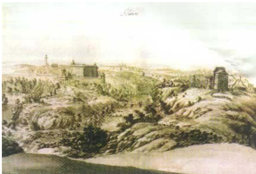
Slunj iz 1730. prema crtežu M. A. Weisa

Na crtežima se uočava da je nepravilna peterokutna frankopanska građevina okružena vanjskim obrambenim zidom kojega s juga i istoka pojačavaju četiri okrugle kule, a s najmanje zaštićene istočne strane iskopana je široka graba. Gradu se pristupalo iz smjera naselja, preko mosta na Slunjčici i vijugavom stazom sa strme zapadne strane do ulaza na sjeverozapadnom uglu. Cijeli je sustav ulaza razrađen i prolazom se dolazi do kule unutar koje se zaokreće pod pravim kutem, pa se preko pok-