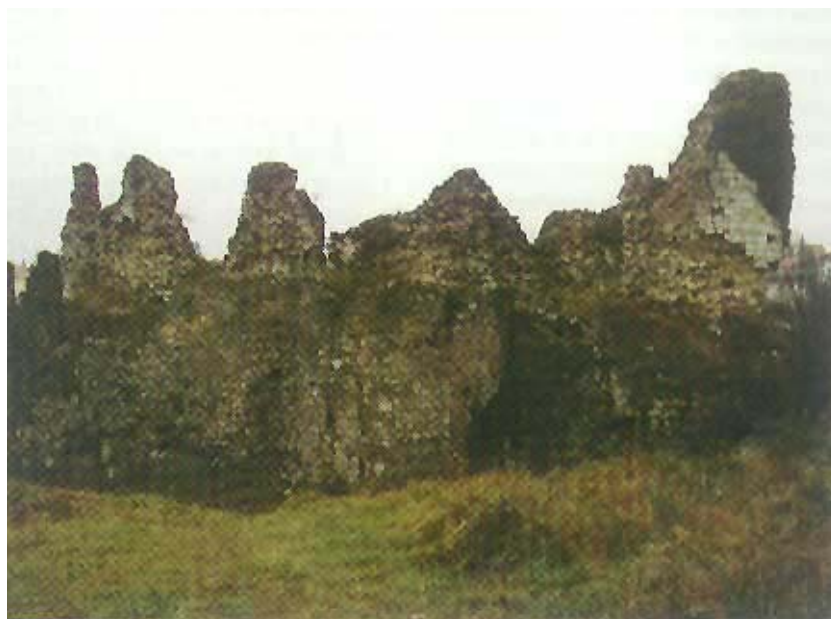
Ruševine slunjske utvrde gledane s istoka

Šesnaesto je stoljeće inače vrhunac turske ekspanzije prema Zapadu. Nakon poraza na Krbavskom polju 1493., a posebno nakon poraza blizu Mohača 1526., pod tursku vlast postupno dolazi cijela Slavonija i Lika. Turci se približavaju Slunju koje postaje strateški važno mjesto na putu prema Bihaću, ondašnjoj najsigurnijoj hrvatskoj utvrdi i od 1527. sjedištu bihačke kapetanije. Frankopani su primorani prepustiti obranu svojih utvrđenih gradova carskoj vojsci. Tako nekadašnja plemićka