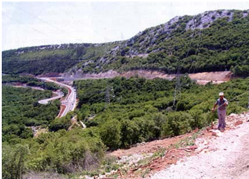
Radovi na čvoru Bakar 1

konstruirana je cesta D8, a između Jadranske turističke ceste i Sv. Kuzama izgrađena je prva etapa u duljini od 450 m.