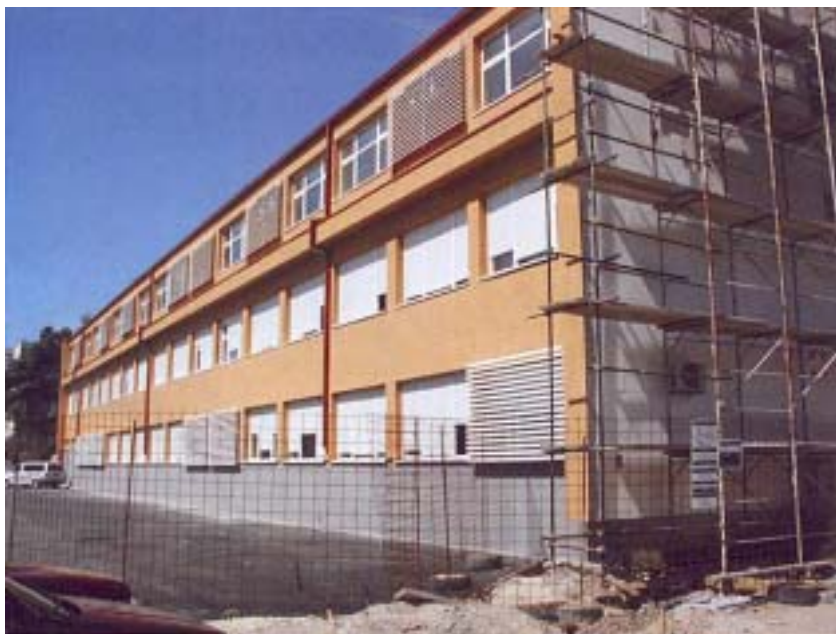
Pogled na gradilište Doma zdravlja s ulične strane

na, školske djece, medicinu rada i djelatnost ispostava. Također su na tom katu sačuvane prostorije za rad uprave. Na drugom je katu predviđen stacionar za roditelje i ostale korisnike. Postojat će i zajedničke prostorije za prijam i odjelne ambulante, prostori za pripremu i obradu pacijenata s reanimacijom i postoperativnom njegom te potrebni higijenski sadržaji. Sve će sobe imati vlastite sanitarne blokove, a svi su prostori za odjelne