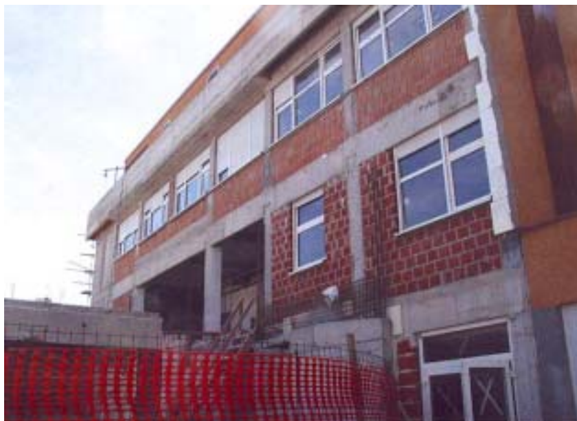
Radovi na dilataciji A1