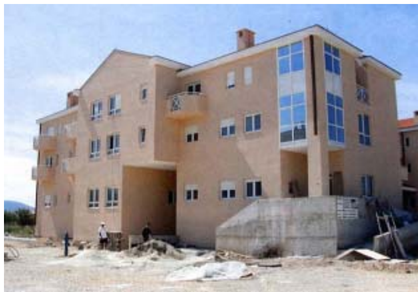
Nova zgrada Doma za tjelesno oštećene, stare i nemoćne osobe u Metkoviću

dipl. ing. stroj. Gotovo su u cijelosti okrenuti visokogradnji, a najčešći im je investitor država. Jedna im je od najvećih izvedenih građevina Ekonomski fakultet Sveučilišta u Splitu. Trenutačno najviše grade u Sinju, gdje grade školu, dom za socijalnu skrb i zgradu poticane stanogradnje. Još jednu školu grade u Splitu, dom socijalne skrbi u Kaštelima i zgradu poticane stanogradnje u Gospiću. Razgovarali smo i sa Zdenkom