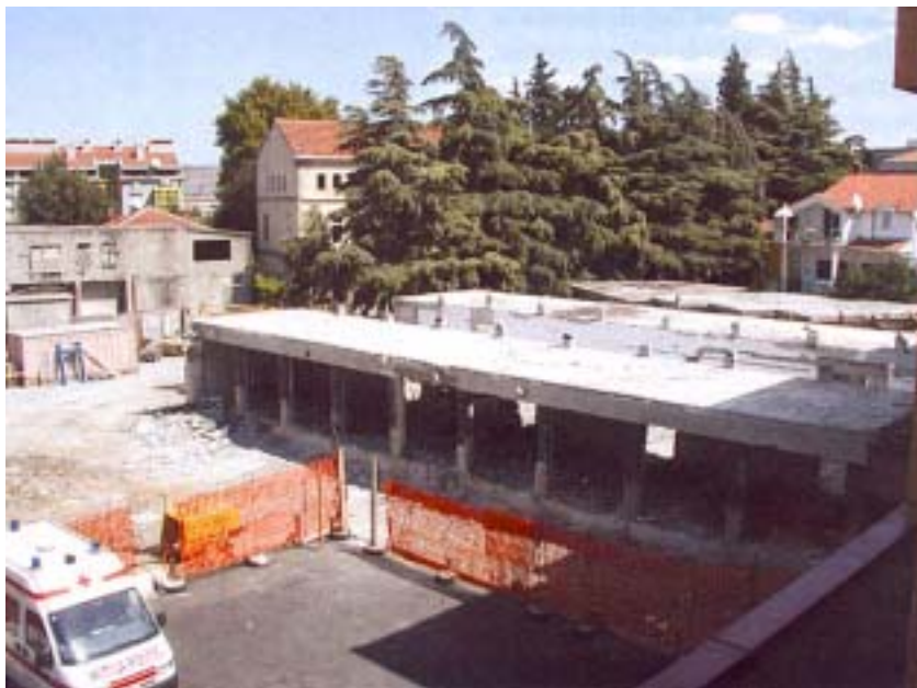
Pomoćna građevina kojoj tek predstoji adaptacija

je povezivala dilataciju A s dilatacijom B, također prizemnicom.