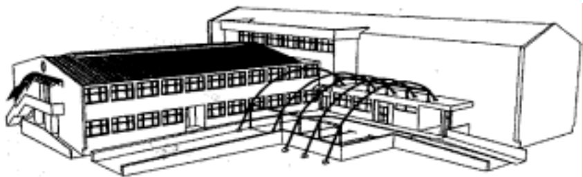
Skica budućeg izgleda Doma zdravlja u Metkoviću

Upravo su ratna zbivanja, a posebno rat što je potom uslijedio u susjednoj Bosni i Hercegovini, i potaknula ideju o boljoj zdravstvenoj zaštiti ovog područja, govori nam Mihovil Štimac, dipl. oec., ravnatelj Doma zdravlja u Metkoviću. Tada je u podrumu robne kuće koja se nalazi u blizini Doma zdravlja bilo smješteno mnoštvo ranjenika, a bilo je i do 4000 medicinskih intervencija na mjesec. Zbog toga su ondašnji ministar zdravlja dr. Andrija Hebrang i župan dubrovačko-neretvanski dr. Jure Burić donijeli odluku da se u Metkoviću, radi bolje zdravstvene zaštite stanovništva, blizine granice te gotovo podjednake udaljenosti najbliže bolnice (Split 125 km, Dubrovnik 100 km), započne graditi nova bolnica. Inače