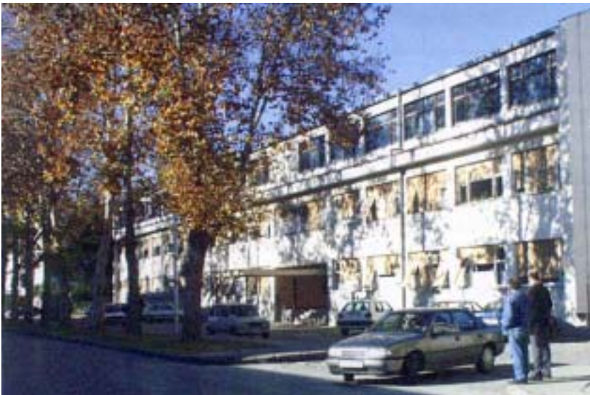
Pogled na Dom zdravlja u Metkoviću prije dogradnje i adaptacije

je bio vrlo važan u obrani zemlje jer je zauzimanjem Metkovića i izbijanjem na ušće Neretve neprijatelj namjeravao odsjeći južni dio Hrvatske.