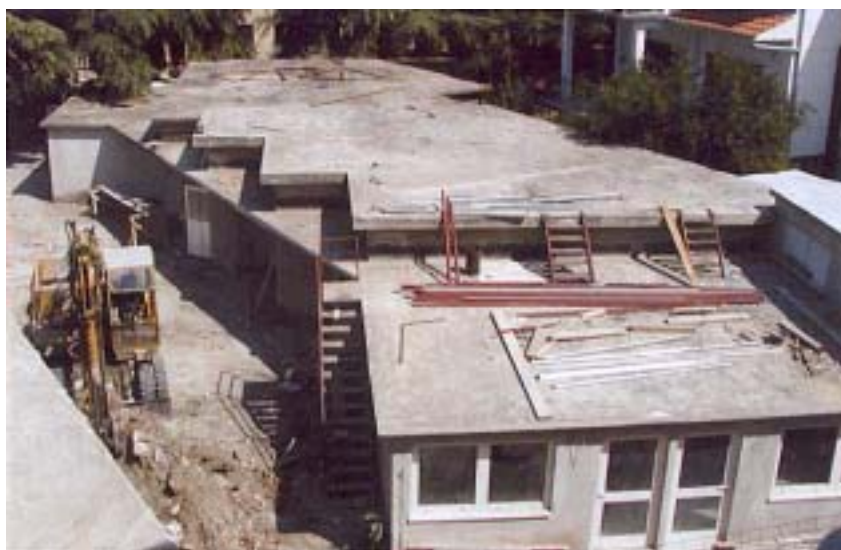
Radovi na dilataciji B

Zatečeno stanje u postojećoj zdravstvenoj ustanovi zaista je bilo neprikladno, osim novoga adaptiranog prostora rendgena i hemodijalize, a posebno su bile dotrajale sve instalacije koje je trebalo u cijelosti mijenjati. Iako su se dovodne i odvodne instalacije i priključci obnavljali za potrebe dogradnje rendgena i hemo-