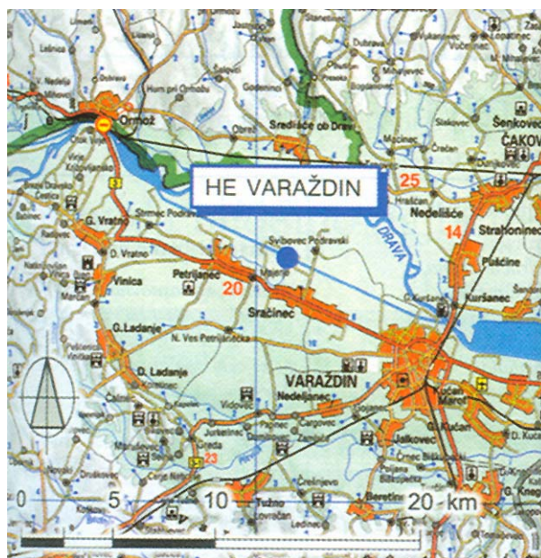
Slika 1. Položaj HE Varaždin na zemljovidu

Hidroelektrana je izgrađena u relativno kratkom vremenu (4,5 godine), a u rad je puštena 1975. godine.