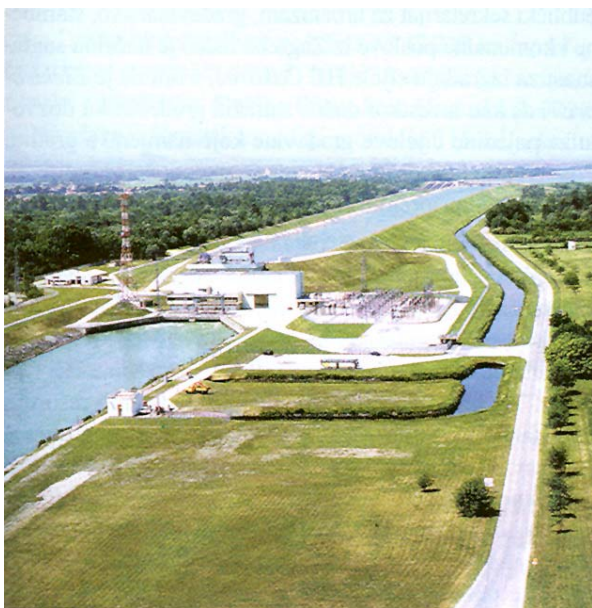
Slika 4. Pogled na HE Čakovec

površina, razvoj lova i turizma, povećanje zaposlenosti i sl.). Izvoditelj građevinskih radova Hidroelektra iz Zagreba tada je bila bez većih poslova, a posjedovala je veliku mehanizaciju koja je radila na završnim radovima autoceste Zagreb – Karlovac i na HE Varaždin .