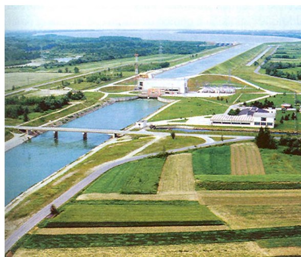
Slika 6. Pogled na HE Dubrava