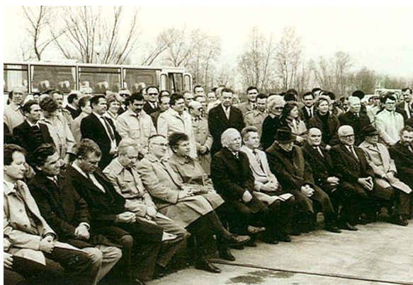
Slika 7. Sa svečanog puštanja u rad HE Dubrava