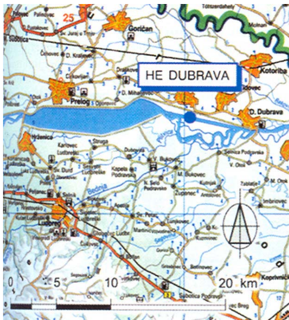
Slika 5. Položaj HE Dubrava na zemljovidu

Hidroelektrana se sastoji od istih glavnih dijelova kao i uzvodne elektrane. Mnoga specifična rješenja koja su prvi put primijenjena na prvoj uzvodnoj brani, ponovljena su ovdje s mnogo više iskustva i sigurnosti. Izgrađena je jedinstvena građevna jama za pokretni dio brane, u koju je procjeđivanje vode smanjeno glinobetonским uspravnim "visećim" zidovima, čime je ostvarena velika ušteda troškova građenja. Nadalje, pokretnom branom postiglo se 0,5 m viši uspor nego na uzvodnoj brani pa je došlo do povećanja protočnosti (gotovo 6.000 m 3 /s), a učinjena su i neka druga poboljšanja.