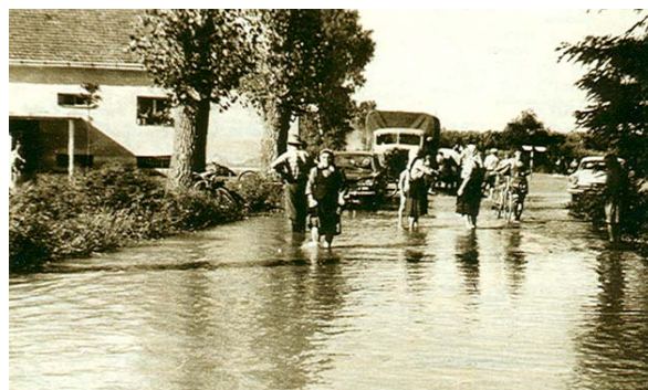
Slika 8. Poplava Drave u Kotoribi 1960.

Višenamjenske energetske stepenice na Dravi iskoristile su snagu i silu rijeke te je pretočile u električnu energiju, ali nisu zloupotrijebile tu rijeku. Štetne posljedice su minimalne u odnosu na koristi višenamjenskih objekata. Ponovimo: Osim korištenja vodnih snaga, brani se zemljište od poplava i odnošenja plodnog zemljišta, poboljšava se od-