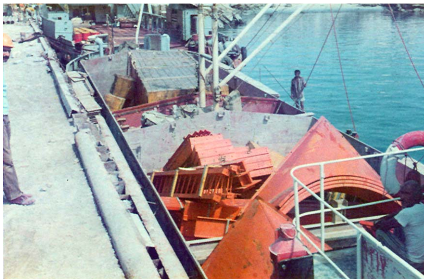
Iskrcaj građevnog materijala s barži na otoku Lavanu

Službeno je državno jugoslavensko izaslanstvo 1969. predvodio predsjednik Tito. S obzirom na međunarodnu ulogu i značenje predsjednika Tita i pokreta nesvrstanosti, izaslanstvo je dočekano s najvišim državnim počastima. Bilateralna privredna i gospodarska suradnja bila je među glavnim temama. Posjet jugoslavenskog izaslanstva posebno je i s odobravanjem praćen u svim tamošnjim medijima, a to je stvaralo dodatno povoljno ozračje za Ingrino poslovanje.