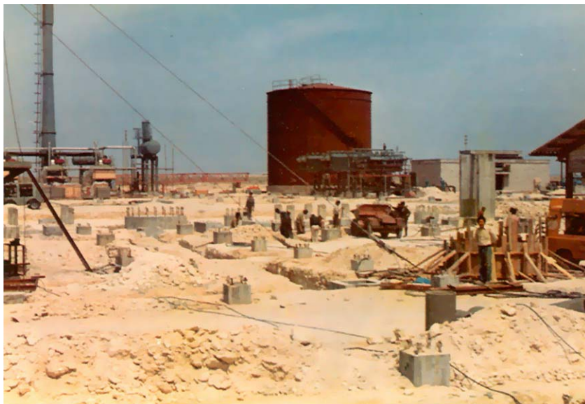
Gradnja rafinerije nafte na otoku Lavan u Perzijskom zaljevu

tvorio je brojnu društvenu klasu koja se prema procjenama odnosila na 20 do 25 posto stanovnika u zemlji. Taj se dio stanovništva pretvorio u tipično američko i prozapadno potrošačko društvo, što je već onda stvaralo socijalna nezadovoljstva i sukobe.