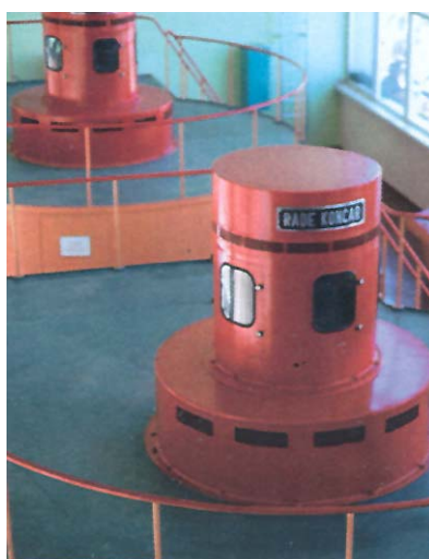
Elektrogeneratori u strojarnici HE Mahabad

bili: Institut za naftu iz Zagreba, kasniji Ina Engineering (tehnološki i elektrostrojarski projekt te izvedbeni projekt za građevinske radove s nadzorom građenja), Metalna iz Maribora (izrada i montaža destilacijske kolone i dijela strojarne opreme), Brodogradilište 3. maj iz Rijeke (izrada i montaža destilacijske kolone i dijela strojarne opreme), Rade Končar iz Zagreba (izrada i montaža elektrotehničke opreme) i Jugoturbina iz Karlovca (proizvodnja dizelskog generatora i pripadajuće opreme).