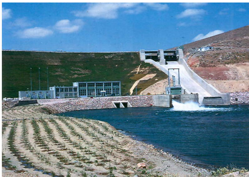
Pogled na strojarnicu brane i preljevne ispuste brane HE Mahabad

Od 1967. počeli su se intenzivnije nuditi i ugovarati različiti investicijski projekti u Iranu. Na temelju ponuda i pregovora ugovoreni su sljedeći poslovi: