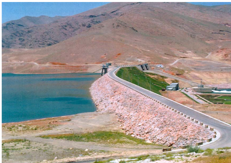
Pogled na dio akumulacije i branu HE Mahabad

Poslovnom je i marketinškom analizom utvrđena važnost stalnih osobnih kontakata s poslovnim partnerima, pa je Ingra usvojila praksu imenovanja i upućivanja stalnih predstavnika (tada zvanih delegata) u zemlje koje su u razvojnim planovima predviđale izgradnju investicijskih objekata zanimljivih za Ingru . To su uglavnom bile zemlje dovoljno ekonomski i financijski snažne da su mogle pouzdano jamčiti plaćanje i zemlje u razvoju koje su dobivale povoljne zajmове od Svjetske banke i njezinih asocijacija te drugih međunarodnih razvojnih financijskih institucija. Tako je Ingra 1965. imenovala i uputila predstavnika u Teheran u Iranu i privremeno ga smjestila u ured poslovnog partnera Ingre . S obzirom na već vođene pregovore o