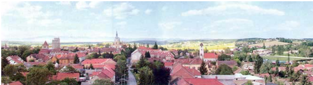
Današnja panorama Križevaca

Posebno jača gospodarstvo. U gradu postoji pivnica, dvije tiskare, pivovara, paromlin, nekoliko hotela ili svratišta, a osniva se i štedionica. Otvaranje Gospodarskog i šumarskog učilišta 10. listopada 1860., prvog takve vrste na jugoistoku Evrope, u mnogome je pridonijelo napretku poljoprivrede, ne samo u Križevcima, već u čitavoj sjevernoj Hrvatskoj. Nedaleko grada prošla je 1870. i željeznica, na putu od Budimpešte preko Zagreba do Rijeke.