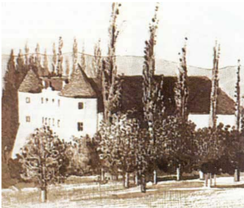
Jedna od rijetkih sačuvanih slika Guščerovca

hoczy. Udajom Guščerovec prelazi u vlasništvo obitelji Keglević, potom Patačić i Sermage. Posljednji je vlasnik bio barun Ljudevit Ožegović, carski i kraljevski komornik, ali i poznati slikar. Neke se njegove slike čuvaju u okolnim crkvama, a naslikao je i dvorac Guščerovec koji je sada u seoskoj crkvi Sv. Antuna. On je 1910. rasparcelizirao posjed i prodao ga seljacima.