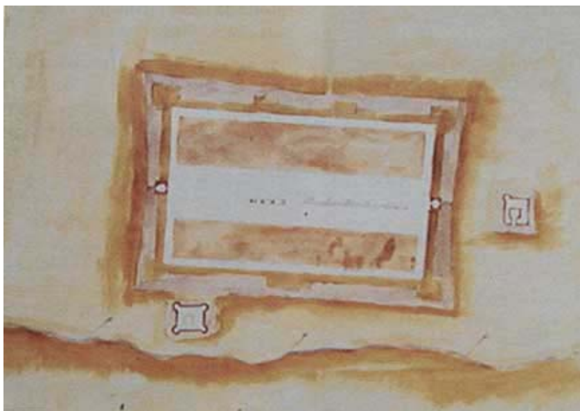
Križevačka utvrda na starom nacrtu iz 15. st.

U privilegiju se točno utvrđuju i granice naselja (kaže se " nuova et libera villa in Crisio ") pa je uočljivo da