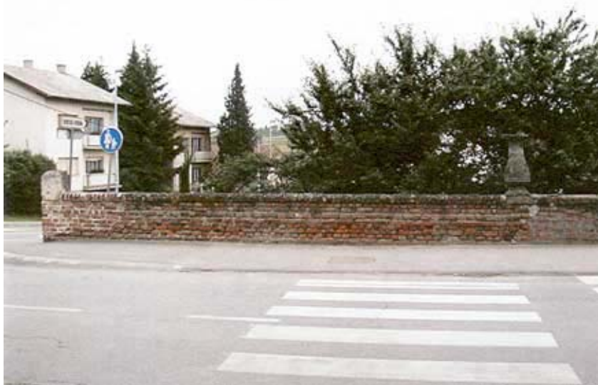
Posljednji ostaci križevačkih utvrda

Rat se ponovno razbuktao dolaskom u bosanski pašaluk ratobornog Hasan-paše Predojevića - Došena. On je s 5000 vojnika navalio na gornju Slavoniju, ali je u blizini Križevaca pretrpio poraz. Početkom Dugoga turskog rata (1593. - 1606.) Križevci postaju snažno vojno žarište i mjestom odakle su napadani turski gradovi i sela. Od 1594. je u Varaždinu zapovjednik slavonske granice general Hans Sigismund Herbenstein. On je odmah nakon imenovanja sa 1500 vojnika iz Križevaca opustošio Cernički sandžakat. I 1597. jedna je križevačka postrojba opustošila Slatinu, Orahovicu i Stupčanicu te spalila