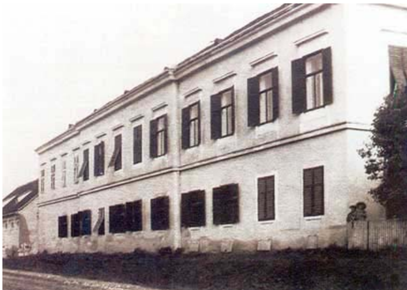
Dvorac obitelji Kiepach u Križevcima, srušen 1945.

Za grad je važan događaj bio osnivanje Ilirske čitaonice. U gradu djeluje i privatna glazbena škola, pjevačko društvo Zvono , a poslije i Slavuj koji okuplja slušatelje Gospodarskog učilišta.