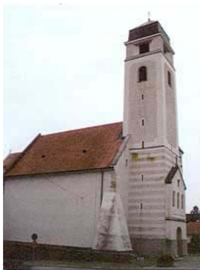
Crkva Sv. Križa