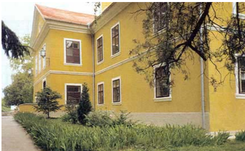
Dvorac Gradec snimljen prije nekoliko godina