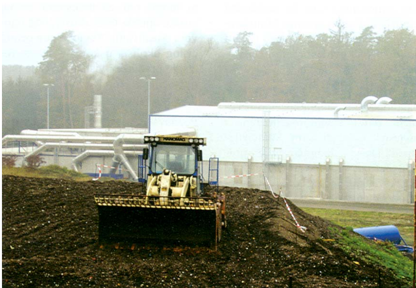
Odlaganje usitnjenog otpada u pogonu tvrtke ASA

se posvuda uočava u toj lijepoj alpskoj zemlji. Potpuno je prihvatila sva očekivanja koja je prema svim zemljama postavila Europska unija. Doduše, temeljita se briga o odlaganju komunalnog otpada u Austriji vodi više od 15 godina, a ta se zemlja posebnim propisima i brojnim ekološkim akcijama te drugim aktivnostima u "hodu" prilagođava sve strožim kriterijima i sve većem tehnološkom napretku u postupanju s otpadom. Iako se svaki otpad obrađuje, ipak prema postojećim propisima u tretiranom otpadu organski otpad ne smije biti veći od tri do pet posto.