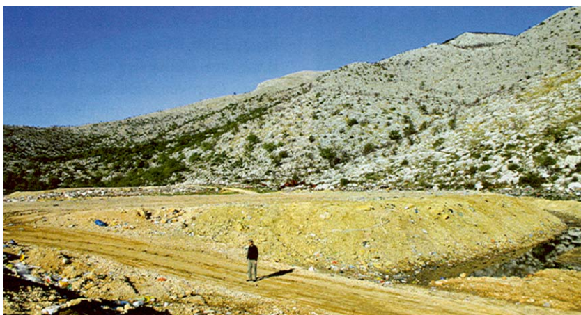
Odlagalište otpada Donja gora na Biokovu

Prema legendi Hrvati su uz poklike "more! More!", prvi put ugledali Jadransko more na prijevoju Dubci, na visini od 288 metara, na mjestu gdje se Biokovo (1762 m) odvaja od masiva Dovnja (864 m). Osim mora vidjeli su i veliki izvor vode koji se danas zove Breljanska vrulja. Vjerojatno nisu već onda organizirano ostavljali svoj otpad (imali su ga manje i razbacivali posvuda u skladu s ondašnjim i mjestimice sadašnjim civilizacijskim dostignućima) na istom mjestu gdje se danas nalazi donedavno "divlje odlagalište" Donja gora u neposrednoj blizini Brela. Tamo ovodobni Breljani, zajedno sa stanovnicima Baške Vode, Makarske, Tučepa i Podgore odlažu svoj svekoliki komunalni otpad. Breljanska je vrulja smještena ispod odlagališta, a udaljena je petstotinjak metara zračne linije, baš onoliko koliko je razdaljina od Podgore, i sadašnje i stare, u kojoj su već spomenuti stari Hrvati nakon što su začuđeno gledali u more, zadržali još "neko vrijeme". Praktički sve do izgradnje tzv. Jadranske magistrale i turizma koji danas omogućuje da se ljeti više nego učetvorostručuje broj stanovnika, ali i isto toliko puta povećavaju količine svakovrsnoga komunalnog otpada.