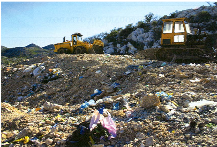
Zatrpavanje zemljom na odlagalištu Donja gora

se više ne upotrebljuje) ili da se sav otpad odveze s Donje gore na neko drugo odlagalište, primjereno obradi i odloži. Javna je rasprava pokazala da stanovnici ovog područja podržavaju varijantu koja uključuje sanaciju i prestanak odlaganja otpada. Kako se otpad ipak mora negdje "spremati", barem do izgradnje predviđenoga regionalnog središta u Lečevici, u međuvremenu bi se trebao odvoziti na odlagališta u Pločama i Vrgorcu. Program je sanacije ušao u fazu legalizacije, što znači da se za njegovu izvedbu mogu očekivati namjenska sredstva iz Ministarstva