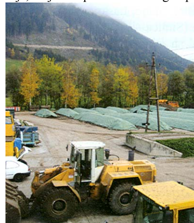
Primjer za kompostiranje organskog otpada u Austriji

Od Donje gore i svih legalnih i ilegalnih odlagališta "rasijanih" diljem Lijepe naše, preko Zagreba, do Austrije, valja se opet vratiti natrag. Opet