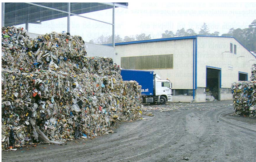
Dovoženje otpada u balama u pogon tvrtke ASA u Halbenrain blizu Graza

Poznavatelji stanja vezanog uz odlaganje komunalnog otpada tvrde da je Austriji zemlja u kojoj se u tome najdalje otišlo. To je uostalom prva zemlja u svijetu koja je donijela zakon što nalaže da se otpad prije odlaganja mora obraditi pa stoga zaista može poslužiti kao uzor i drugim zemljama. Stoga ne čudi da su predstavnici nekoliko ekoloških udruga i novinari s područja Splitsko-dalma-