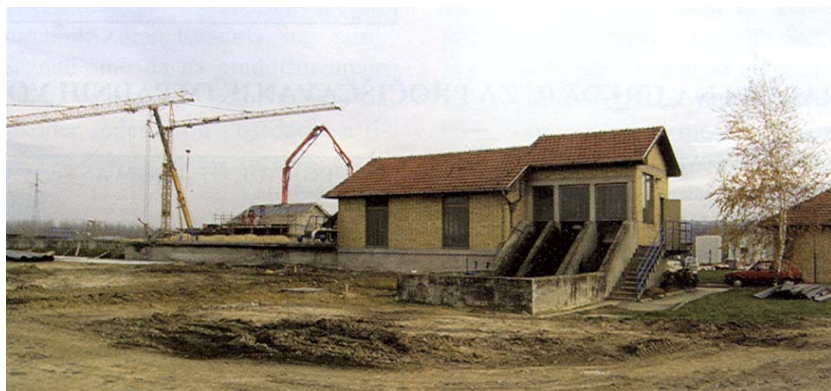
Zgrada uređaja izgrađena u I. fazi

U Belom Manastiru danas postoji razvijena tekstilna industrija, mlinarsko-pekarska i industrija mliječnih proizvoda, a ne radi nekad najveći industrijski pogon Šećerana . Grad nije samo baranjsko gospodarsko i kulturno središte, u njemu je ujedno i najrazvijenija infrastruktura. O vodoopskrbi Baranje brinu se vodoopskrbna poduzeća iz Belog Manastira i Darde, s tim što se Baranjski vodo-