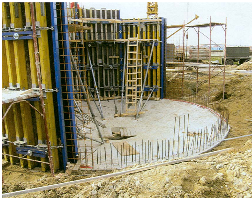
Postavljanje armature objekta za zgušnjavanje mulja

Osnovna je značajka postupka s aktivnim muljem i istodobnom aerobnom stabilizacijom u tome što je aktivni mulj nisko opterećen. Prednost mu je u visokim učincima čišćenja, velikom rasponu mogućih opterećenja, visokoj pogonskoj sigurnosti i jednostavnoj stabilizaciji mulja. Praktički su jedine potrebne građevine rešetka ili sita te pjeskolov-mastolov, koje već postoje u mehaničkom uređaju, a nije potrebna ni primarna taložnica. Odgovarajućim dimenzioniranjem i oblikovanjem moguće je svladati povremena vršna opterećenja, bez bitnih utjecaja na stupanj pročišćavanja. Stoga se ovaj postupak