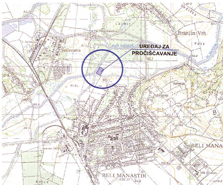
Lokacija uređaja za pročišćavanje otpadnih voda

Glavno je administrativno i industrijsko središte Baranje grad Beli Manastir koji je 1991. imao 13.108