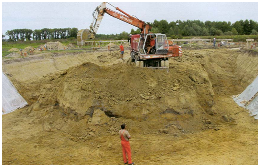
Iskop za građevine II. faze

Kanal Karašica (neki ga zovu Crna Karašica odnosno Crni kanal) u koji se ispuštaju vode iz uređaja za pročišćavanje prolazi sjeverno od grada, zapravo dijeli Beli Manastir od naselja zvanog Šećerana. Kanal je dug 31 km i u Karašicu se ulijeva preko crpne stanice Draž. Baranjska Karašica je inače rječica ili potok, desni pritek Dunava, zapravo najznačajni-