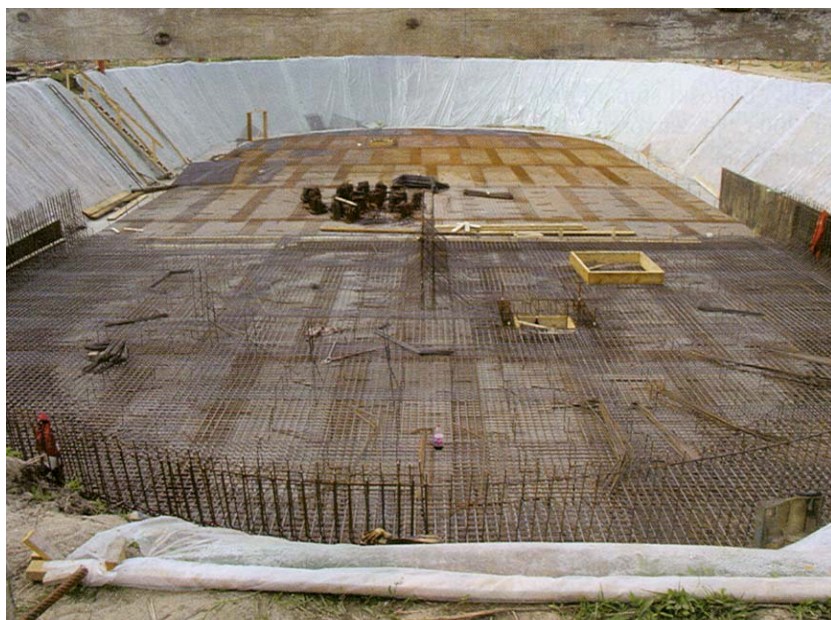
Radovi na bioacracijskom spremniku

U Baranjskom smo vodovodu saznali da su zbog toga odlučili započeti s gradnjom II. stupnja pročišćavanja, što znači primijeniti biološke i slične postupke čišćenja. Ne bez ponosa