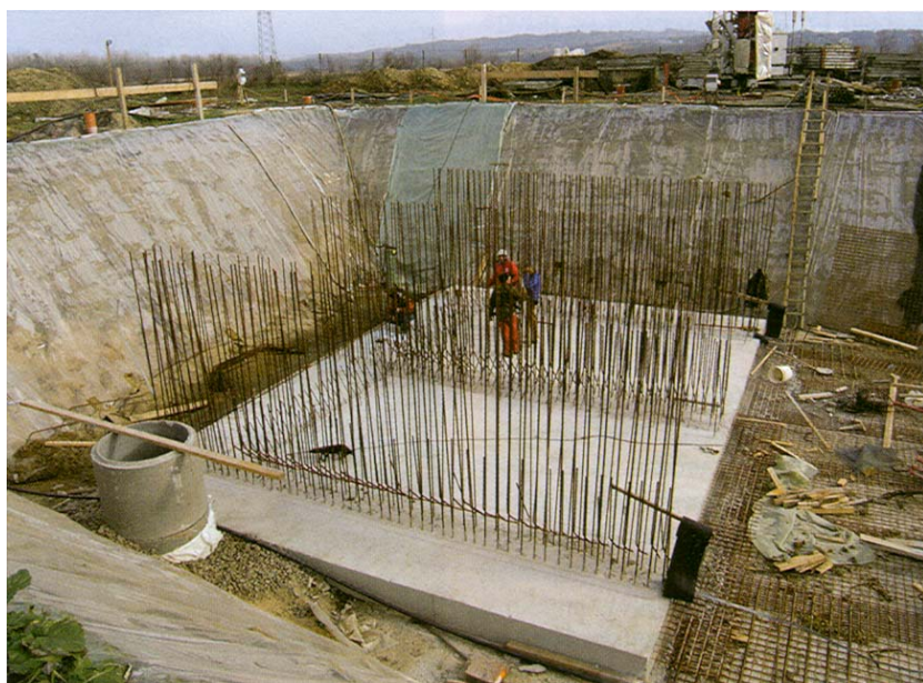
Početak gradnje naknadnog taložnika

Kanalizacijski se sustav u međuvremenu, zbog svih poznatih događaja, nije razvijao tempom kako je to bilo planirano. Stanovništvo je s industri-