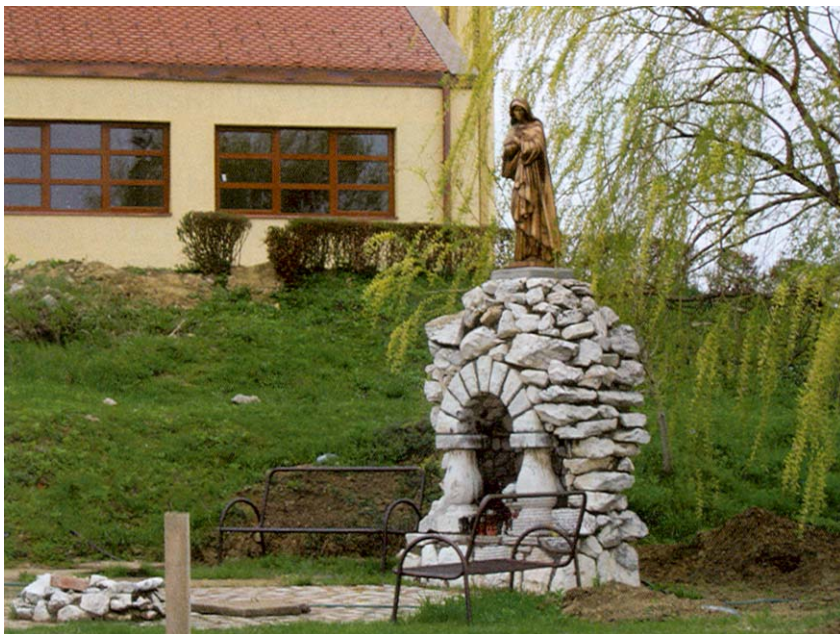
Kapelica s kipom Gospe