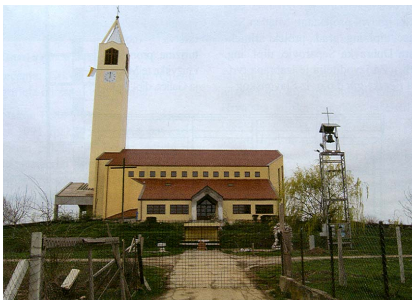
Istočno pročelje nove crkve