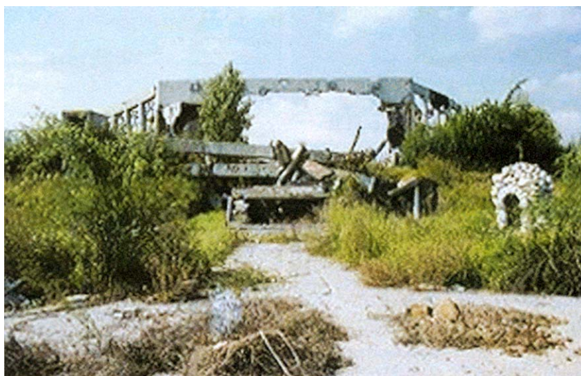
Ostaci u ratu srušene crkve

Vratio se u svoju župu 1997., odmah nakon početka mirne reintegracije. U čeprkanju po ruševinama crkve pronašao je neoštećeni kip Majke Božje Fatimske i to mu je bio znamen da će i crkva i župa jednoga dana dočekati bolje dane. Stoga ju je i nazvao "Gospa koja je odlučila ostat" pa će je uskoro u svečanoj proce-