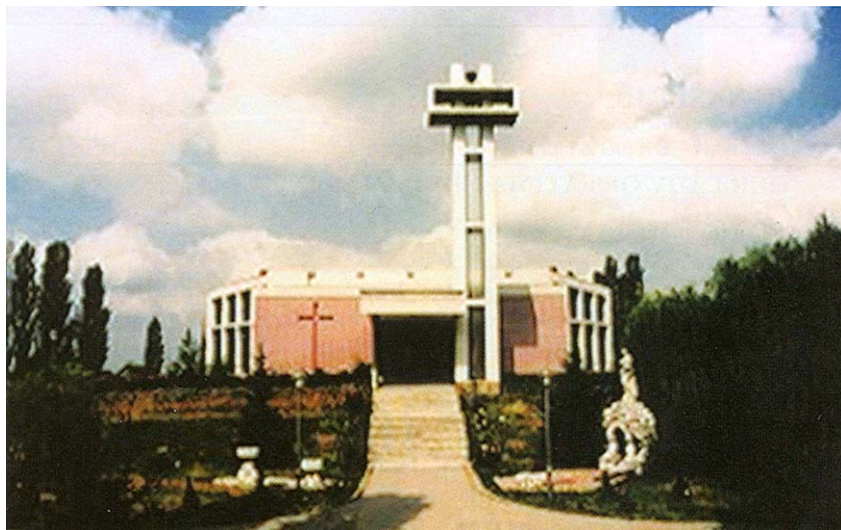
Pročelje prijeratne crkve

na. Stoga se može reći da je crkva sa samostanom Gospe Fatimske u Borovu završena tek 1988. Projektant je bio vukovarski arhitekt Ivan Mikić, dipl. ing. arh. Okoliš crkve bio je hortikulturno uređen, a poseban je dojam cijelom prostoru davao drvo-red jablanova.