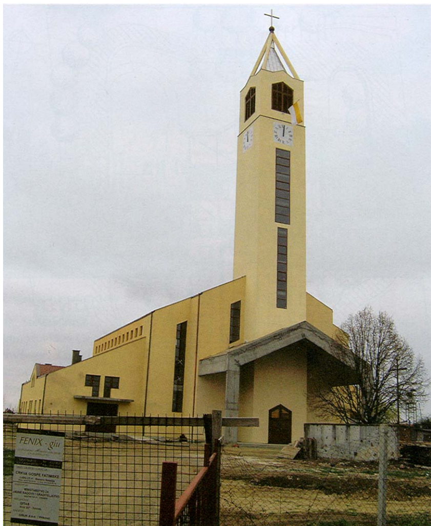
Južno pročelje nove crkve

tem na sjeveru te ulaznim vjetrobranom na jugu. Glavni je ulaz kroz zvonik na južnoj strani, a pomoćni na istoku, dok samostanski dio sa župnim uredom na zapadu ima poseban ulaz.