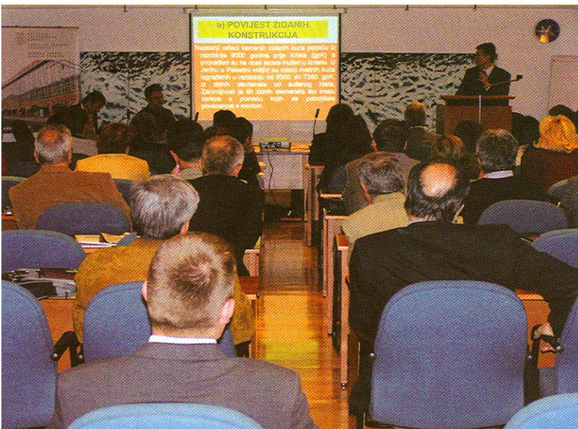
Predavanja u HGK-u o opeci kao osnovnom građevinskom proizvodu