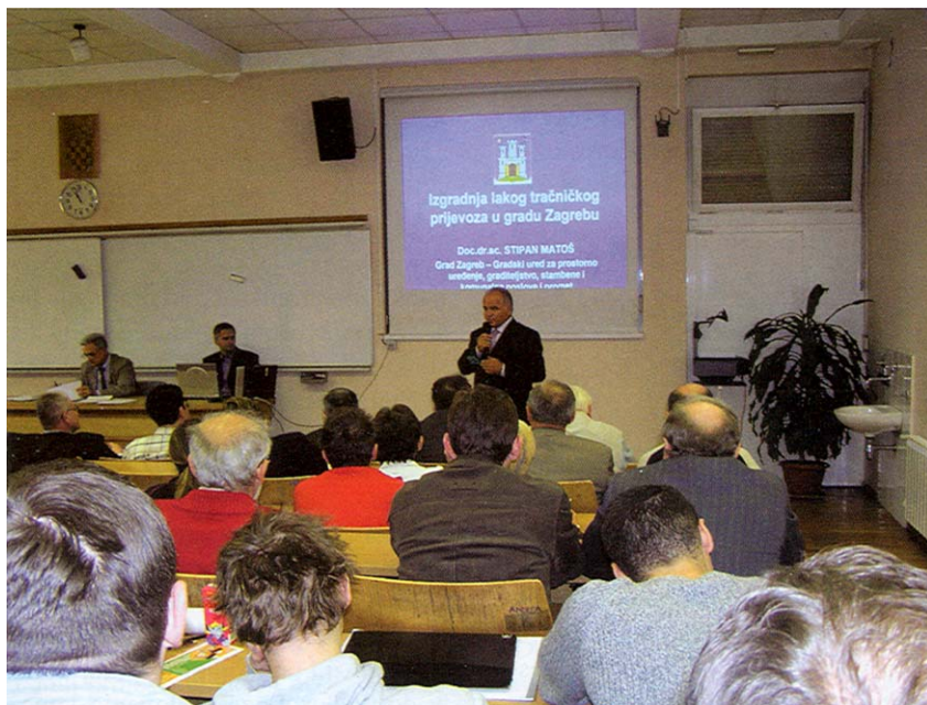
Tribina o rješenjima javnog prometa u Zagrebu pobudila je veliki interes stručnjaka, studenata i građana Zagreba

Valja posebno istaknuti i zaštitu jadranskog područja. Upravo je završena analiza kakvoće jadranskih plaža koje se ističu kvalitetom i očuvanošću mora. Upozoreno je da nebriga za okoliš može imati neželjene posljedice i da je na nekim lokacijama prijeko potrebna posebna zaštita. Uskoro će Ministarstvo zaštite okoliša, prostornog uređenja i graditeljstva