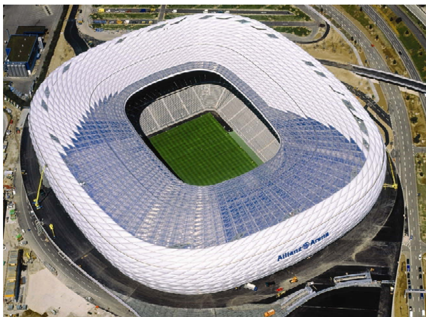
Pogled na stadion iz zraka

zajednički su 1978. utemeljili projektantsku tvrtku i u 27 godina zajedničkog rada izradili više od 180 projekata. Od toga otprilike 130 u Baselu, a ostalo širom svijeta – u Europi, Aziji i Americi. Uostalom trenutno im se izvode raznorazni projekti širom svijeta, a to je, kako tvrdi Herzog, značajno iznad njihovih mogućnosti. Uostalom u Pekingu se upravo gradi još jedan njihov nogometni stadion, nazvan Ptičje gnijezdo , na kojem će se održati ceremonija otvaranja Olimpijskih igara 2008. Projektirali su raznovrsne građevine od stambenih blokova, rezidencija, knji-