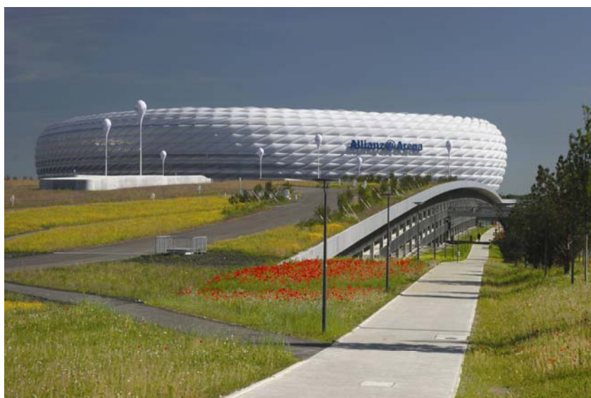
Svakodnevni izgled stadiona

Prema broju gledatelja koje može primiti na jednoj utakmici, Allianz