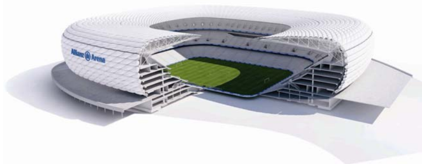
Maketa stadiona s presjekom

ja se mijenja u plavu. Štoviše kad bude nastupala državna reprezentacija, stadion će biti u bijeloj boji, boji