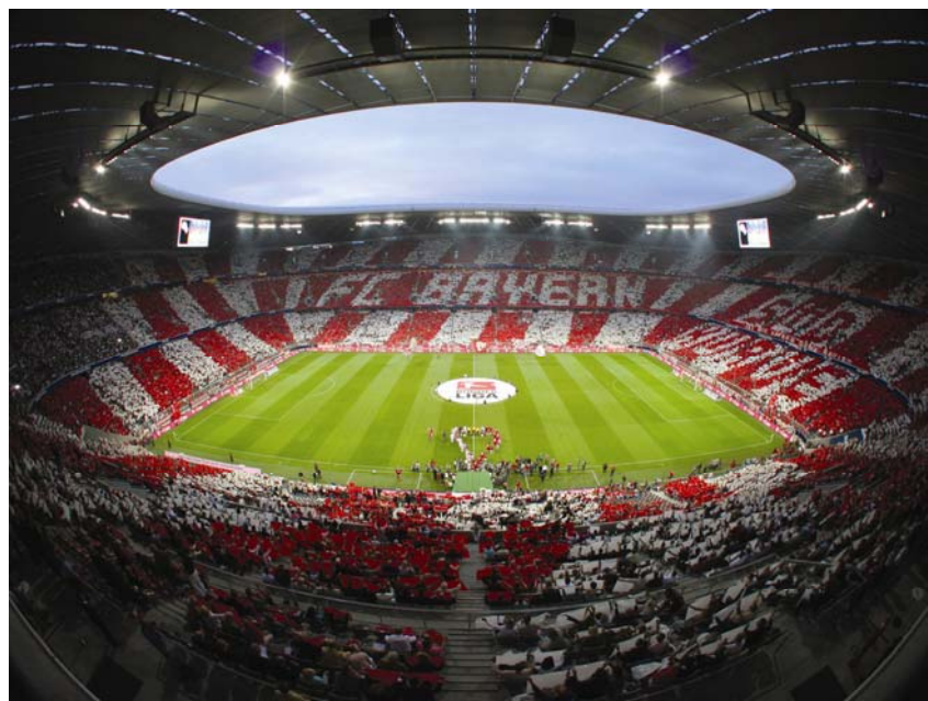
Ispunjeno gledalište uoči početka jedne utakmice

višoj 20.000. Pritom i nagibi među razinama variraju i kreću se od otprilike 24° na prvoj i najnižoj razini, preko približno 30° na drugoj do 34° na trećoj. Sva su sjedala posebno oblikovana i potpuno jednaka, neovisno o tome radi li se o onima za redovite i posebne posjetitelje, što inače na drugim stadionima nije slučaj. Istog su izgleda i sa srebrnim premazom zbog kojih reflektiraju različite boje, ovisno o kutu prema izvoru svjetlosti. Svako je individualno mjesto prije ugradnje moralo biti