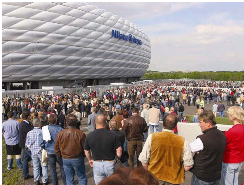
Stadion uoči svečanog otvaranja

Natječajno je povjerenstvo 8. veljače 2002. donijelo odluku da se prihvati rješenje tvrtke Alpine Bau Deut-