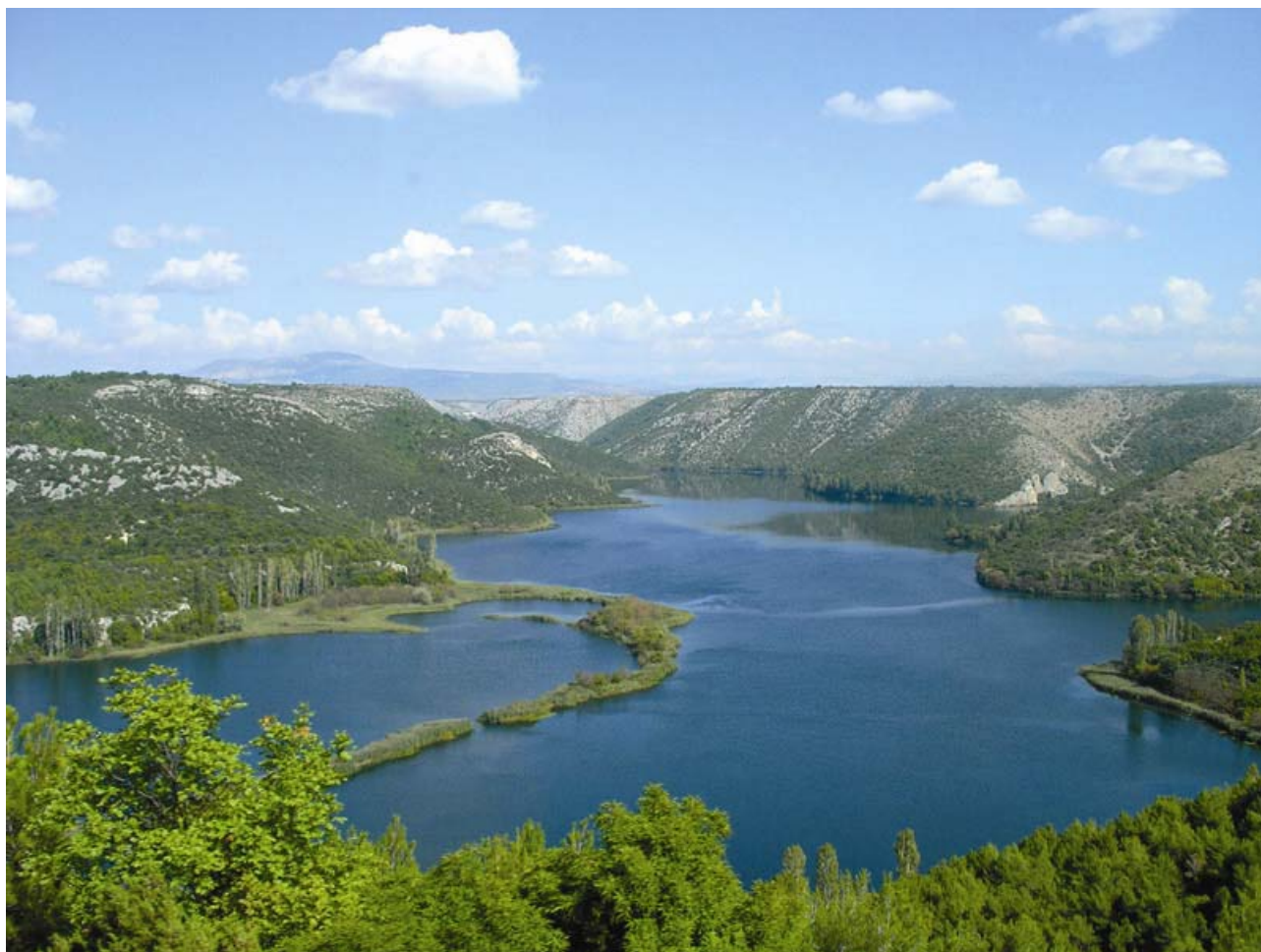
Pogled na Visovačko jezero

djelatnosti na stanje površinskih i podzemnih voda. Utvrđene su potrebe za vodom i načini njihovih podmirivanja kao i zaštita od štetnog djelovanja voda. Izrađeni su planovi motrenja kakvoće i količine voda, određeni ciljevi zaštite okoliša za površinske i podzemne vode te za zaštićena područja i procijenjen rizik ispunjavanja tih ciljeva. Predložen je i program mjera nužnih za ostvarivanje traženih ciljeva zaštite okoliša te registar svih detaljnih programa i planova upravljanja vodnim područjem.