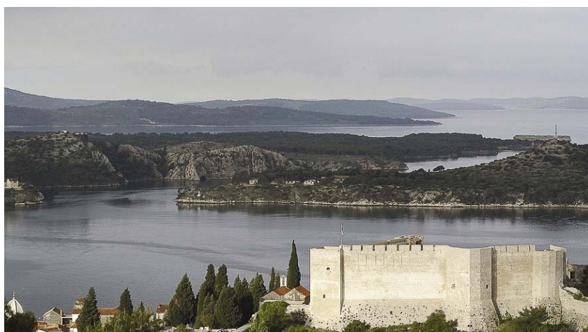
Ušće rijeke Krke u Šibeniku i pogled na kanal Sv. Ante

i podzemne vode te zaštićena područja u cijelosti su preuzeti iz članka 4. Okvirne direktive o vodama te obuhvaćaju sprječavanje pogoršavanja stanja površinskih voda, postizanje najmanje dobrog ekološkoga i kemijskog stanja ili dobrog ekološkog potencijala površinskih voda, smanjivanje zagađivanja osnovnim tvarima, prestanak ili postupno isključivanje emisije opasnih tvari te sprječavanje ili ograničavanje unošenja zagađivača u podzemne vode. Uključeno je i sprječavanje pogoršavanja stanja podzemnih voda, postizanje dobrog kemijskoga i količinskog stanja podzemnih voda, mijenjanje značajnih i ustrajnih trendova povećavanja koncentracija zagađenja u podzemnim vodama te postizanje suglasnosti sa svim standardima i ciljevima zaštite okoliša propisanim regulativom Europske unije za zaštićena područja. U obzir su uzeti i ciljevi navedeni u Državnom planu za zaštitu voda (NN 8/99), koji su uglavnom usklađeni s ciljevima Okvirne direktive jer govore o potrebi