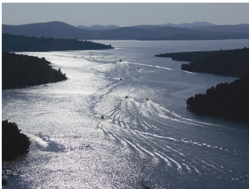
Pogled na Krku sa Šibenskog mosta

ka. U trećem su koraku prepoznati i utvrđeni svi značajni pritisci u slivu. Ciljevi zaštite okoliša za površinske