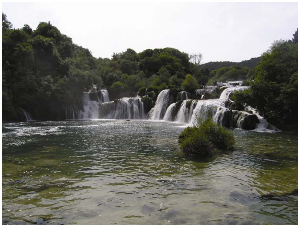
Najveći vodopad Skradinskog buka

nožju planine Dinare, 3,5 km sjeveroistočno od Knina (podno zimi bučnoga, a ljeti bezvodnoga Topoljskog slapa koji se još naziva Veliki buk ili Krčića slap), a utječe u Jadransko more pokraj Šibenika. Duljina je slatkovodnog vodotoka 49 km, a boćatoga 23,5 km, pa je s potopljenim dijelom ušća rijeka ukupno duga 72,5 km. Značajni su joj pritoci Krčić, Kosovčica, Orašnica, Butišnica i Čikola s Vrbom. Ima sedam sedrenih slapova s ukupnim padom od 242 m i po tome je prirodni i krški fenomen.