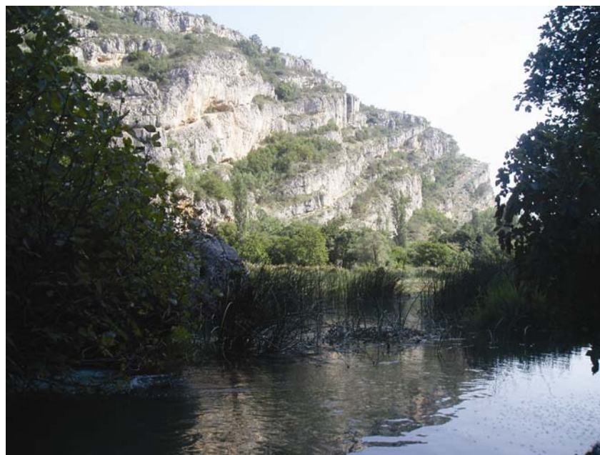
Rijeka Krka kod Roškog slapa

oznake), opći profil područja s trenutnim stanjem i očekivanim razvojem, vodne usluge kao javne vodoopskrbe i opskrbe vodom iz vlastitih izvora, navodnjavanje te prikupljanje i pročišćavanje otpadnih voda, a uključena su i uređivanja vodotoka i obrana od poplava i zaštićena pod-