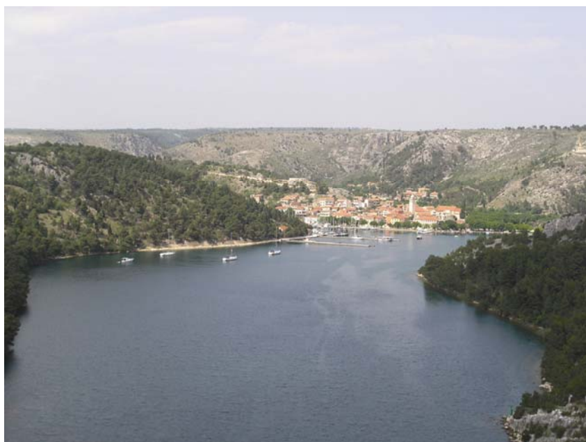
Pogled s mosta Krka na Skradin

Rijeka Krka, koja je iskorištena za izradu probnoga plana upravljanja njezinim slivom, po duljini je inače 22. rijeka u Hrvatskoj. Izvire u pod-