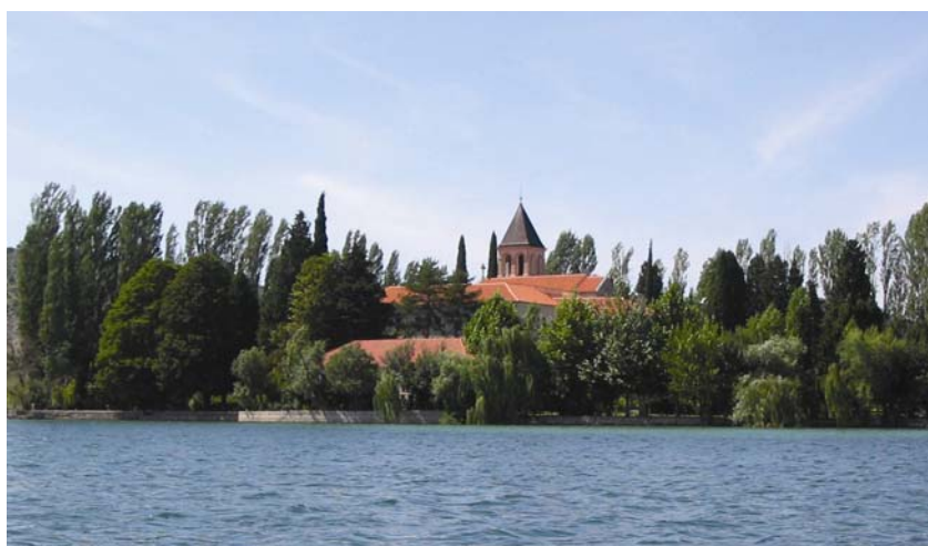
Otočić Visovac s franjevačkim samostanom

za hidrogeologiju i inženjersku geologiju Hrvatskoga geološkog instituta iz Zagreba odredio je cjeline podzemnih voda te njihovu karakteriza-