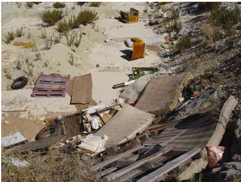
Jedno divlje odlagalište na opatijskom području

U pripremama za zatvaranje i sanaciju regionalnog odlagališta, grad Opatija i općine Matulji, Lovran i Mošćenička Draga te opatijsko poduzeće Komunalac ugovorili su 1. kolovoza 2007. sporazum o sufinanciranju sanacije odlagališta komunalnog otpada Osojnica u općini Matulji. Komunalac i općina Matulji ugovorili su također financiranje studije utjecaja na okoliš i projektnu dokumentaciju za tu sanaciju od listopada 2006. godine. Ugovorna obveza obuhvaća izradu studije utjecaja na okoliš, istražne radove, plan sanacije, idejno rješenje s lokacijskom dozvolom, glavne i izvedbene projekte te ishođenje građevne dozvole za sve radove. Ugovorena je vrijednost radova 863 tisuće kuna, rekao nam je direktor Komunalca Ervino Mrak, dipl.