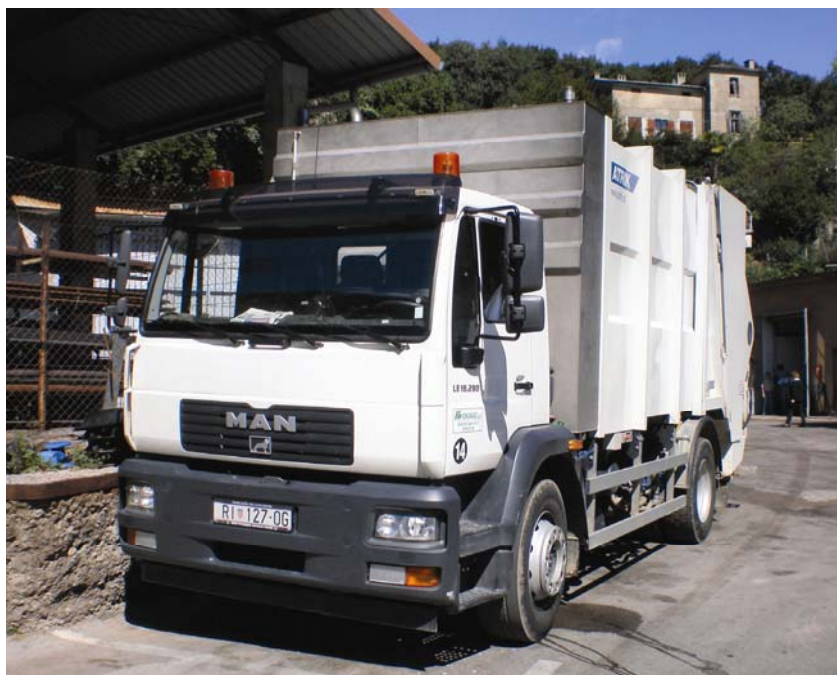
Kamion za odvoz rasutog otpada

Inače je organiziranim skupljanjem i odvoženjem otpada obuhvaćeno je 94 posto stanovnika županije. Na godinu se na tom području prikupi gotovo 513.000 m 3 komunalnog otpada. Najveći se dio te količine (200.000 m 3 – gotovo 40 posto) odloži na odlagalište Viševac u općini Viškovo, dio (140.000 m 3 – 27 posto) na odlagalište Treskavac na otoku Krku, a preostalih 33 posto na sva ostala odlagališta. Specifičan je problem na otocima Susak i Ilovik odakle se otpad posebnim ekološkim brodicama prevozi u Mali Lošinj, a otpad nastao na Unijama odlaže se na lokalnom odlagalištu. Jedan je od najvažnijih problema popunjenost kapaciteta postojećih odlagališta, posebno onih na kojima se odlaže otpad s područja Rijeke i prigradskih općina (Viševac), s otoka Krka (Treskavac) i Malog Lošinja (Kalvarija).