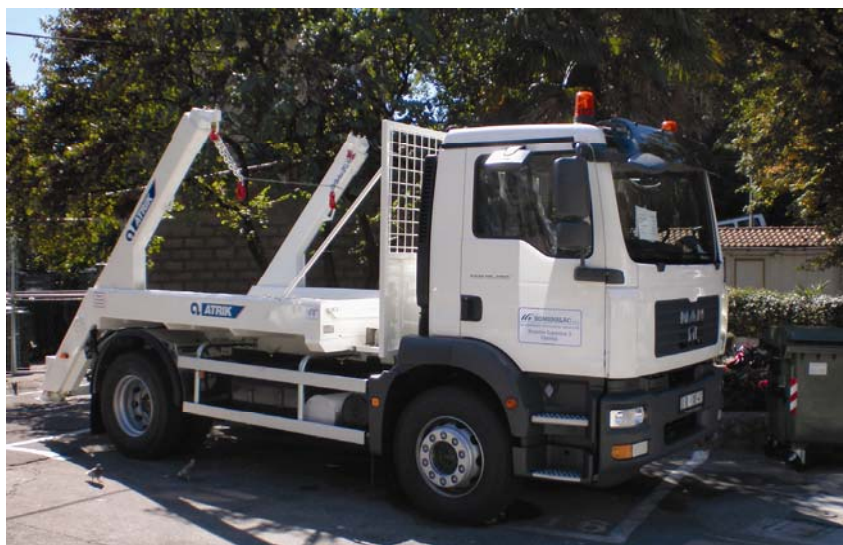
Kamion za odvoz kontejnera za otpad

Nakon stupanja na snagu propisa koji reguliraju postupak s otpadom, stanje se bitno popravilo. Uspostavljena je kontrola i evidencija otpada, odlagališta su uglavnom ograđena, otpad se prekriva inertnim materijalom, regulira se otplinjavanje, izgrađeni su protupožarni pojasi i minimum prateće infrastrukture. Na 7 od 10 postojećih odlagališta ispunjen je minimum propisanih uvjeta. Uz navedena, legalna odlagališta, popisom