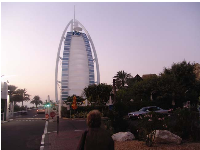
Hotel Burj Al Arab u Dubaiju

Između 20. i 25. studenoga 2007. skupina od 25 osoba je na poticaj Predsjedništva Društva građevinskih inženjera Zagreba (DGIZ) otputovala u Dubai, u aranžmanu turističke agencije Kompas .