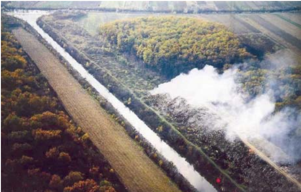
Sanacija jednog divljeg odlagališta u Vukovarsko-srijemskoj županiji

Zakonom o otpadu uređeni su odnosi u postupanju otpadom, a za komunalni su otpad određeni osnovni načini postupanja s otpadom i utvrđeni skupljači i obrađivači otpada. Zakon o komunalnom gospodarstvu odredio je i načine izvršavanja takvih postupaka. Tako je, između ostalog, predviđena javna ustanova kao ravnopravni oblik obavljanja komunalnih djelatnosti i kao neprofitna organizacija koja će primjenom tržišnih načela osiguravati gospodarenje otpadom na