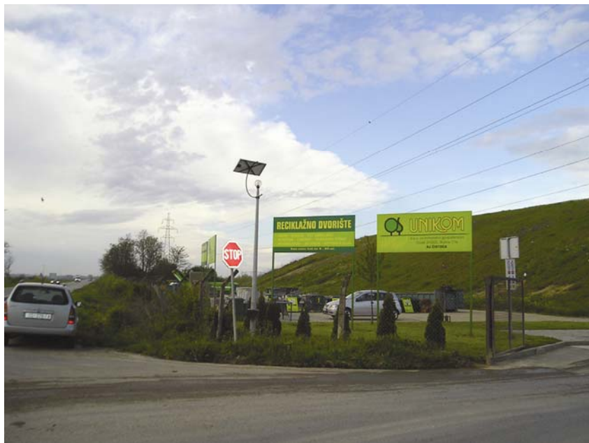
Reciklažno dvorište u Osijeku

laganja otpada, u predstojećem razdoblju treba postupno smanjivati udjel biorazgradivog otpada koji se odlaže na odlagalištu, a na odlagališta koja se nalaze u sustavu centra za gospodarenje otpadom dopušta se odlaganje samo obrađenog otpada.