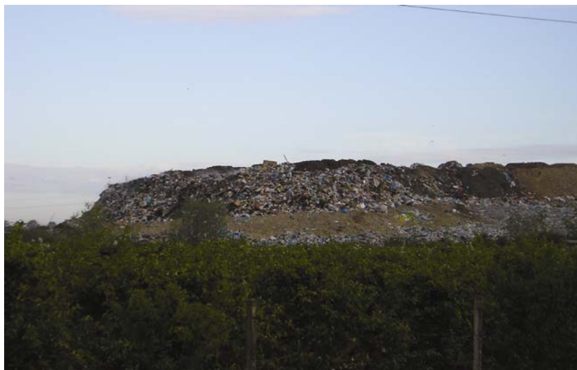
Jedno odlagalište u Osječko-baranjskoj županiji pred sanacijom

Odgovor na tu primjedbu zahtijeva posebno obrazloženje. Projekt je nastao prije donošenja Strategije gospodarenja otpadom i zamišljen je raz-