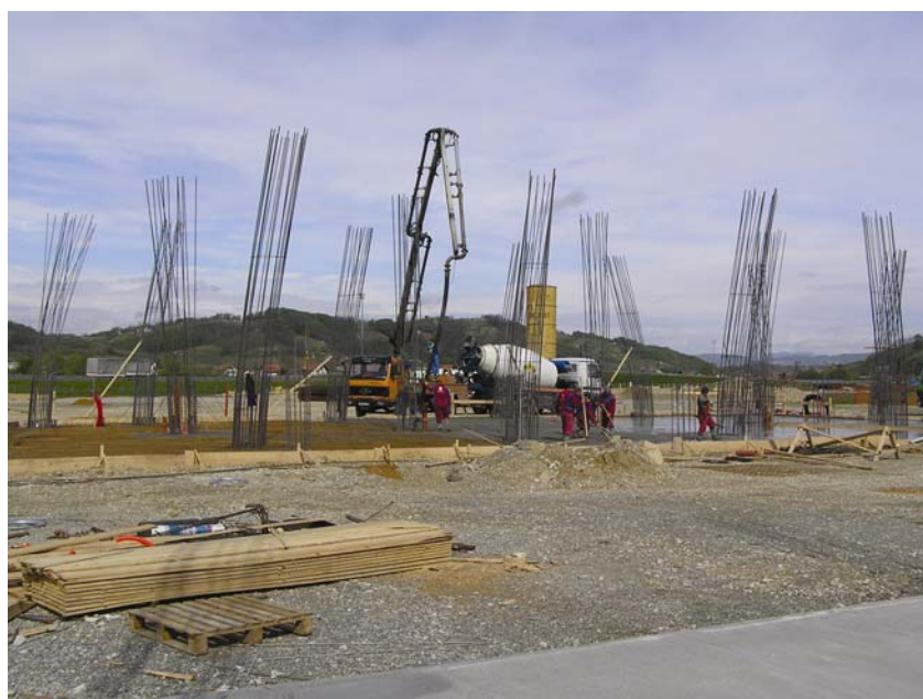
Pogled na gradilište

nog presjeka (50 cm i 90/50 cm), a montiraju se u posebne armiranobetonske temeljne čaše i potom zalijevaju sitnozrnatim betonom.