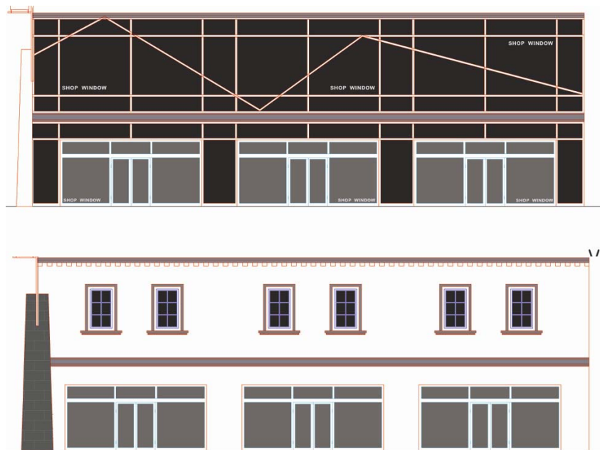
Planirana promjena pročelja nakon nekoliko godina

Pročelja se stalno lome te se tako izbjegavaju duge i jednolične plohe, čime se htjelo stvoriti razvedenu strukturu za unutrašnji i vanjski prostor. Na taj se način izbjegava izgled, primjerice, mastodontskoga shopping malla. Izmjene zatvorenih i otvorenih prostora, sklopovi gradskih ulica i zasebnih dućana zajedno tvore jedinstvenu cjelinu, a staklenim se poluzatvorenim pasażima prostor prilagođava čovjeku. Oblikovanje je pročelja zamišljeno kao scenografija koja će se nakon nekoliko godina moći promijeniti.