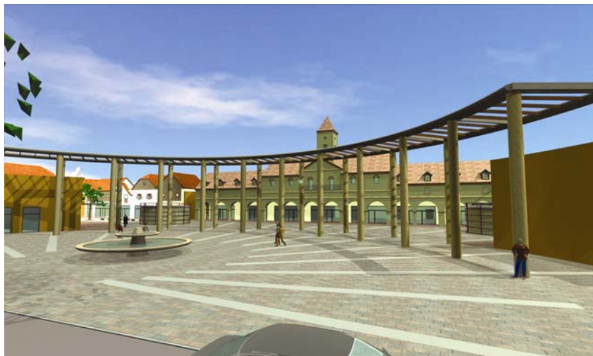
Prostorni model budućega outlet centra u Sv. Križu Začretju

gi u Svetom Križu Začretju na autocesti Zagreb – Macelj.