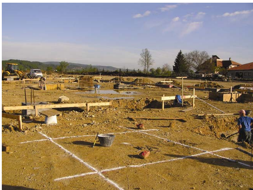
Početak zemljanih radova

onskih panel-ploča izvodit će se sa slojevima toplinske izolacije i hidroizolacije. Vanjska se stolarija sastoji od aluminijske bravarije i ostakljena je izolacijskim staklom. Pregradni zidovi između prostorija bit će gips-kartonski s ispunom od mineralne vune. Podovi su plivajući i toplinski izolirani, a završna je obrada cementni estrih. Podovi 1. kata su plivajući, a za pod trijema predviđena je keramika na podložnom betonu.