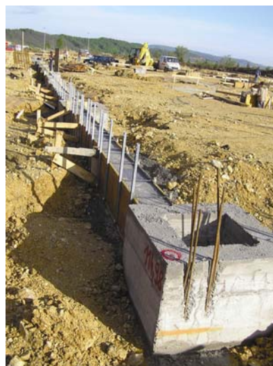
Betonirani dio temelja

ca i servisni prostor. U građevini B su predviđeni trgovačko-skladišni prostori, sanitarije, restoran, paviljon s caffe barovima i uredi na katu, a u dijelovima građevina C i D koji će se izvoditi u prvoj fazi trgovačko-skladišni prostori te paviljon s caffe barovima . U svim je građevinama predviđena i posebna sprinkler stanica.