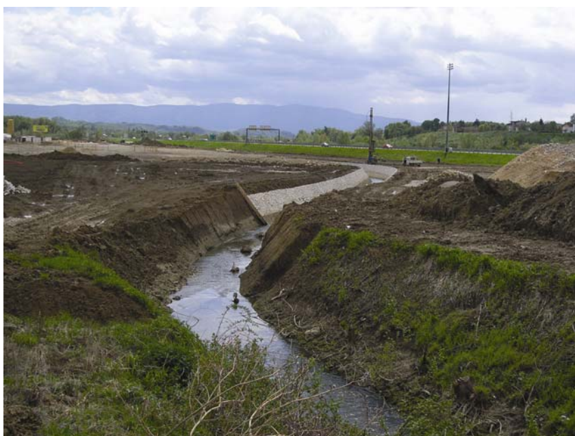
Radovi na koritu Šemnice

I ovdje se osnovni konstruktivni sustav sastoji od nosivih armirano-betonskih stupova i greda, temeljenih na temeljima samcima koji su povezani temeljnim gredama. Krovovi su jednokatnica razvedena kombinacija kosih dvostrešnih krovova pokrivenih crijepom ili limom u obliku i boji crijepa, s mjestimičnim ravnim krovovima ploham. U natkrivanju pješačkih prolaza rabe se staklene plohe. Vanjske će se i unutrašnje plohe podova popločiti betonskim i keramičkim elementima u pastelnim tonovima. Pročelja su kombinacija predgotovljenih betonskih panela, završno ožbukanih i obojenih, te zidanih pročelja od Ytong blokova i armiranog betona koji su završno ožbukani. Pročelja će se dodatno obraditi oblogama od drveta, fasadne opeke, žbuke i kamenih elemenata, kako bi se izgledom približili gradnji tradicionalnih zagorskih kuća i pridonijeli uklapanju cijelog kompleksa u okruženje. Glavna se pročelja pojavljuju duž unutrašnjih ulica trgovačkog centra, a dilatacije tvore središnji prostor s unutrašnjim otvorenim i poluzatvorenim pješačkim ulicama (koji će ujedno služiti i kao vatrogasne pristupne površine), a tu će se i odvijati osnovne trgovačke funkcije te biti glavni ulazi u lokale.