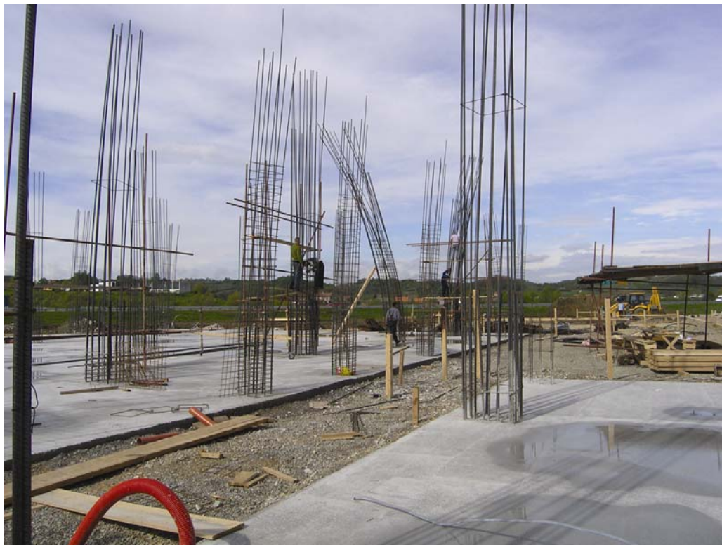
Armatura stupova i dijelovi izvedene podne ploče

kim markama. Gradnja je takvih suvremenih trgovačkih centara svakako potaknuta velikim razvitkom naše cestovne infrastrukture, a prostor oko Zagreba nije slučajno privlačan stranim investitorima jer su na tom uskom prostoru vrlo blizu i Slovenija i Mađarska te Bosna i Hercegovina. Ujedno to je gospodarski najrazvijeniji dio Hrvatske s najvećim prihodima i gospodarstva i stanovništva, a ne treba uostalom zanemariti ni gomile turista koji kroz taj prostor nahrupe prema našoj obali. Šteta je jedino što se vrijednosti tog prostora iskorištavaju isključivo u trgovačke svrhe, umjesto da se investicije okreću proizvodnim i gospodarskim projektima.