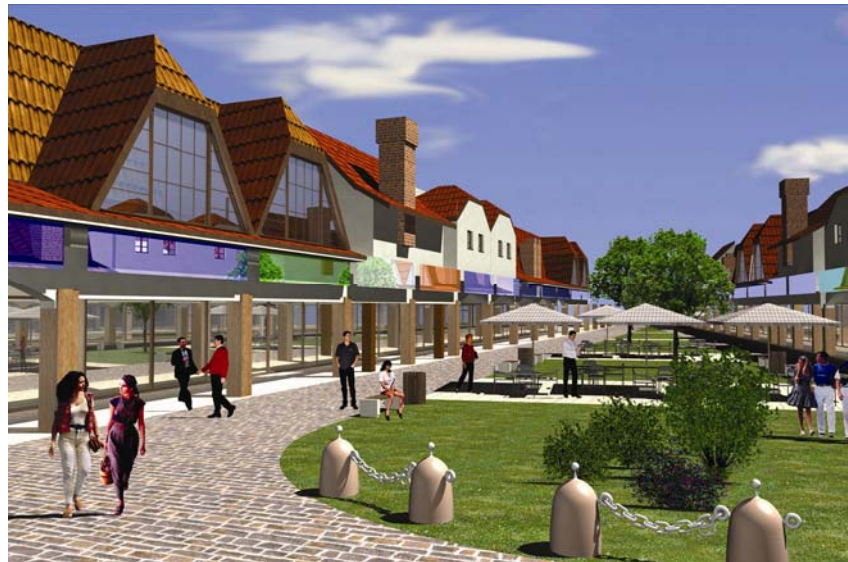
Prostorni model budućega outlet centra u Svetoj Heleni

tara jer su oni zapravo viša "trgovačka filozofija" u odnosu na velike trgovačke centre koji su nas jednostavno preplavili. Međutim znakovita je činjenica da se sada istodobno grade