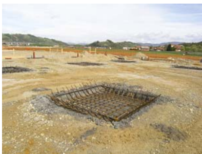
Dio armature temeljne čaše

Konstruktivni raspon glavnih nosača odnosno raster stupova je 7,8 m x 7,2 m. Međukatna je konstrukcija montažni strop od prednapetih II ploča, raspon im je 10 m, a visina 50 cm i na njih se postavlja tlačna ploča debljine 5 cm. Nad ulazima se izvode konzolne monolitne ploče debljine 10 cm koje su upete u tlačnu ploču i sidrima oslonjene na montažni pojas II ploče. Te se ploče se oslanjaju na stupove preko montažnih L i okrenutih T greda, a na dijelu otvorenog stubišta bit će armiranobetonska monolitna ploča debljine 25 cm. Montažni su armiranobetonski stupovi kružnoga i pravokut-