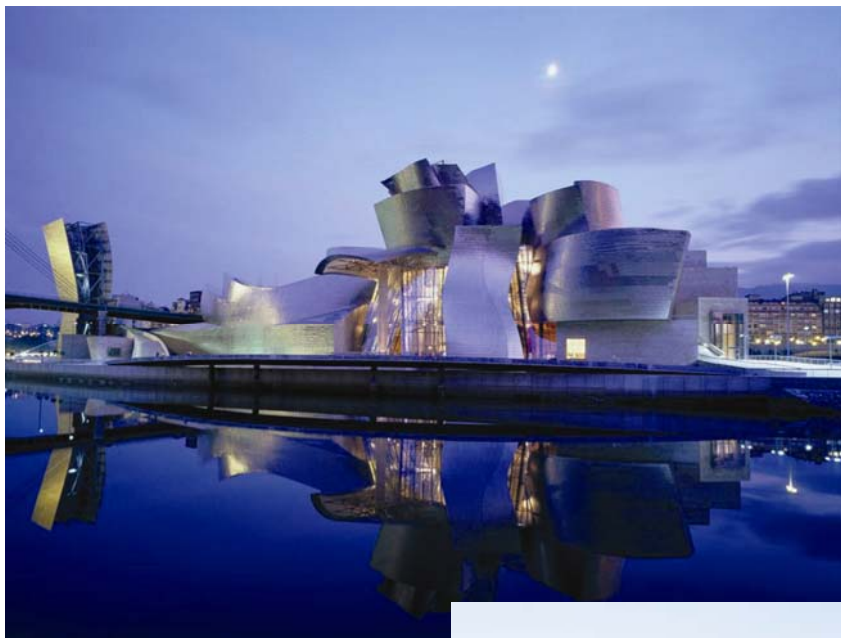
Pogled na impresivni Guggenheim muzej

Druga bečka građevina sanirana Prefa limenim pokrovom je Prirodo-