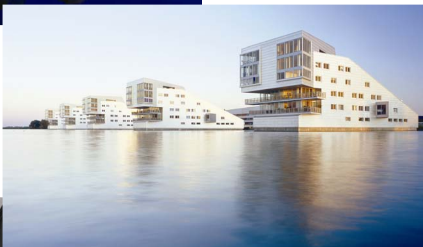
Sfinge u Huizenu izlaze iz mora

Lim se ne upotrebljava samo za novogradnje u suvremenom graditelj-