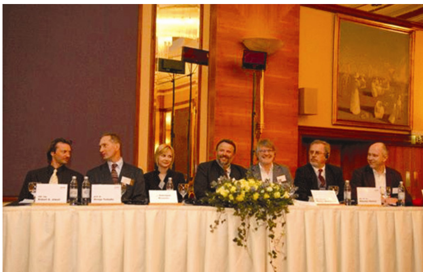
Predavači na kongresu o gradnji drvom

Drvo se posljednjih godina razvilo u visokotehnološki proizvod, a za to su zaslužna istraživanja u tehničko-konstruktorskom sektoru. Novi drveni materijali i moderne tehnike prerade zajedno s tradicijskim metodama