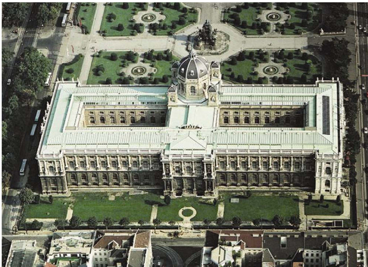
Pogled na novi krov Prirodoslovno – povijesnoga muzeja u Beču

Nakon seminara sudionici su obišli gradilište željezničkoga kolodvora u