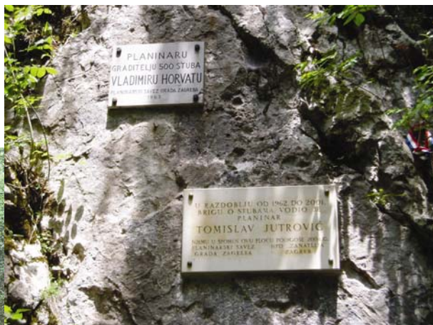
Spomen - ploča graditelju i pomagaču

tna, stube su još uvijek u funkciji, u dobrom stanju, a okoliš je uredan. Ipak, zbog Horvata i njegovih pomagača stube zaslužuju da ih se pro-