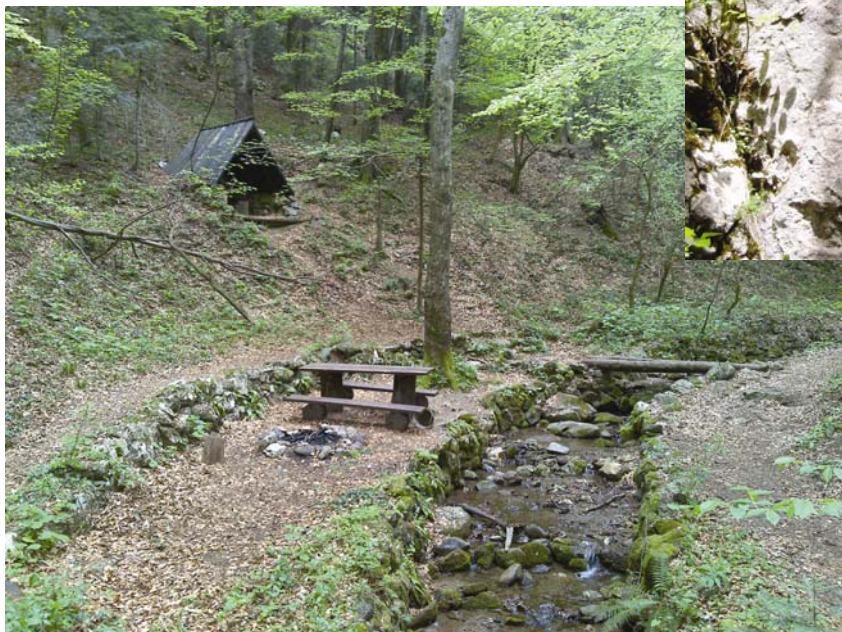
Pogled na izletišta Srnec

lje teče potok Bistri jarek pa je Horvat poduzeo izgradnju još 100 stuba od terase do potoka. Za ove stube mu je bilo potrebno 26 radnih dana. Konačno je 21. lipnja 1953. na špiljskoj terasi održana manja svečanost kojom su stube službeno otvorene za javnost. Tom su prilikom nazvane Horvatove stube , a danas ih zovemo 500 Horvatovih stuba .