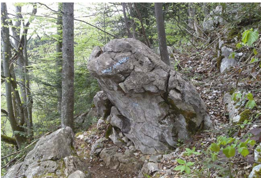
Nagnuta stijena Moj naklon