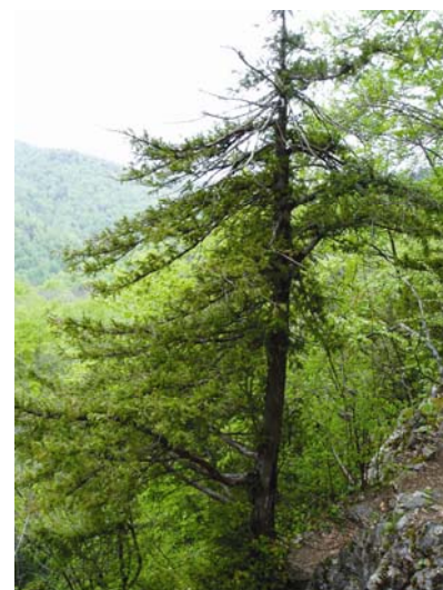
Tisa – Taxus baccata