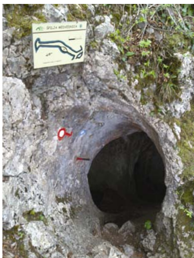
Ulaz u špilju Medvednicu

vu. S radom je želio početi već 1935., no tadašnji mu vlasnik to nije dozvolio jer se bojavao da će velik broj posjetitelja tjerati divljač s njegova lovišta. Zahvaljujući promjeni društvenih odnosa i nepostojanju institucija koje bi mu zabranile rad, u ljeto 1946. Horvat započinje s izgradnjom kamenog stubišta. Prvo je napravio jednostavne stube koje su služile kao trasa za izgradnju trajnijih stuba. Za ove privremene stube nije trebao puno kamena pa je iskoristio postojeće razlomljeno i uokolo razbacano kamenje. Svake je nedjelje, kao i za godišnjeg odmora, odlazio u planinu i boravio cijeli dan u potpunoj samoći radeći na izgradnji stuba. U svakakvim vremenskim uvjetima za 27 radnih dana (u razdoblju od 4 mjeseca) napravio je 430 kamenih stuba.