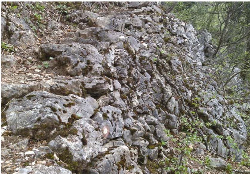
Kvalitetan podzid stuba

Sav materijal koji se izvlačio iz špilje Medvednice istresao se kroz donji otvor te se tu napravila manja terasa. Izgradnja terase je logično dovela do nove ideje. Vrlo blizu špi-