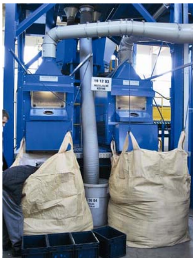
Slika 7. Uređaj koji odvaja frakcije veličine do 3 mm i veće

Magnetnim separatorima izdvaja se željezo, koje se ovako obrađeno plasira na tržište sekundarnih sirovina. Preostali materijal prenosi se sljedećom transportnom trakom na EDDY strujni odjeljivač u kojem se s pomoću brzo mijenjajućeg magnetskog polja odvajaju nemetali od plastike. Metali poput bakra, aluminija i mesinga idu dalje u mlin čekićar. Nakon toga materijal dolazi na sito koje odvaja frakcije veličine do 3 mm i veće. Tako odvojene frakcije padaju na zračni separator koji odvaja lakšu frakciju (aluminij) i težu frakciju (bakar i mesing) (slika 7.).