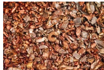
Slika 9. Frakcije metala za talionicu

Prošle je godine obrađeno oko 3.500 t otpada - od tih 3.500 t 12 t je bio ostali otpad, a 130 t opasni otpad. Ostali se otpad može odlagati na komunalna odlagališta, a opasni se otpad šalje u spalionice u Grazu i Beču. Cjelokupno je upravljanje linije za recikliranje automatizirano i obavlja se iz upravljačkog centra. Nazivna snaga postrojenja je 350 kW s kapacitetom od 4.000 kg/h. Kapacitet obaju pogona u jednoj smjeni je 12.000 t/god. U ovom trenutku to je daleko više nego što ima otpada. Cilj je ministarstva skupiti 4 kg/stan/-/god. Ako se to ostvari radit će se o 18.000 t/ god EE otpada. Prvu kategoriju EE otpada obrađuje tvrtka Cezar. Toj kategoriji pripadaju hladnjaci, štednjaci, perilice što čini otprilike 40 posto otpada. U pogonu u Donjoj Bistri ostaje 12. 000 t/god., što se može obraditi sa 60 zaposlenika u jednoj smjeni u godinu dana. Specifičnost je postrojenja što s malo utroška energije proizvodi vrlo vrijednu sirovinu. Dobivaju se frakcije metala koje su jako dobre za talionice (slika 9.).