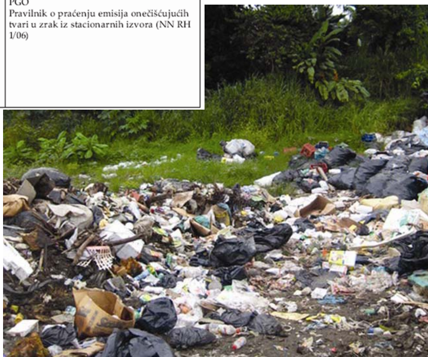
Jedno od divljih odlagalište

Pri uspostavi sustava gospodarenja otpadom valja se brinuti o tome kako osigurati ne samo sigurnu obradu i odlaganje otpada, već i sustav obrade stakleničkih plinova koji mora