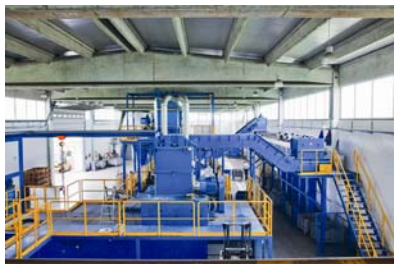
Slika 6. Pogon za usitnjenje

Ostatak materijala dolazi do četveroosovinskog usitnjivača koji usitnjava materijal na veličinu 28 mm (slika 6.).