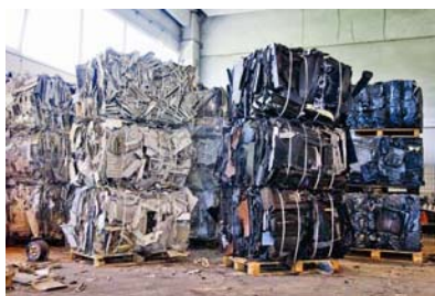
Slika 3. Sortirani EE uređaji

Rastavljeni i u bale sortirani EE uređaji odvoze se kamionima u pogon u Donjoj Bistri (slika 3.).