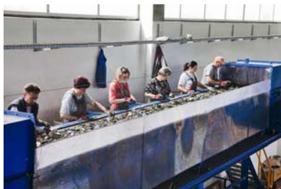
Slika 5. Ručno odvajanje preostalih opasnih komponenti

Usitnjeni se materijal magnetnim separatorom odvođa na dvije transportne trake, gdje se ručno odvajaju preostale opasne komponente od vrijednih komponenata (slika 5.).