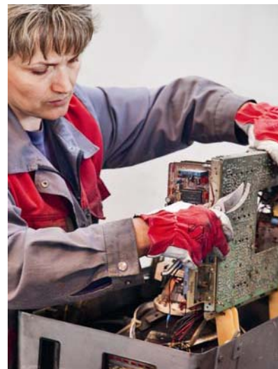
Slika 2. Ručno odvajanje vrijednih komponenta

Električni i elektronički (EE) otpad jedan je od najbrže rastućih vrsta otpada, kako tehnologija napreduje tako tehnički uređaji postaju sve jeftiniji i dostupniji, a njihov vijek trajanja sve kraći. Prema procjeni Ministarstva zaštite okoliša, prostornog uređenja i graditeljstva u Hrvatskoj svake godine nastaje oko 30.000 do 45.000 t EE otpada, odnosno 6,6 do 10 kg/stan/god. Sustav prijave i sakupljanja organiziran je preko besplatnog telefona ili preko internet-skih stranica ovlaštenih sakupljača (Flora VTC Virovitica, Spectra Media Zagreb, Cezar Zagreb, Metis Rijeka).