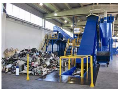
Slika 4. Dio pogona s transportnom trakom

Primarno obrađenim otpadom, koji stiže iz pogona u Virovitici, puni se transportna traka koja vodi materijal do prvog usitnjivača od 78 mm (slika 4.).