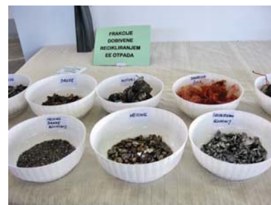
Slika 8. Frakcije dobivene recikliranjem EE otpada

sirovina koja se upotrebljava za izradu istih aparata koji se recikliraju (slika 8.).