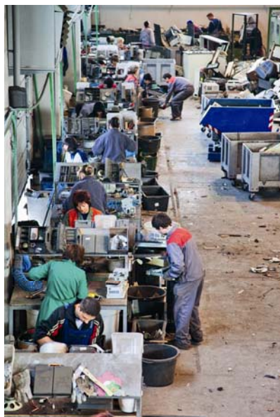
Slika 1. Primarna obrada EE otpada

U skladu s državnom koncesijom za obavljanje poslova obrade otpadnih električnih i elektroničkih uređaja i opreme za područje Republike Hrvat-