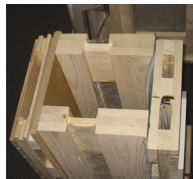
Model zidne konstrukcije s drvenim letvama

Vanjski zid koji odgovara standardu pasivne kuće zahtijeva popriličnu debljinu i time veći udio drva. Racionalizaciju pri njegovoj upotrebi pred-