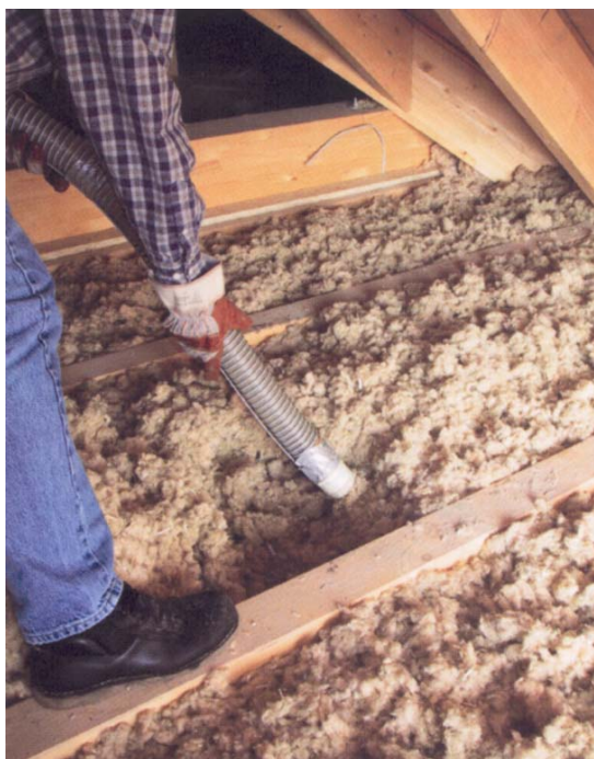
Postavljanje toplinske izolacije upuhivanjem

Za ugrađivanje toplinske izolacije pasivnih kuća rabe se slični načini kao kod uobičajenih građevina, iako su zbog debljeg sloja toplinske izolacije nekako pričvršćene. Pričvršćuju se lijepljenjem, sidrenjem, čavljanjem, vijcima, ugrađivanjem s pomoćnim letvicama ili upuhivanjem.