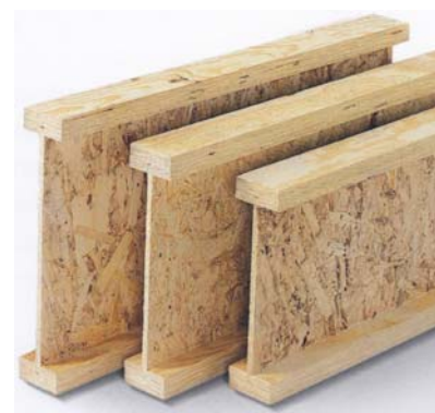
Drveni I nosači

Na unutarnjoj se strani zida ispred parne brane (koja je često i zrakonepropusna ravnina) izvodi tzv. instalacijski sloj koji je dodatni sloj toplinske izolacije na zidu. Drugi je način sastavljanja zida postavljanje stupova u dvije ravnine koje su izmahnute da drvena konstrukcija ne bi stvarala toplinski most.