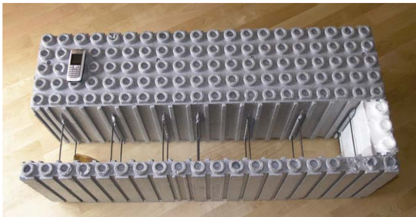
Blok od polistirena širine 100 cm

obloga pročelja koje se učvršćuju na nosivi zid posebnim sidrima. Ona zbog deblje toplinske izolacije moraju biti dulja, no na tržištu ih zasađa nema dovoljno. Osim toga, sidra su toplinski most u konstrukciji zida.