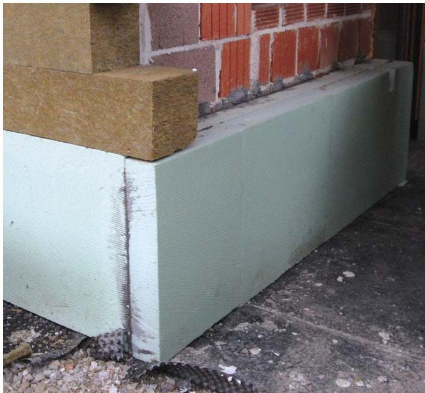
Masivni zid – opečni zid i vanjska toplinska izolacija od mineralne vune i ekstrudiranoga polistirena

Debljina masivnoga nosivog zida ovisi o statičkim zahtjevima. Obloga pročelja može biti, kao kod običnih kuća, ventilirana ili neventilirana. Problem može nastati kod debljih