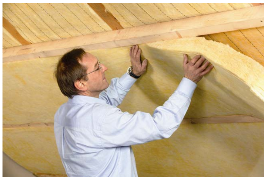
Montaža toplinske izolacije od staklene vune