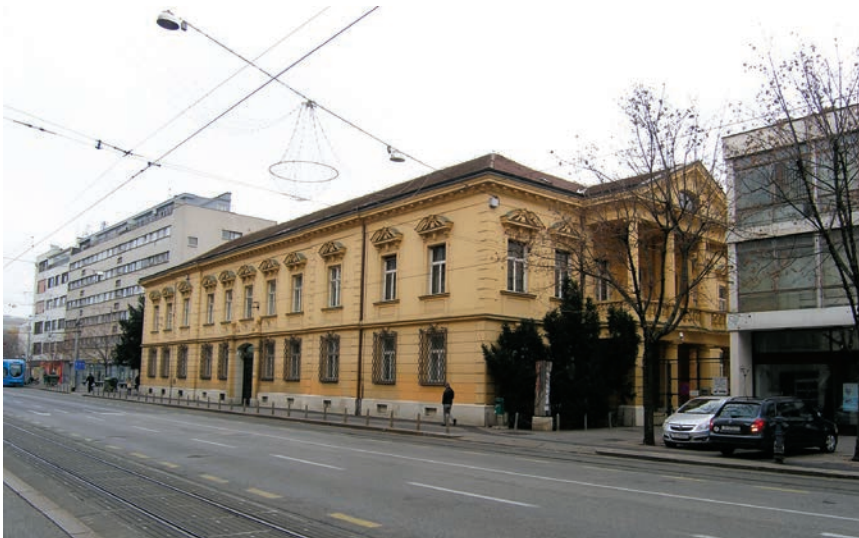
Upravna zgrada tvornica Arko i Badel

mogne poukom svima koji bi u tome poslu željeli napredovati, a "na temelju crpljene pouke iz svog pohoda" (po Francuskoj i Italiji) sastavio je knjigu o vinarstvu koja će (barem tako piše u Gospodarskom listu iz 1868.) "i manje vješta vinara u tom poslu valjano poučiti".