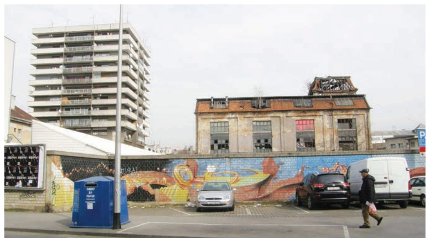
Pogled sa zapada na tvornički kompleks