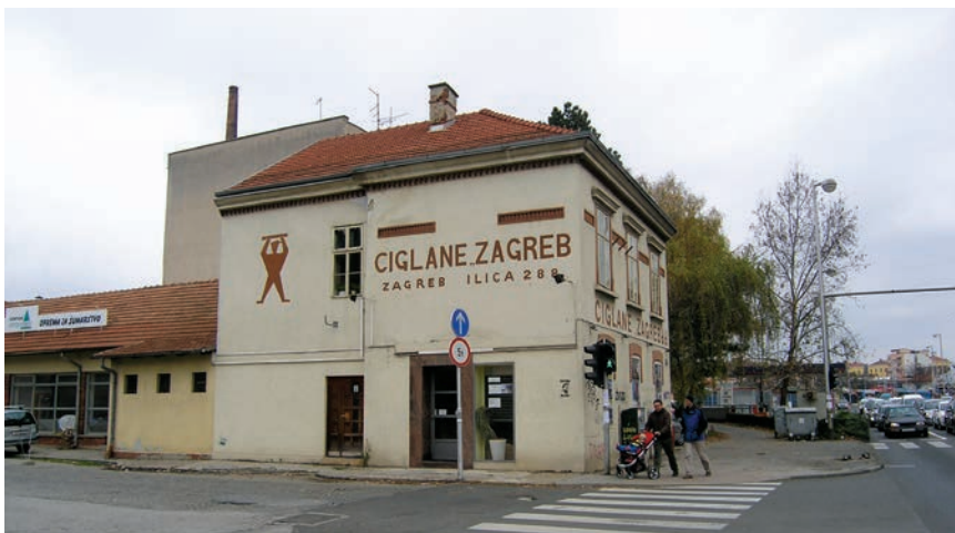
Upravna zgrada ciglane na Ilici

meri". U 17. st. na tom su se području spominjala još neka sela kao što su Čukovići, Vrhovci, Jelenovac i Domjanići. Na jugozapadu se današnje gradske četvrti Črnomerec nalazi Grmošćica, posjed koji je u srednjem vijeku izvjesni plemić Petar darovao Kaptolu. U opisu se tog prostora spominje blatni brijeg pa zato ne čudi da se sve donedavno na tome prostoru proizvodila opeka. Selo je 1819. imalo 197 stanovnika, a već se 1878. taj broj povećao na 725, čemu je uvelike kumovao snažan gospodarski razvoj. U to se vrijeme spominju i novija naselja kao što su Mikulići, Frateršćica, Bijenik, Novaki, Kustošija... Sve do 1945. granica je Zagreba bila na potoku Kustošaku pa je zapadni dio Črnomerca tek tada postao dio grada. To je inače bilo jedno od najstarijih naselja u zagrebačkoj okolici