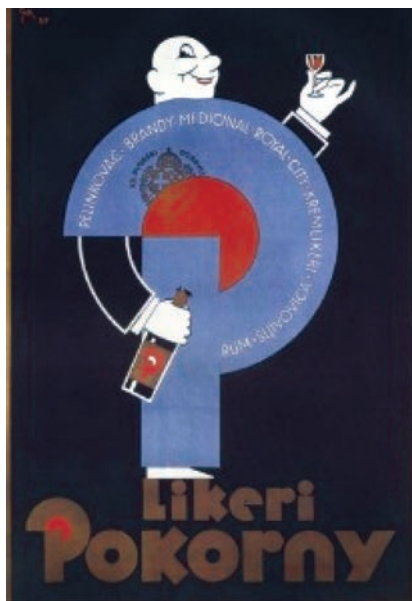
Reklama za najpoznatiji liker tvornice Pokorny

Dakle, uz zapadni rub Kvatric, na istočnome rubu Donjeg grada kao povijesne zagrebačke jezgre, na površini od tri hektara nastao je složen i velik industrijski blok. Taj je prostor od svog nastanka