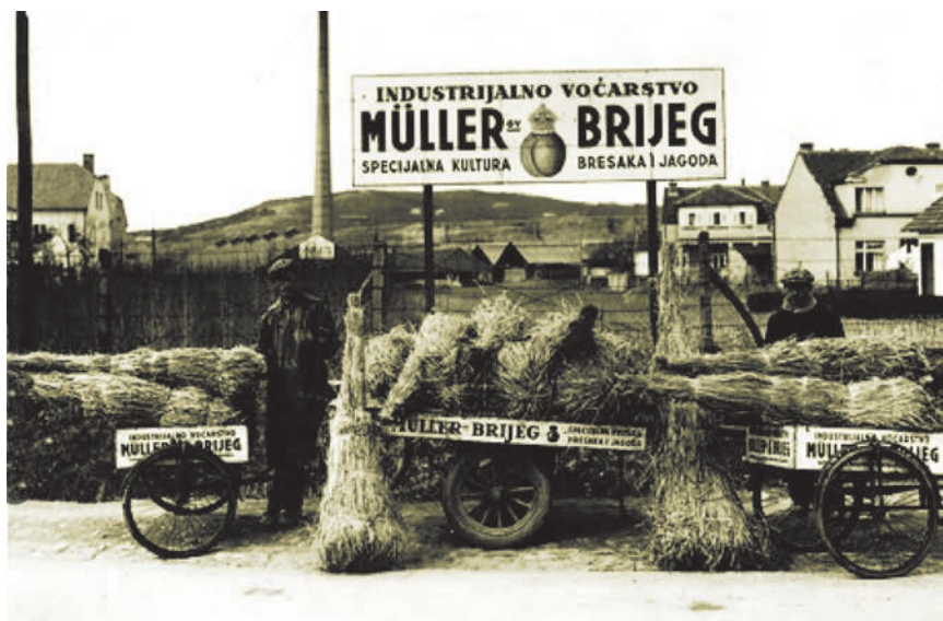
Štand za prodaju voća uzgojenog na Müllerovu brijegu

Nije poznato što je Adolfa potaknulo na to da svoje djelatnosti od 1910. proširi i na područje kulture. Pitanje jest je li povod za taj korak bila fascinacija novom filmskom umjetnošću ili je Müller u tome naslutio nove poslovne mogućnosti. Poznato je da je fotograf i avangardist Franjo Mosinger (1899. – 1956.) već 1896. u dvorani Hrvatskog sokola i Kola organizirao prvu javnu filmsku projekciju, a da je 1906. u Zagrebu otvoreno prvo stalno kino Pathé Bioskop , poslije Union , u Gajevoj 1. Agilni je Mosinger već 1912. potaknuo gradnju kino-kazališta Apollo u Ilici 31 (današnje kazalište Kerempuh ), a njegov je projektant bio Ignjat Fischer (1870. – 1948.), jedan od najboljih i najplodnijih arhitekata onog doba koji je projektirao i zgradu Hrvatskog sabora i palaču Gradske štedionice na Trgu bana Jelačića. Projekt Apollo donio mu je glas