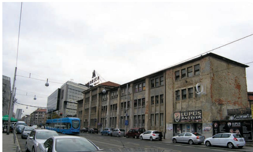
Zgrada rafinerije i pecare, poslije dio tvornice Gorica

Zahvaljujući kvaliteti svojih proizvoda te širokom gospodarskom i poduzetničkom angažmanu, Arko , tvornica vina i rakije, uspješno je preživjela Drugi svjetski rat, nakon 1945. u izmijenjenim je uvjetima nastavila proizvodnju, a 1950. ujedinjena je s poduzećem Marijan Badel . To međutim nije bio kraj kompletiranja budućega giganta u proizvodnji žestokih alkoholnih pića jer se u pedesetim godinama prošlog stoljeća u koncern uključio i Badel , poznata tvornica alkoholnih pića koju su znatno prije rata u Sesvetama osnovali otac i stric narodnog heroja Marijana Badela (1920. – 1944.). Tako je ime poznatog revolucionara, za razliku od