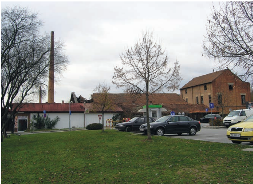
Dio sadržaja bivše ciglane

tvarane su postupno kako se širio grad ili su se gradile vojarne. Jedna je ciglana od 1870. postojala u Ilici na broju 157, dakle znatno prije nego što je 1885. Adolf Müller otvorio vlastitu tvornicu opeke u Črnomercu na broju Ilica 288, koja se poslije razvila u veliki industrijski pogon. Ciglanu je imao i u Baniji, nadomak Karlova, a i rudnik u Kosovskoj Mitrovici. Črnomerec se spominje već u 13. i 14. st. kao jedno od naselja gradečkih kmetova. Prema raširenoj zagrebačkoj legendi, potok je i predjel kroz koji prolazi nazvan prema nekom mesaru koji je loše mjerio meso pa se za njega govorilo da "črno