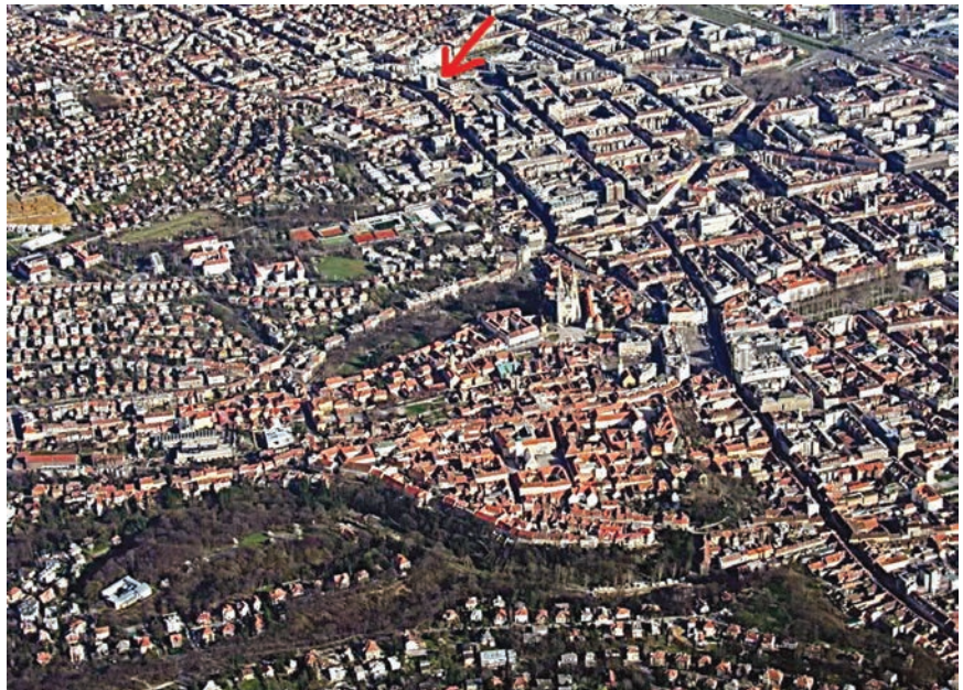
Blok bivših pogona tvornice Badel na panorami Zagreba