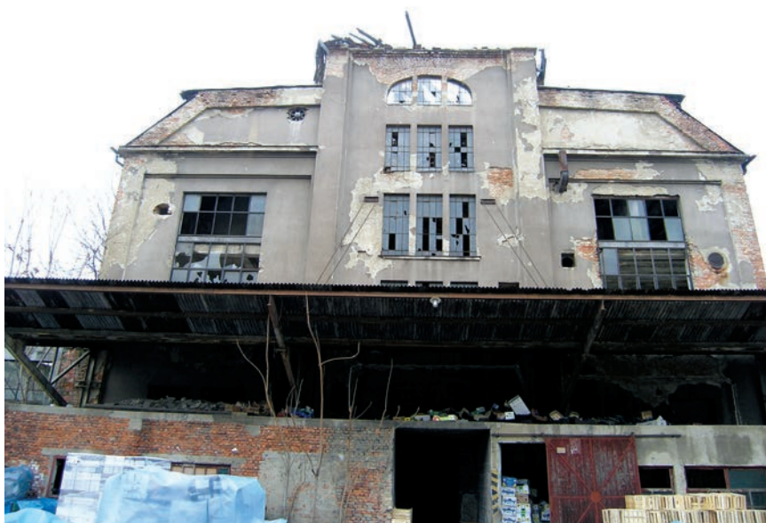
Ostaci proizvodne zgrade pjenice (destilerije)

ni su i krovni prozori. Zgrada rafinerije i pecare žeste, a poslije i tvornice posuđa, uglovnica je Martičeve i Šubićeve. Također ima kompoziciju fasadne obloge, ali i reklamni displej na krovu, pa je dio konture gradskog bloka i prepoznatljiv znak u prostoru. Poslovno-pogonski trakt ispred pogonskih zgrada detaljem stiliziranog portika na sjevernome pročelju ističe reprezentativnost ulaza. Sve su te zgrade oblikovane u secesijskome stilu. U tom su golemom kompleksu zaštićene četiri zgrade, i to središnja destilerija, rafinerija, poslovno-pogonski dio i upravna zgrada u Vlačkoj koja je jedina temeljito obnovljena i u kojoj je današnja Uprava Badela 1862 . Ta je reprezentativna zgrada građena kao neoklasicistička palača i služila je kao obiteljska rezidencija, u njoj je bila i Arkova kolekcija slika, a između kuće i međašnog trga bio je uređen perivoj.