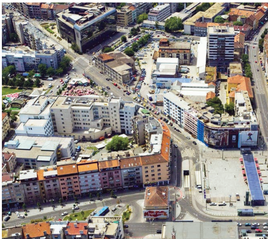
Blok Badel snimljen iz zraka

Tvornicu je proslavio Franjo Pokorny (1826. – 1893.), podrijetlom iz Petrinje, koji je nakon tri razreda pučke škole otišao izučiti zanat u Karlovac, potom u Sisak, a onda i u Zagreb. Radio je kao poslovođa u tvornici likera Mihić-Sabljič . Nakon što je svladao potrebna znanja iz tehnologije destiliranja i slično, otplatom je postao njezin vlasnik. Tvornica je tada promijenila naziv u Pokorny, kr. povl. zagrebačka dionička tvornica likera i počela primjenjivati nove tehnologije u proizvodnji voćnih destilata. Tvornica je proširila djelatnost i na proizvodnju i doradu vina te je, zahvaljujući primjeni najsuvremenijih postupaka, već na Prvoj dalmatinsko-hrvatsko-slavonskoj izložbi u Zagrebu 1864. osvojila najviša odličja. Slične uspjehe postigla je i na izložbama u Beču, Parizu, Londonu, Philadelphiji, Sidneyu i drugdje. U želji da po-