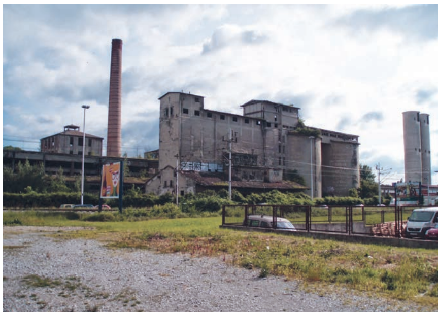
Glavna pogonska zgrada i ostali sadržaji