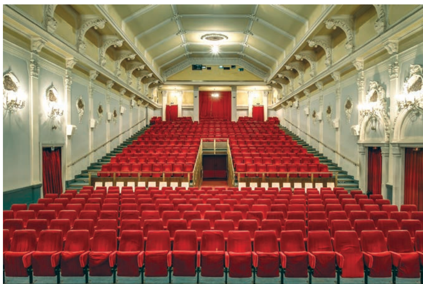
Gledalište sadašnjeg kina Europa

Bila je to prva hrvatska kinodvorana u cijelosti namijenjena za filmske projekcije. Izgrađena je na željeznoj konstrukciji i dugačka je 50 m, a široka 15,5 m. Pročelja su jednostavna i bez ukrasa, a na bočnim su stranama istaknuti potpornji konstrukcije. Podijeljena je u dva dijela. U sjevernom su dijelu blagajne i čekaonice, a u južnome gledalište dugo 40 m, široko 14 m i visoko 11,5 m s pozornicom. U luksuznoj je čekaonici u prizemlju bio urešen bife, u sredini je bio vodoskok od umjetnoga kamena koji je izradio kipar Emerik Sunko, a okolne su kiparske ukrase i kipove na mramornim stupovima izradili kipari Pitzger i Vihrina. Raskoš je tog kina oduševljavala sve naraštaje posjetitelja, a od 2013. zaštićeno je kulturno blago. Štoviše, Gradsko poglavarstvo