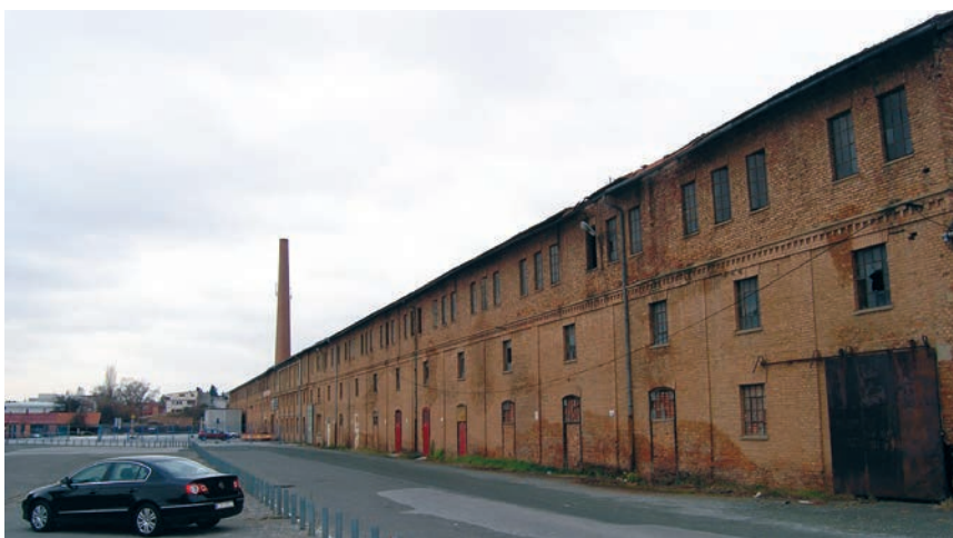
Glavna pogonska zgrada bivše ciglane

tvarane su postupno kako se širio grad ili su se gradile vojarne. Jedna je ciglana od 1870. postojala u Ilici na broju 157, dakle znatno prije nego što je 1885. Adolf Müller otvorio vlastitu tvornicu opeke u Črnomercu na broju Ilica 288, koja se poslije razvila u veliki industrijski pogon. Ciglanu je imao i u Baniji, nadomak Karlova, a i rudnik u Kosovskoj Mitrovici. Črnomerec se spominje već u 13. i 14. st. kao jedno od naselja gradečkih kmetova. Prema raširenoj zagrebačkoj legendi, potok je i predjel kroz koji prolazi nazvan prema nekom mesaru koji je loše mjerio meso pa se za njega govorilo da "črno