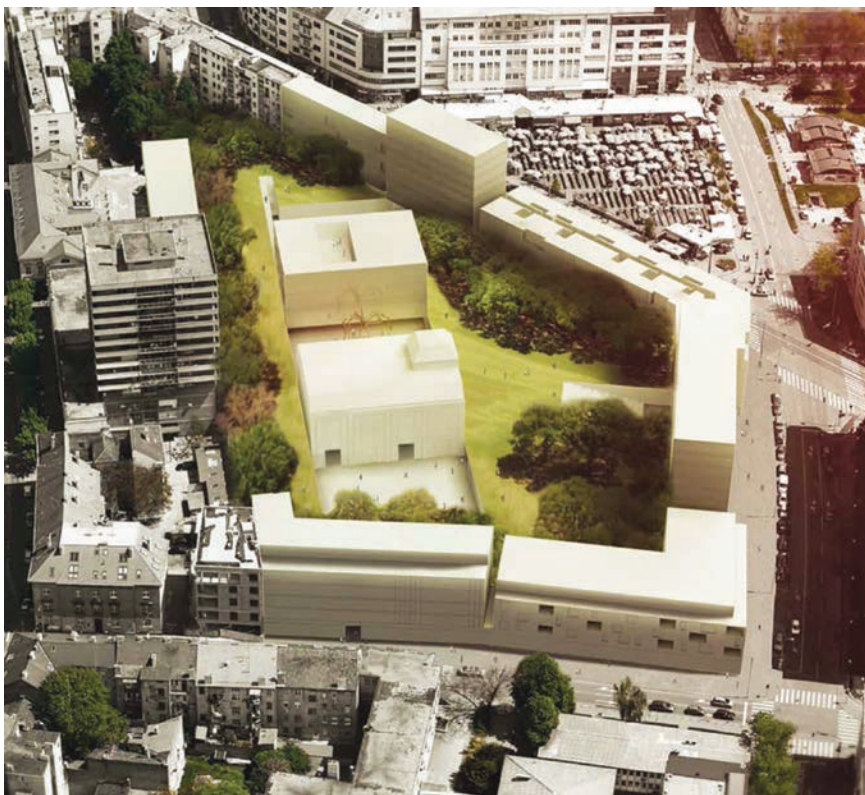
Prikaz nagrađenog rješenja Bloka Badel

mnogih drugih, dobila tvrtka koja je s njim ipak bila povezana. Badel se 1970. ujedinio s Vinoproduktom , tvrtkom koja je imala vinarije širom Hrvatske, pa je tako započela i tradicija vinarstva. Tvrtka ima i punionicu izvorske i mineralne vode u Apatovcu podno Kalnika, a od 2006. u njezinu je sastavu i tvrtka Eurobev d.o.o. koja proizvodi sokove, nektare i sirupe. Badel ima i posebne pogone u Sarajevu, Beogradu i Skoplju.