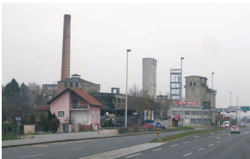
Pogled na glavne građevine bivše tvornice

Nakon Drugoga svjetskog rata tvornica je nacionalizirana i od 1950. nosila je naziv Sloboda , a potkraj poslovanja i Dalmacijacement . Opseg je proizvodnje znatno povećan 1954. pa je kop otvoren i u dnu padine. Godine 1962. povećana je eksploatacija lapora te se s ručnog iskopavanja prešlo na masovno miniranje. Već su sljedeće godine primijećena prva oštećenja poput nagnutih stupova i