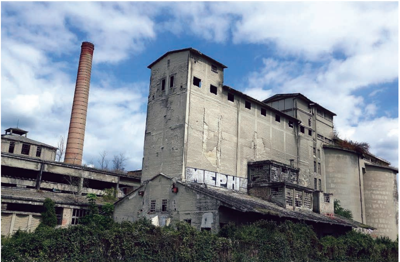
Detalj iz tvorničkog kruga s uočljivim oštećenjima

pukotina na zgradama u blizini iskopa. Zbog sve većih potreba za cementom odlučeno je da će se graditi nova, suvremena tvornica. Provedena su istraživanja tla, ali pritom već prije uočeni nagibi i oštećenja nisu uzeti u obzir. Gradnja je završena 1976., a već su sljedeće godine uočeni znakovi pojave klizišta. Tvornica je obustavila rad 1988. kada je uočeno da se intenzivnim iskapanjem lapora (procijenjeno je da ga je na tome području iskopano ukupno 5,3 milijuna kubnih metara, odnosno 13 milijuna tona) aktivirano klizište Kostanjek , jedno od najvećih koje je u urbanoj sredini zabilježeno u literaturi. Klizanjem bokova i sjevernog zaleđa zahvaćeno je područje od 1,2 km 2 u kojemu je petstotinjak stambenih i gospodarskih zgrada. U vrijeme zatvaranja tvornice izrađen je i usvojen Generalni urbanistički plan zaštite i prenamjene prostora, ali od svega se odustalo. Grad se pravda da i ne može ništa učiniti jer su sredinom devedesetih godina prošlog stoljeća na-