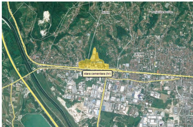
Prostor koji je zauzimala Tvornica cementa u Podsusedu

jednički vodili Leo Höningsberg (1861. – 1911.) i Julije Deutsch (1859. – 1922.), a koja je poslovala od 1889. do 1911. godine. Tvornica je bila u vlasništvu Cementia Holdinga A.G. iz Züricha i zvala se Croatia d.d. sve do kraja Drugoga svjetskog rata. Vjeruje se da je njezin prvi predsjednik uprave bio ugledni poduzetnik i predsjednik Eskomptne banke Fran Švrljuga (1844. – 1921.), međutim pravi vlasnici nisu poznati. Naime, poznato je to da je osnovni pogon kasnijega velikog holdinga kao svojevrсни obrt osnovao djed posljednjeg vlasnika i direktora Felixa Mandla (1898. – godina smrti nepoznata) 1867. godine. U sastavu su tog sustava bile raznovrsne tvornice u Austro-Ugarskoj Monarhiji, ali čini se da je u njemu bio velik udio mađarskog kapitala koji se nakon Prvoga svjetskog rata pokušavao skloniti u Švicarsku.