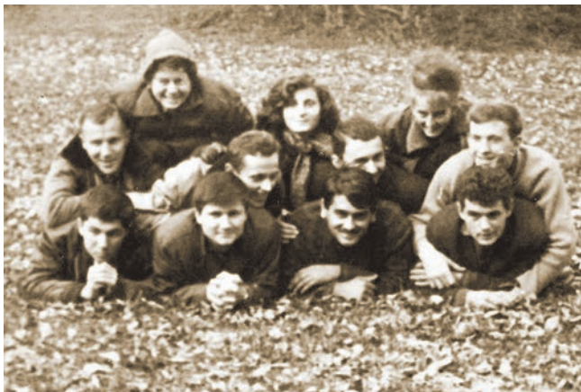
Prvi studentski izlet na Sljeme