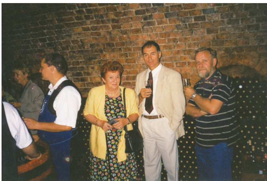
Posjet Mađarskoj 2005. s kolegama s Građevinskog fakulteta u Osijeku

Prema osobnome priznanju, naj sretnije su mu godine bile one koje je od 1998. do 2002. proveo kao generalni konzul u Pečuhu, ali ni to nije, kao uostalom i sve ostalo u njegovu životu, prošlo bez određenih problema, posebno prije pre-