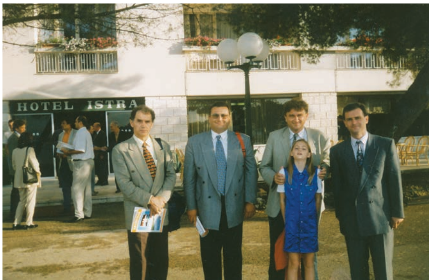
Zajednička snimka iz 1998. s kolegama na kongresu na Brijunima

Bio je stručni konzultant Tehničkog ureda Europske unije u Mostaru pri obnovi Carinskog mosta (1996.) i mosta na Čekrku zvanog Hasan Brkić (1997.) te član Tehničkog povjerenstva za tehnički pregled obnovljenoga Starog mosta (2005.) u Mostaru, a bio je član i ondašnjih jugoslavenskih odbora za beton i prednapinjanje te tehničkih odbora betonske konstrukcije i za nazivlje u Hrvatskom zavodu za norme. Bio je i u uredničkome odboru za publikacije Hrvatskog društva građevinskih konstruktora, a uredio je dvije dvojezične knjige (1994. i 1998.) Prikaz hr-