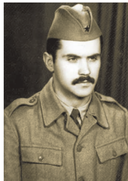
Fotografija sa služenja vojnog roka