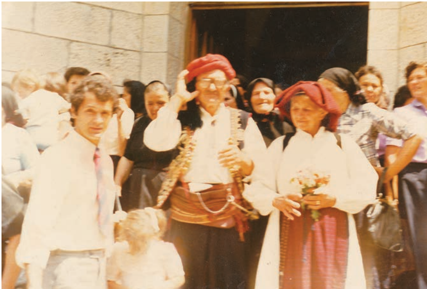
Detalj iz 1981. s proslave 50. obljetnice braka njegovih roditelja

Takvi su se postupci prorijedili nakon što je njegova supruga, iznervirana maltretiranjima, digla veliku dreku i pošteno izvrijeđala "posjetitelje". Ipak, najviše je problema imao s produživanjem isteklih dokumenata, osobito putovnica. To je obično trajalo vrlo dugo, čak toliko dugo da je ponekad ugrožavalo i redovite obveze koje je prof. Marić imao u inozemstvu. Na kraju bi sve završavalo razgovorom s nekim referentom ili referenticom i svojevrsnim "ispiranjem mozga".