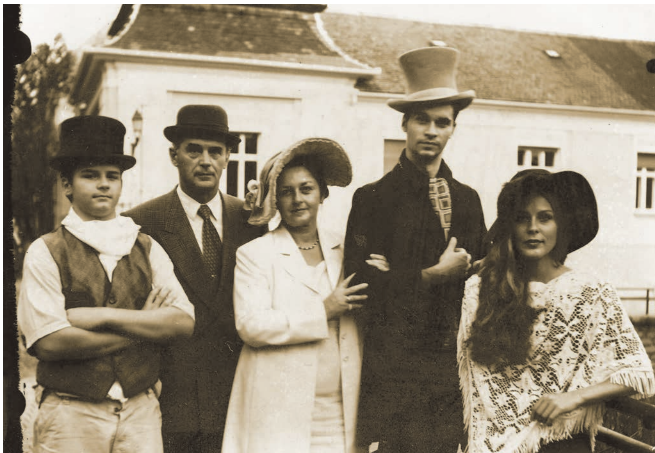
Zajednička obiteljska fotografija iz Pečuha 2000. godine