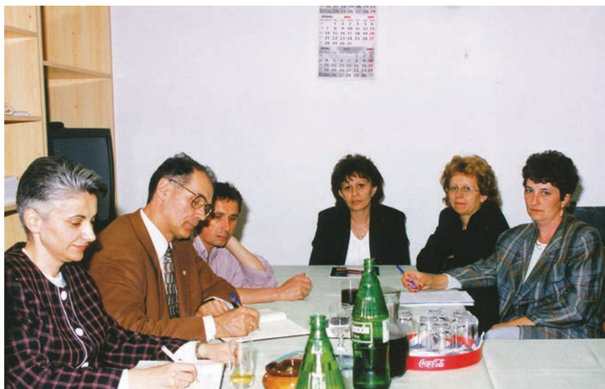
Susret generalnog konzula s predstavnicima Hrvata iz Mohača 2000.