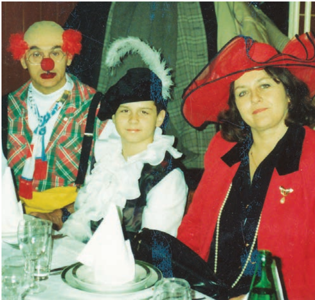
Maskirana uspomena na Poljsku večer 1997. u Zagrebu