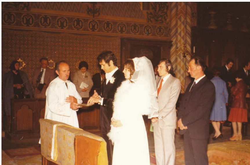
Vjenčanje u Budimpešti 1976.