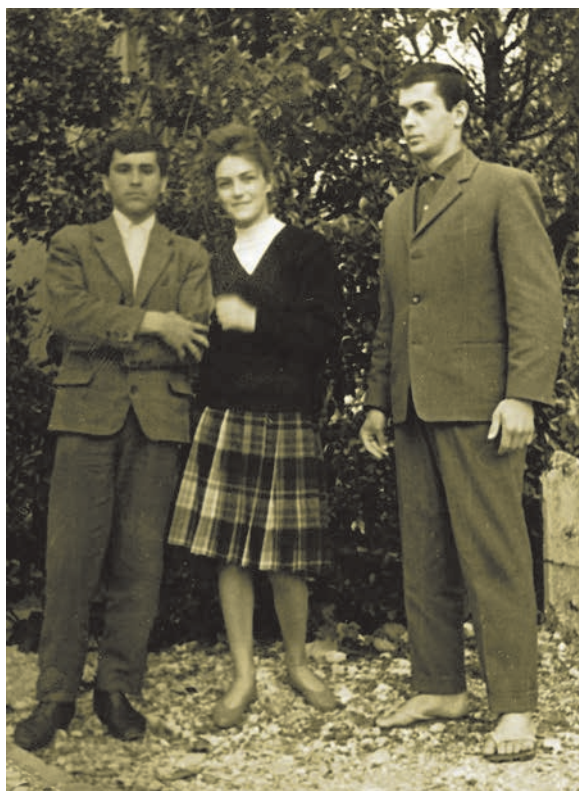
Zajednička snimka sa "suplemenicima" Marićima u Mostaru 1962.

Prvi se pisani spomen Vinjana nalazi u jednoj sudskoj ispravi iz 1371. u kojoj presuđuje vojvoda Krasimir od Imote, što je ujedno prvi pisani spomen Imotske krajine nakon doseljenja Hrvata. Izvorno se naziv Vinjane odnosio samo na predio između Vira i Posušja u današnjoj Hercegovini, na granici Imotske krajine, a vjerojatno je obuhvaćao i Vinjane Gornje s druge strane