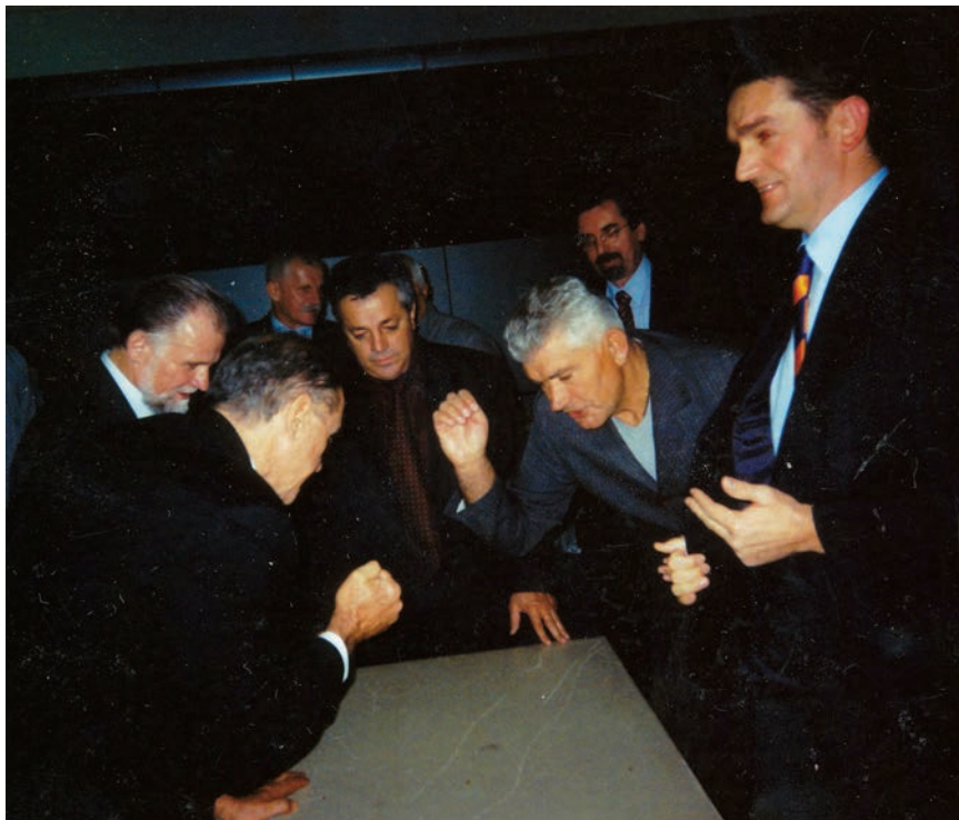
Turnir u šijavici 2010. (ukupno 12 sudionika)

Prof. Marić bio je i predsjednik Odbora za podizanje spomenika fra Grgi Martiću (1822. – 1905.), skupljaču narodnih pjesama, pjesniku, preporodnome književniku te kulturnome i političkome djelatniku. Taj mu je Posušak iz Rastovače vjerojatno posebno blizak i zato jer je također bio poliglot, odnosno govorio je latinski, talijanski, francuski, turski, mađarski i njemački jezik. Dva metra visok brončani spomenik, rad kipara Mladena Mikulina, postavljen je 1994. u malome parku u Martičevoj ulici kao dar Zavičajnog društva Posušja Zagrebu u povodu 900. obljetnice Zagrebačke biskupije. Godinu je dana poslije postavljen brončani kip Grga Marića pred starom crkvom Blažene Djevice Marije u Posušju (rad kipara Izvora Oreba). Po-