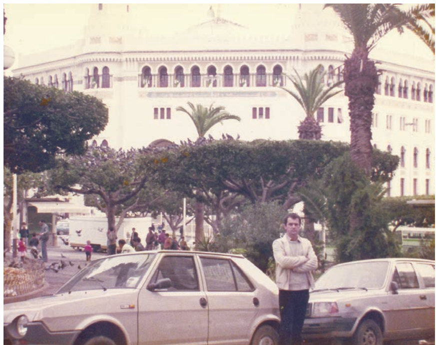
Uspomena na boravak u Alžiru (u pozadini glavna pošta)

Zbog znanja je svjetskih jezika djelovao u mnogim znanstvenim institucijama i tijelima. Bio je član Tehničkog odbora za dimenzioniranje Međunarodnog odbora za beton (CEB – Comité euro-international du béton ) od 1989. do 1994. i posebno-ga FIP-ova ( Fédération internationale de la précontrainte ) povjerenstva (FIP Commission 10 ) od 1995. do 1998. Bio je i član znanstvenih odbora na mnogim