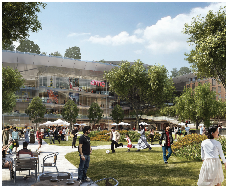
Dio sadržaja na zelenom krovu kojima se želi privući stanovnike "aktivnog stila života"

Približno 300.000 m 2 zelenog krova žarišna je točka projekta u Vallcou . Krov će početi na razini ulice, a zatim će se polako dizati i na kraju širiti preko malih mostova izgrađenih iznad ulice Wolfe Road i na nove zgrade. Prostor će biti otvoren svima, no planirana topografija poslužit će kao tampon zona te osigurati privat-