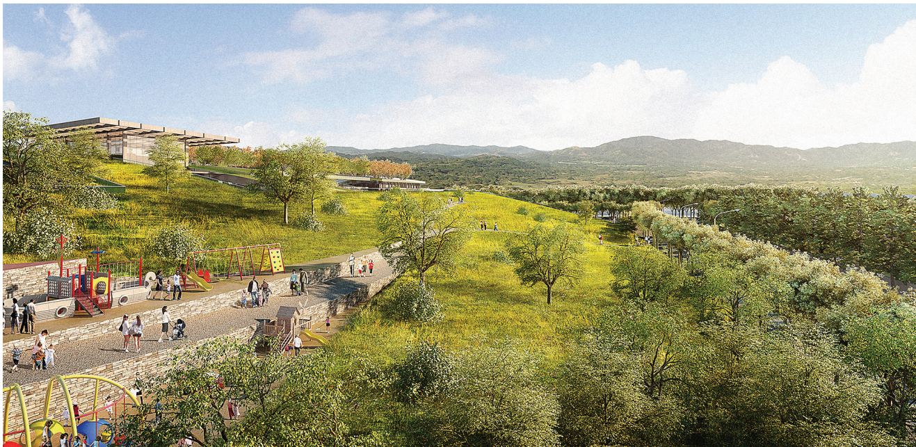
Zeleni je krov potpuno prilagođen pješacima i biciklistima

Za razvoj je projekta zadužena tvrtka Sand Hill koja planira izgraditi i novu, 20 milijuna dolara vrijednu osnovnu školu, a izgradit će i druge 40 milijuna dolara vrijedne sadržaje koje će koristiti šira zajednica i lokalni školski okruzi.