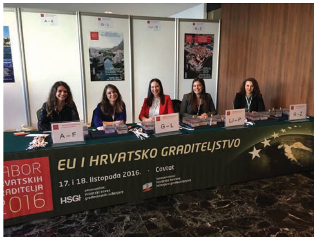
Zajednička fotografija saborskih hostesa