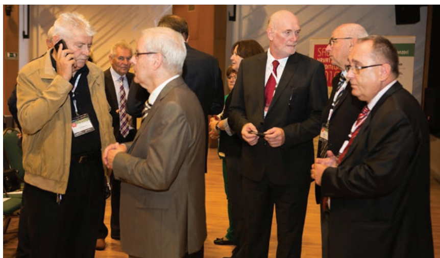
Detalj iz dvorane prije početka plenarne sjednice

Potom su dodijeljene dvije nagrade za životno djelo, o čemu također donosimo iscrpno izvješće. Nakon dodjele nagrada počela je plenarna sjednica, a prvi puta održana je i panel-diskusija koja je također opisana u posebnome izvješću.