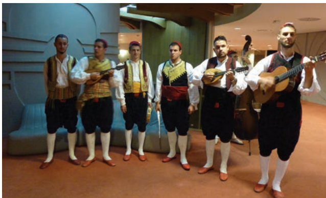
Goste je na koktel dobrodošlice zabavljala klapa Kaše