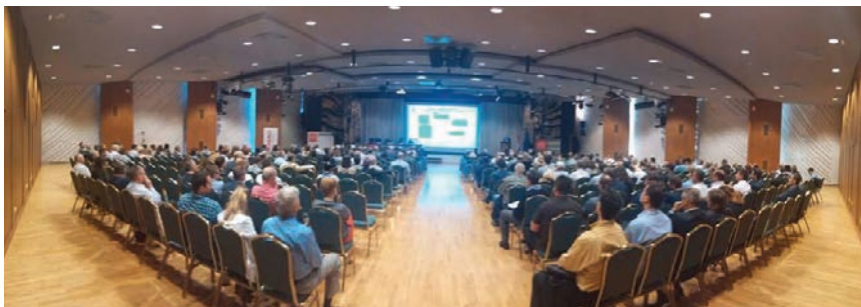
Detalj sa svečanog otvorenja Sabora