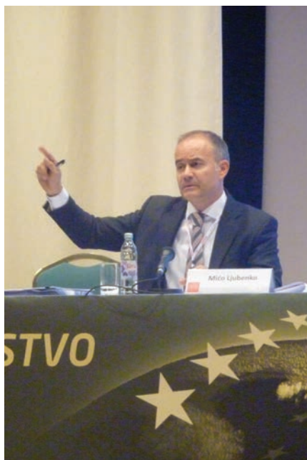
Događanja na okruglom stolu o uzancama