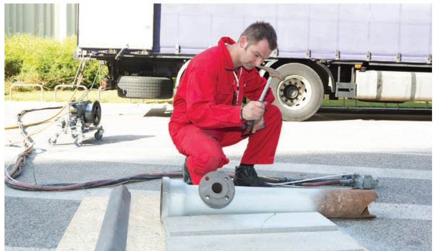
Ispred hotela Croatia održane su i dvije zanimljive demonstracije postupka zaštite metalizacijom