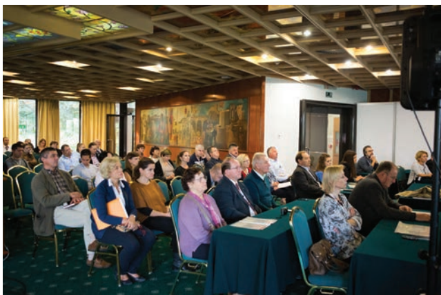
Sekcija Organizacija i tehnologija građenja