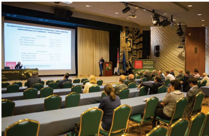
Detalj rada sudionika okruglog stola o Dubrovniku

Luka Jelić, dipl. ing. građ., govorio je o tehničkim rješenjima i prijedlozima kratkoročnog razvoja vodoopskrbe i odvodnje otpadnih voda grada Dubrovnika. Prikazano je kako danas funkcionira sustav vodoopskrbe i odvodnje grada Dubrovnika i navedeni su najvažniji problemi tog sustava: nedovoljna izgrađenost sustava vodoopskrbe i odvodnje, povremeni problemi u vodoopskrbi zbog pojava zamucenja vode, problemi u odvodnji otpadnih voda zbog mjestimičnih pojava tečenja pod tlakom ili