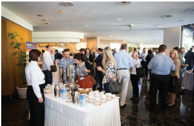
Detalj druženja na jednoj od pauza za kavu