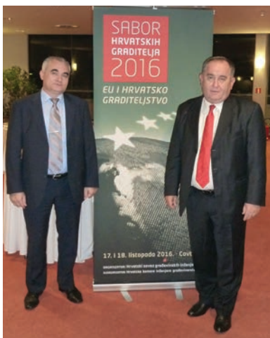
Detalji s druženja sudionika na koktelu uoči Sabora