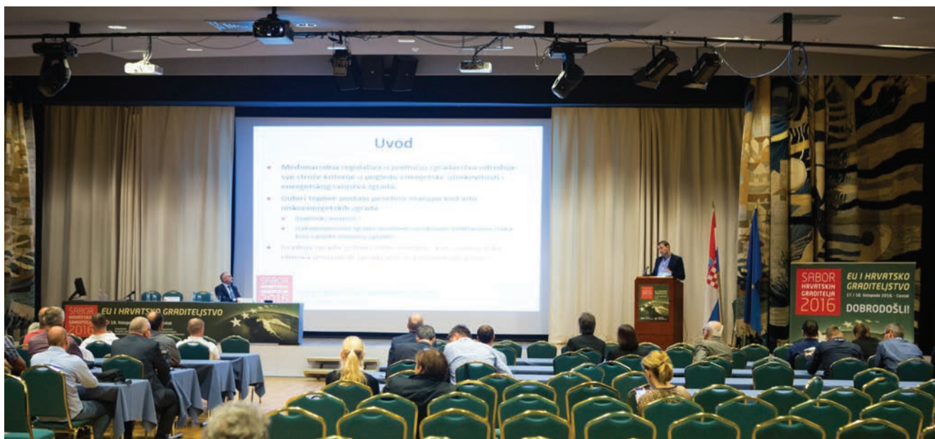
Sekcija Investicije i izazovi u realizaciji

no su održana paralelna predavanja u kongresnim dvoranama Ragusa , Bobara i Orlando .