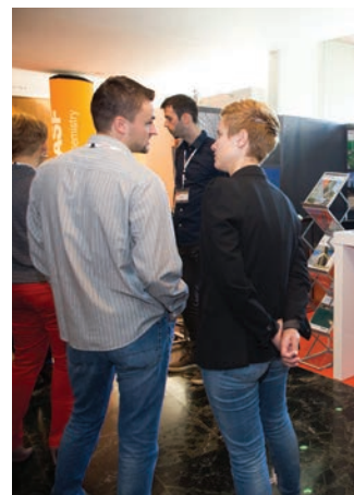
Razgovori sudionika vodili su se između predavanja na terasi hotela, ali i pred izložbenim prostorima tvrtki sponzora