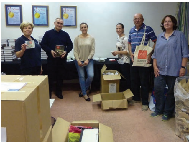
Slaganje materijala za sudionike Sabora