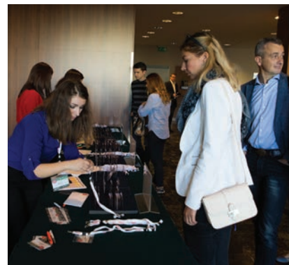
Detalj s akreditacije sudionika

stori i sve što je potrebno za održavanje tako velikog skupa. Sve su pripreme obavljane pod vodstvom članova Izvršnoga organizacijskog odbora, a valja istaknuti i poseban doprinos predsjednika Izvršnog organizacijskog odbora te Znanstvenoga odbora prof.842 dr. sc. Stjepana Lakušića. Sutradan je pripremljen promotivni materijal za sve sudionike i organizirana recepcija. Zaposlenicima HSGI-a pomagali su zaposlenici Hrvatske komore inženjera građevinarstva te studenti i asistenti iz Zavoda za prometnice Građevinskog fakulteta Sveučilišta u Zagrebu. Tijekom poslijepodneva i večeri počeli su stizati prvi sudionici koji su odmah registrirani, a tijekom večeri na terasi hotela Croatia održan je koktel dobrodošlice. Goste je zabavljala klapa Kaše . Na Saboru ukupno je bilo regi-