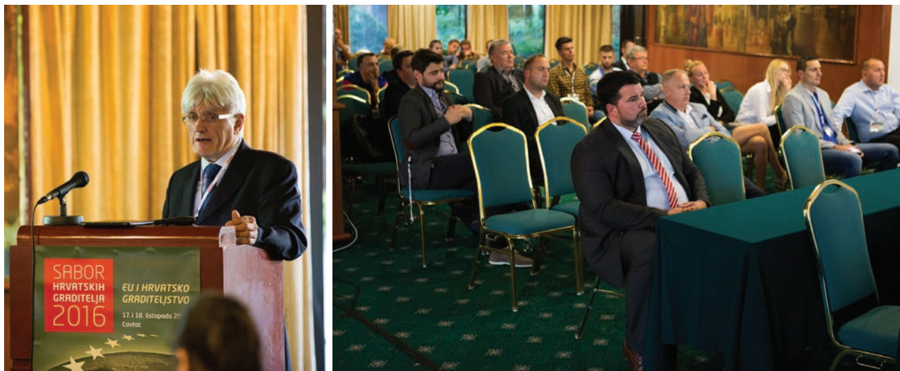
Detalji s predavanja u dvoranama Bobara i Orlando

ciplinarним istraživanjima potencijala bi- opepela za njegovo ponovno korištenje, s obzirom na niz varijabli koje utječu na njegov kemijski i fizikalni sastav.