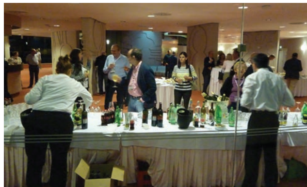
Koktel dobrodošlice u hotelu Croatia