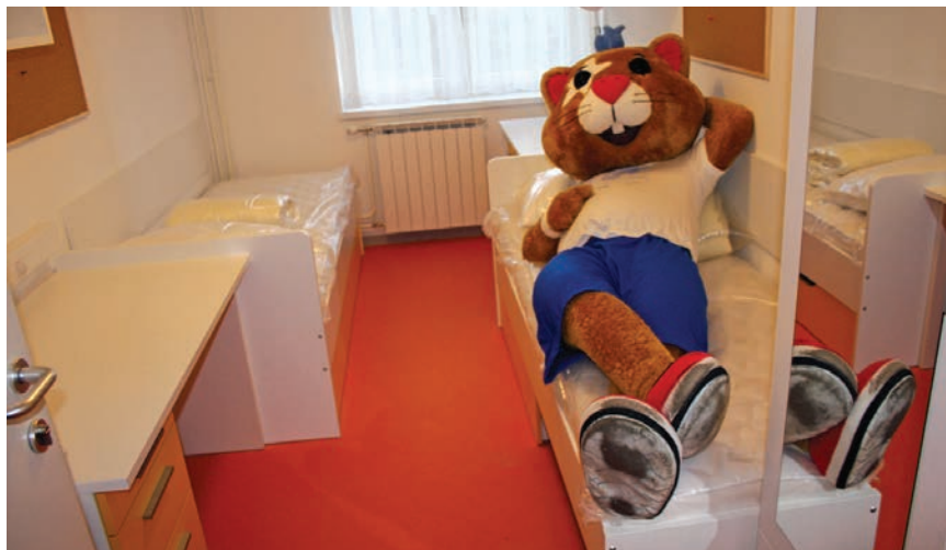
Hrki - maskota Europskih sveučilišnih igara u novoj sobi na Savi

skim domovima u Zagrebu, a novac im je isplaćivan tijekom obnove studentskih naselja. U tekućoj akademskoj godini, tijekom radova, studenti su pokazali razumijevanje i strpljivost, imajući na umu generacije koje dolaze nakon njih, kao i činjenicu da je cijeli ovaj projekt i osmišljen kako bi studenti dobili kvalitetnije uvjete za život i učenje u studentskim domovima.