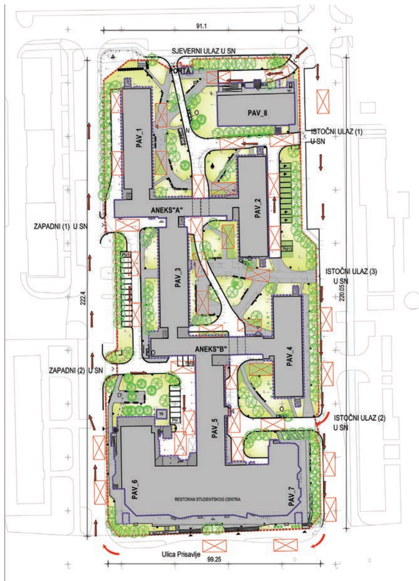
Pregledna situacija-zahvati na okolišu i infrastrukturi u domu Cvjetno

Kako smo doznali iz Studentskog centra , iz europskih fondova povlači se približno 220 milijuna kuna, a ostatak je sred-