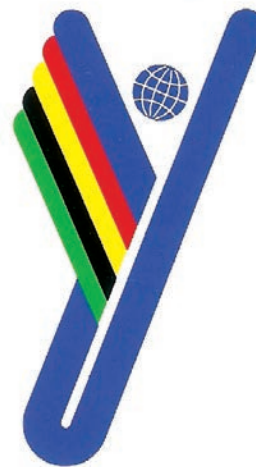
Maskota i logo Univerzijade održane 1987. u Zagrebu