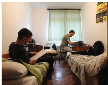
Soba u SD Cvjetno naselje prije obnove

U stambenim paviljonima bilo je smješteno tisuću studenata u dvokrevetnim sobama. Sobe su bile poprilično velike (duljine 3,60 m, širine 5,10 m i visine 2,60 m) pa je osiguran prostor za ormare i centralno grijanje. Zbog dnevne svjetlosti dio sobe uz prozor bio je namijenjen za rad, a stražnji dio sobe za boravljenje i spavanje. Na svakom su katu paviljona bile dvije prostorije s umivaonicima i tuševima te čajne kuhinje. Svaki paviljon