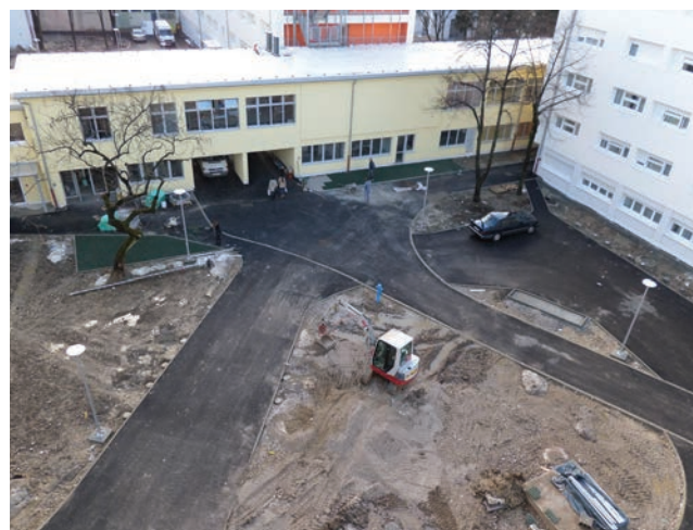
Radovi na uređenju okoliša ispred paviljona na Cvjetnom