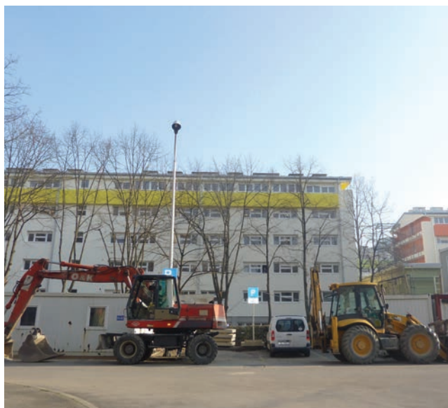
Detalji s gradilišta u Cvjetnom naselju