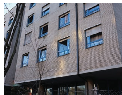
Paviljon na Cvjetnom prije rekonstrukcije