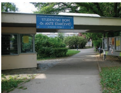
Studentsko naselje Ante Starčević

Popularna Šara obnavljana je 2003., kada su rekonstruirana sva tri domska paviljona, čime je znatno podignuta razina usluge. Dom je bio pripremljen za useljenje u siječnju 2004. godine, međutim tada, zbog financijskih problema, nije izgrađen planirani restoran. Broj ležajeva podignut je s 1070 na 1230, a svaka soba opremljena je modernim namještajem, hladnjakom, priključkom na internet i satelitskom antenom. U prizemlju su svakog paviljona dvije jednokrevetne sobe prilagođene osobama s invaliditetom. U