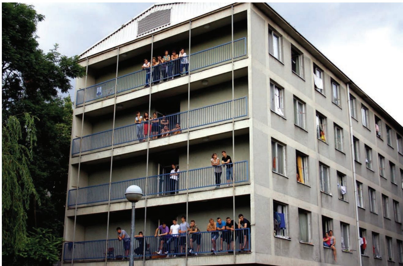
Paviljon u SD Stjepan Radić prije obnove

Inženjer Pinčar dodao je kako sada sve dvokrevetne sobe u Cvjetnom naselju imaju vlastitu kupaonicu, što dosada nije bio slučaj jer je u šestom, sedmom i osmom paviljonu jedna soba dijelila kupaonicu. U prizemlju osmog paviljona, umjesto pošte, uređen je sportski kompleks s teretanom i dvoranom za fitness i aerobik. Posebna pozornost u ovome projektu, koji nakon 29 godina prvi doprinosi znatnom poboljšanju studentskoga standarda u Zagrebu, posvećena je smještaju i kretanju studenata s invaliditetom te mogućnosti smještaja studenata slabijih financijskih mogućnosti u novouređene domove.