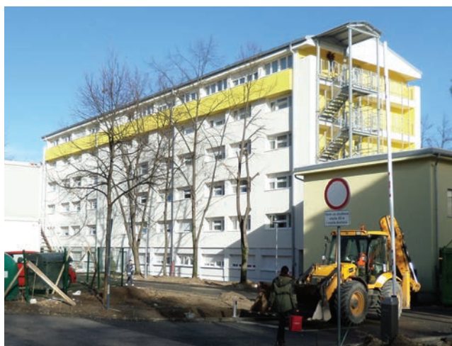
Sadašnji izgled paviljona 3 u Cvjetnom naselju