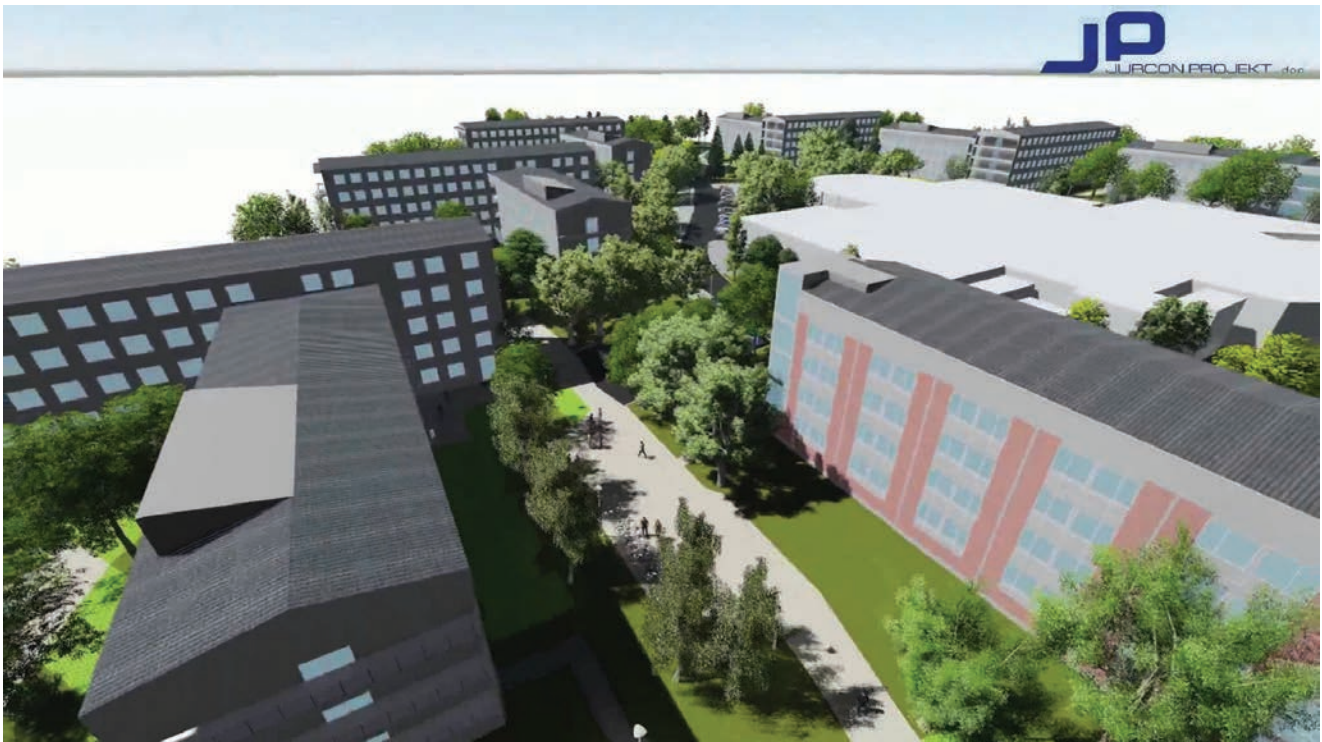
Detalj iz projekta uređenja okoliša na Savi

izradila je zagrebačka tvrtka Jurcon Projekt d.o.o. , dok je tvrtka Konzalting d.o.o. bila odgovorna za izgled i uređenje studentskih soba. Za novi izgled okoliša ispred SD-a Cvjetno naselje odgovoran je Institut IGH d.d. , a radove je izvodila tvrtka VDM Promet d.o.o. Kako bi studentski domovi bili reprezentativni za najveće studentsko sportsko događanje u Europi u 2016., obnovljeni su svi paviljoni u Cvjetnome naselju te sedam od 12 paviljona na Savi .