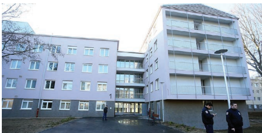
Novi izgled istog paviljona nakon rekonstrukcije

Doznali smo i to da je projekt obnove studentskih domova obuhvatio ukupno 2216 dvokrevetnih i 102 jednokrevetne sobe za studente s invaliditetom koje su opremljene suvremenim namještajem i priključcima na internet te hladnjakom. Prema projektnoj dokumentaciji koju je izradio glavni projektant Nikola Mustapić, dipl. ing. arh. iz tvrtke Konzalting