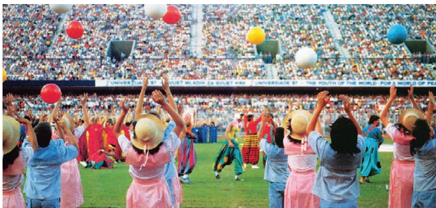
Detalj sa svečanog otvaranja ceremonije

Stjepan Radić s približno 4060 ležaja, a slijedi ga dom Cvjetno naselje s 1813 ležaja, potom SD Ante Starčević 1237 te SD Laščina s 480 kreveta.