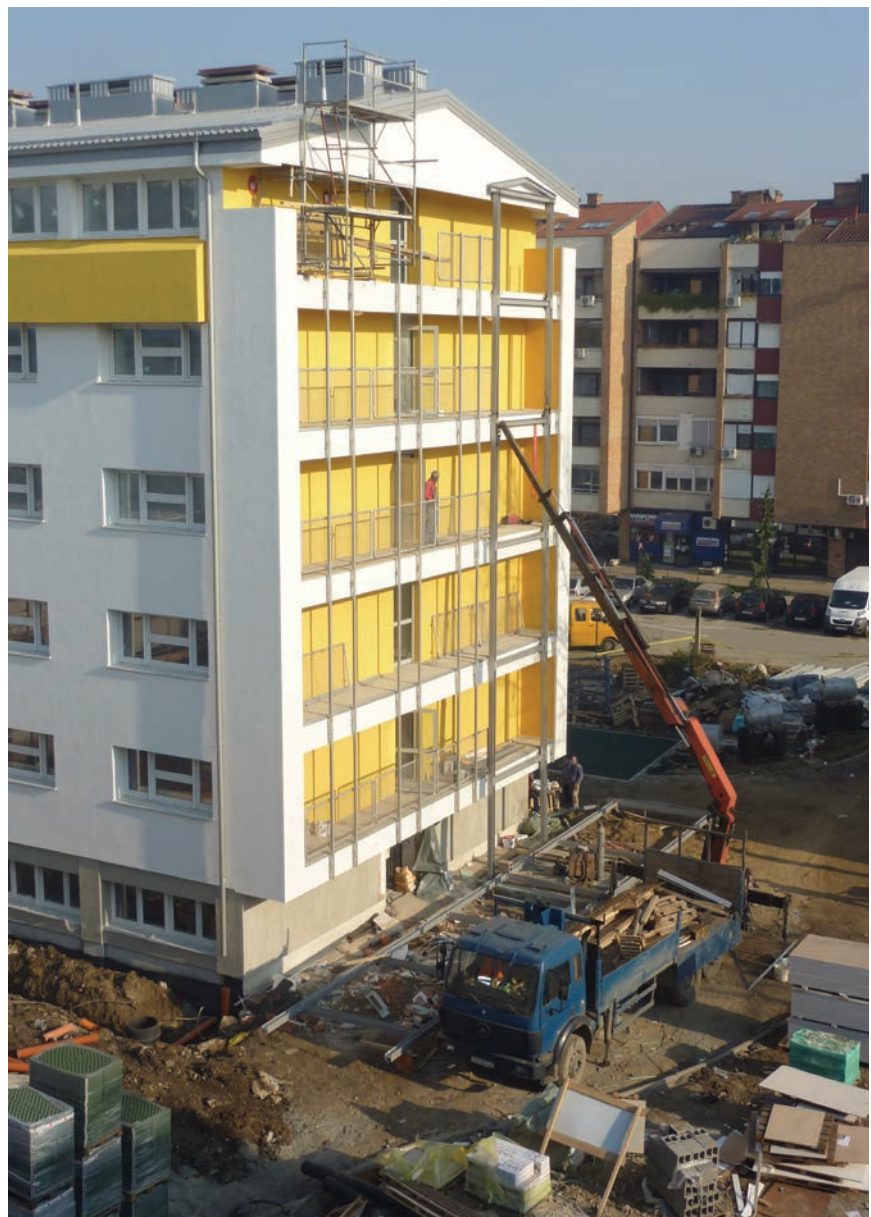
Postavljanje metalnih (požarnih) stepenica

omogućila je podizanje standarda studenata koji će imati iste uvjete za život kao i njihovi kolege u velikim europskim gradovima. Budući da studenti nisu mogli boraviti u svojim sobama tijekom radova, postignut je dogovor s Ministarstvom znanosti, obrazovanja i sporta. Naime, Ministarstvo je Odlukom o iznosu subvencija i kvoti za subvencionirano stanovanje u akademskoj godini 2015./2016., osiguralo sredstva za subvenciju privatnog smještaja u iznosu od 400 kuna mjesečno za ukupno 4534 studenta koji su ostvarili pravo na smještaj u student-