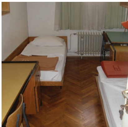
Studentska soba prije obnove

i pratećih sadržaja, a broji 4063 kreveta. Njegove prednosti u odnosu na ostale domove su dvije menze i pizzerija, slastičarnica, kino dvorana, kopiraonica i frizerski salon, a studentima je pružena i mogućnost učenja stranog jezika, rekreacije u fitness-centru, savladavanja plesnih vještina te drugih vještina. Iako je Sava dugi niz godina najpopularniji dom među studentima, oni donedavno nisu skrivali nezadovoljstvo zbog malih soba opremljenih dotrajanim namještajem i parketima, zajedničke kupaoalice s vidljivim oštećenjima uzrokovanim vlagom te buke zbog loše izolacije paviljona. Njihovim je mukama konačno došao kraj, jer je tijekom ljeta 2015. započela obnova studentskih naselja.