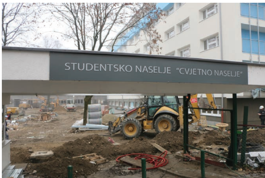
Detalj s gradilišta

imao je 75 soba sa 150 kreveta, a u prizemlju su bile smještene skladišne prostorije. Paviljoni su imali ograđene terase na ravnome krovu, namijenjene druženju stanara, no one su uklonjene tijekom obnove domova 1987. godine, kada je paviljonima dograđen dvoslivni krov, a