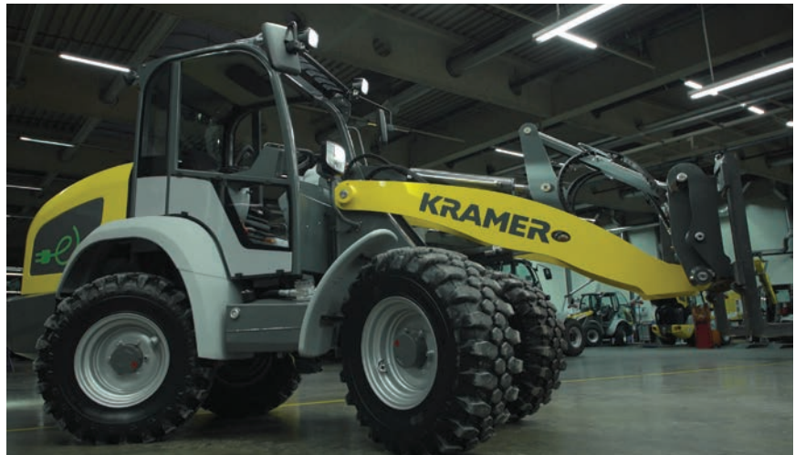
Utovarivač na kotačima, model 5055e, tvrtke Kramer Werke GmbH

Ta je tvrtka nagrađena za pilot-projekt rekonstrukcije kolnika čeličnog mosta po relativno niskim troškovima. Nakon što su popravljene čelične ploče koje su služile kao gazeći sloj kolnika, nanesen je epoksidni premaz koji je posut boksitnim granulatom. Na to su postavljeni posebno razvijena armaturna mreža i tanak sloj betona visoke čvrstoće, razvijenog u tvrtki Contec . Tako je nastala nova,