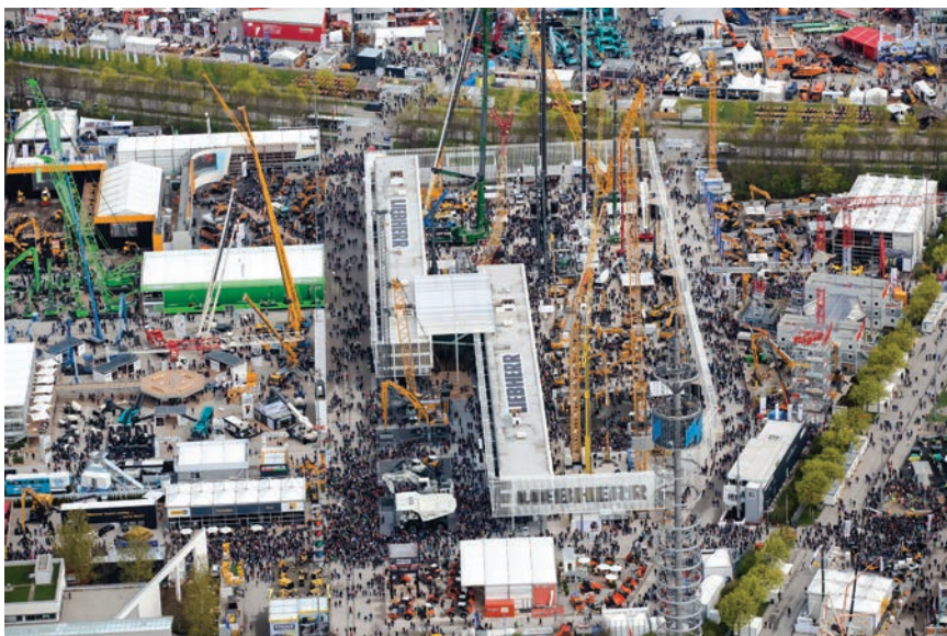
Pogled iz priče perspektive na otvoreni izložbeni prostor Bauma 2016

Ta je tvrtka nagrađena za svoj u cijelosti električni utovarivač na kotačima, model 5055e, koji su samostalno razvili i proizveli. Stroj ima sva četiri upravljiva kotača i ne emitira nikakve ispušne plinove, što ga čini idealnim za rad u tunelima i zatvorenim objektima, jer ne zahtijeva postavljanje skupe ventilacije. Poseban elektromotor zadužen je za pokretanje samog stroja, a drugi je zadužen za pogon hidraulike. Preciznom regulacijom njegove snage isporučuje se točno onoliko mehaničke energije koliko je potrebno u danome trenutku, što doprinosi ekonomičnosti eksploatacije. Električni je pogon vrlo zahvalan i za održavanje jer je trajan i pouzdan. Vrlo niska emisija buke