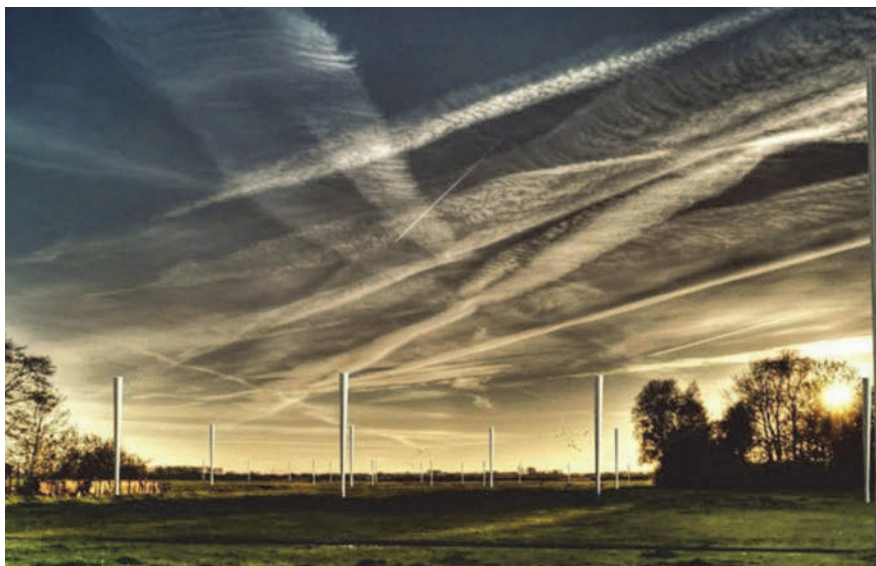
Vjetrenjače bez lopatica proizvode električnu energiju oscilacijama tornja

benigna je za biljni i životinjski svijet jer se nalazi unutar kućišta, a ima i žičane mreže koje štite životinje od slučajnog ulaska. Turbina se okreće zajedno s vjetrom te hvata njegove najbolje udare. Tesline turbine rade na principu tekućine koja prolazi vrlo blizu diskova te ih se pokreće pomoću viskoznosti i prljanja površinskog sloja tekućine.