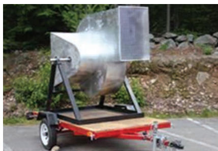
Vjetrenjača Soar Aero