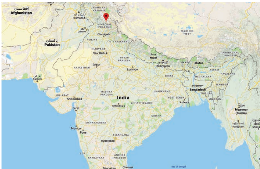
Položaj tunela Rohtang na zemljovidu