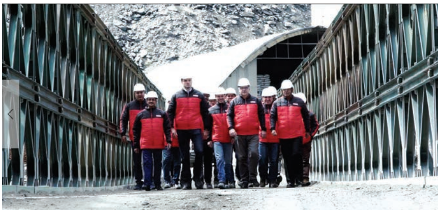
Projektni tim konzorcija Strabag Afcons

GPS-om kako bi nakon lavina i odrona ponovno pronašla put i opet ga iskopala. Usred prolaza mogući su iznenadni odroni zemlje i snježne oluje. Iako je vrlo opasan i nepredvidiv, Rohtang privlači turiste radi prekrasnoga planinskog pejzaža.