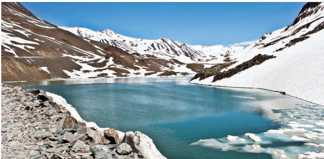
Planinski krajolik na Himalaji

njima su Rohtang La na 3978 m, Lungalacha La na 5059 m i Taglang La na 5328 m nadmorske visine. Prelazak tih prijevoja pravi je izazov i za najspretnije vozače. Planinski su vrhovi pod snježnim pokrivačem čak i usred ljeta, a bogata raznolikost raslinja i krševit krajolik pretvaraju svako putovanje u fascinantnu pustolovinu, koja, nažalost, ponekad završi s tragičnim posljedicama. Uostalom, naziv toga planinskog prijevoja "Rohtang" u prijevodu znači "gomila leševa",