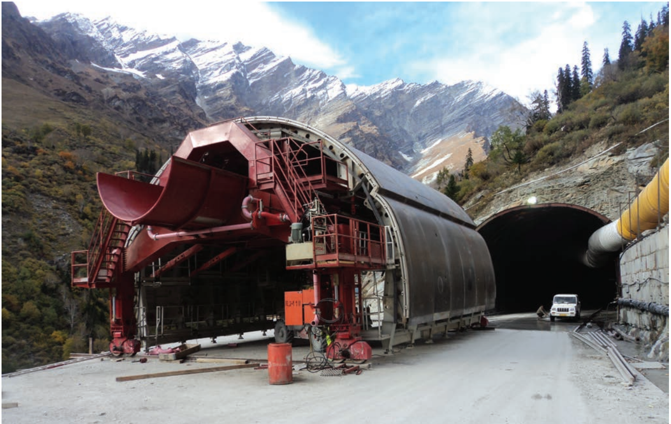
Oplata za betoniranje tunelske obloge

zatečene geološke i geotehničke uvjete na terenu, za gradnju tunela korištene su metode miniranja i bušenja. Primijenjena je metoda NATM (engl. New Austrian Tunneling Method ), postupak gradnje tunela temeljen na znanstveno utvrđenim i u praksi potvrđenim idejama i principima kako bi se mobiliziranjem kapaciteta stijenske mase postigli optimalna sigurnost i ekonomičnost.