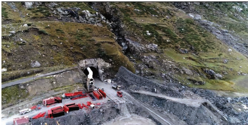
Pogled na sjeverni portal tunela Rohtang

druže seizmički aktivno, na gradilištu su potresi relativno česti, no, srećom, manje su magnitude, pa zasada nisu oštetili građevinske strojeve ni uzrokovali materijalnu štetu. Ipak, u zimskim mjesecima oni mogu pokrenuti snježne lavine. Zbog podizanja razine svijesti o opasnosti i o području na kojemu se radnici nalaze, stručni tim na gradilištu vodi posebnu brigu o edukaciji i pravilima ponašanja i zaštite u slučaju podrhtavanja tla.