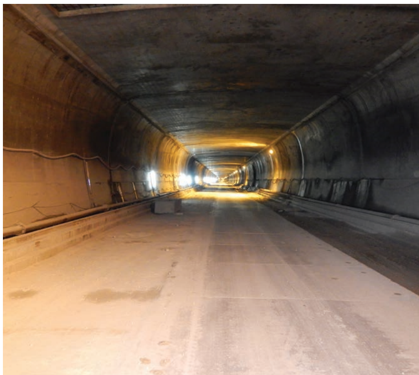
Tunel snimljen u siječnju 2018.