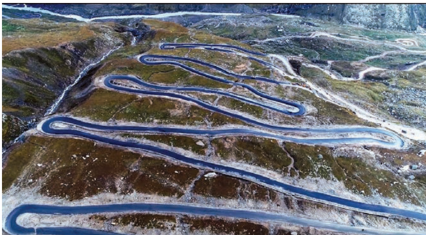
Nakon što budu dovršeni tunel i nova cesta; vožnja između gradova Manali i Keylong skratit će se za pet sati

Investitor projekta jest Ministarstvo obrane Republike Indije, odnosno njegov tehnički odjel BRO (engl. Boarder Roads Organisation ), a u projekt se ulaže približno 235 milijuna eura. Projekt tunela izradila je tvrtka SMEC International Pty ,