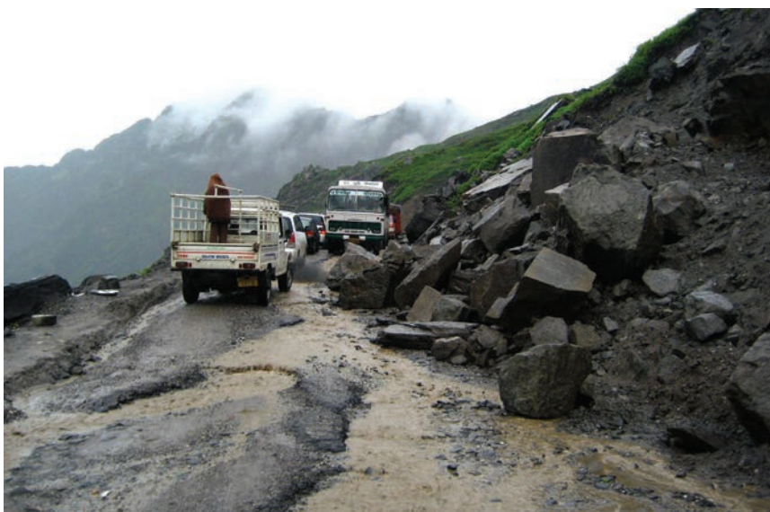
Pogled na cestu preko prijevoja Rohtang