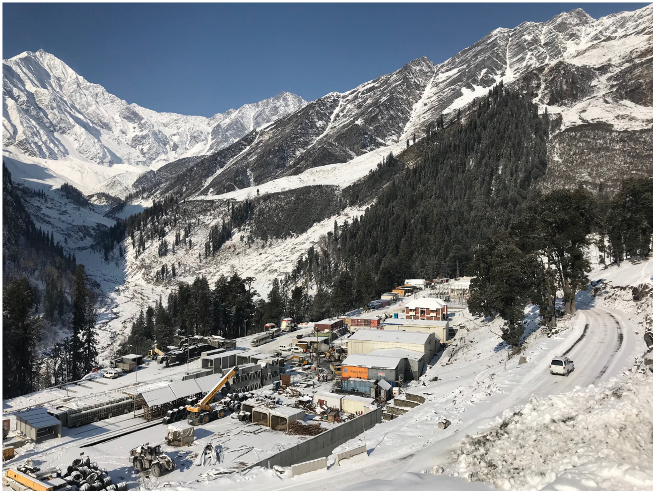
Postrojenje za proizvodnju predgotovljenih betonskih elemenata na gradilištu

a građeni su predgotovljenim betonskim elementima.