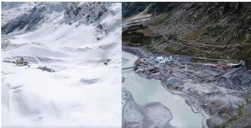
Gradilište sjevernog portala tunela u zimskim (lijevo) i ljetnim mjesecima (desno)

nje na terenu je bilo i do tisuću radnika. Relativno čest zdravstveni problem velikog broja radnika bio je povišeni krvni tlak uzrokovan manjkom kisika na tako velikoj nadmorskoj visini. Neki od njih su zbog toga morali biti udaljeni s gradilišta. Zanimljivo je to da te zdravstvene poteškoće nisu imali samo radnici koji su na gradilište stigli iz Europe, već i indijski radnici koji su na teren stigli iz drugih, nižih krajeva te zemlje.