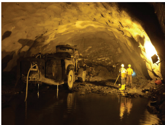
Detalj s gradilišta

Kada se kaže opasan pothvat, ponajprije se misli na složene radne uvjete s kojima su se susreli radnici na terenu. U neposrednoj blizini sjevernog i južnog portala tunela izgrađene su zgrade u kojima je bio smješten dio radnika, a ostalima je smještaj bio osiguran u obližnjim mjestima, odakle su ih autobusi prevozili do gradilišta. U pojedinim fazama grad-