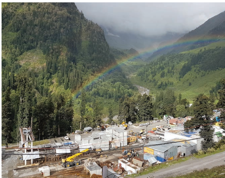
Pogled na gradilište u blizini južnog portala tunela

Presjek tunela ima oblik potkove (engl. horseshoe ), a portali tunela (sjeverni i južni) podijeljeni su na tri glavna dijela: tjemeni svod (engl. heading ), upornjak (engl. benching ) i podnožni svod (engl. invert ). Početak radova na južnome portalu započeo je u kolovozu 2010., a na sjevernome u listopadu iste godine. S obzirom na