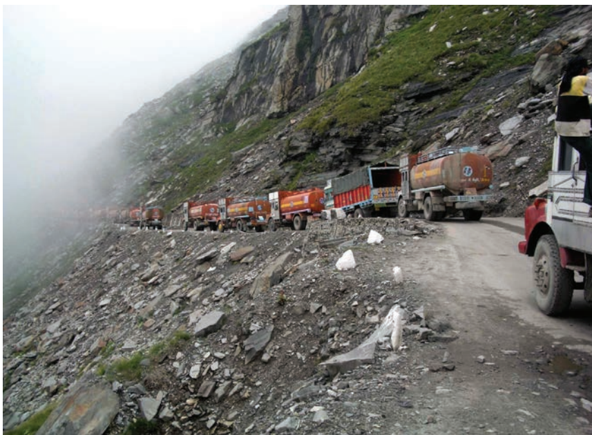
Opskrba zabačenih sela zalihama hrane traje od lipnja do rujna

Prijelaz Rohtang nalazi se na sjeveroistoku Indije, na visini od 4000 metara u himalajskome gorju, a povezuje dolinu Kullu s dolinama Lahaul i Spiti. Svake godine indijska služba za održavanje ceste Boarder Roads Organization koristi se