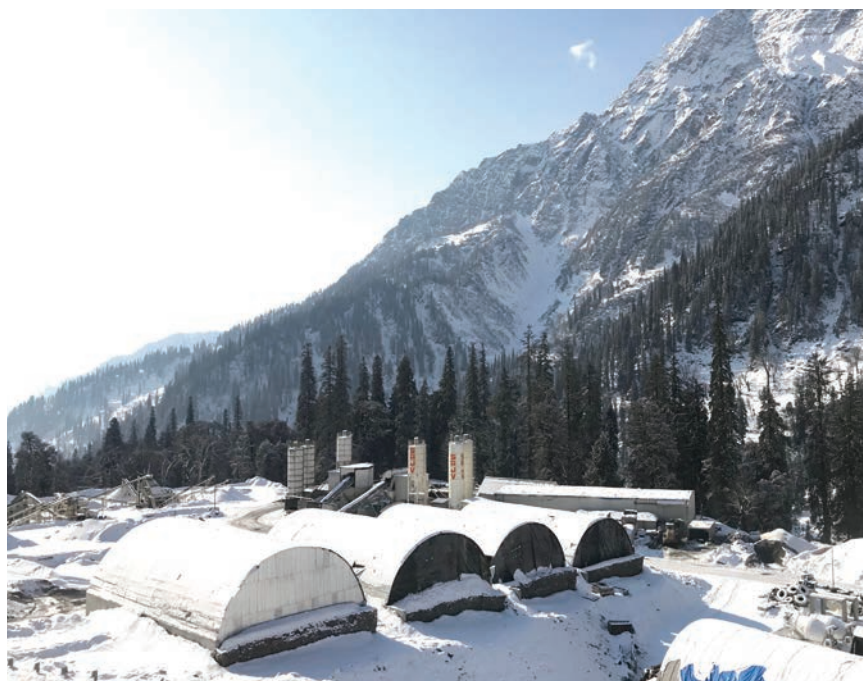
Dio gradilišta snimljen u siječnju 2018.

Himalaj je nastala (i još uvijek raste) sudarom indijske tektonske ploče s euroazijskom. S obzirom na to da je to po-