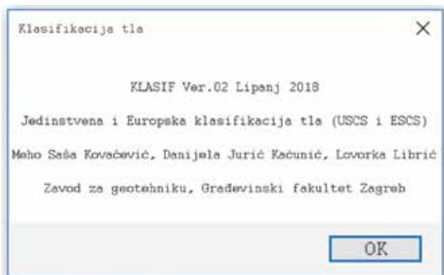
Slika 2. Program KLASIF ver.02

Da bi se uzele u obzir novosti u identificiranju i opisivanju tla prema europskoj normi EN ISO 14688-1:2018 te promjene u načelima za klasifikaciju tla prema europskoj normi EN ISO 14688-2:2018, razvijena je nova verzija računalnog programa KLASIF ver.02 (slika 2.).