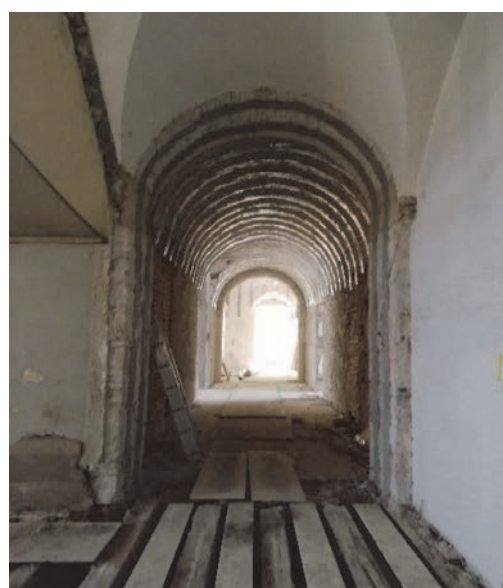
Radovi u Palači Šećerane