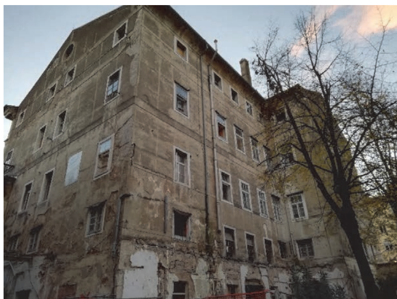
Pročelje Palače Šećerane prije obnove

Brod Galeb je od 2009. u vlasništvu Grada Rijeke i od tada postoji ideja o njegovoj obnovi i ponovnome stavljanju u funkciju. Izgrađen je 1938. kao RAMB III., talijanski trgovački brod za prijevoz