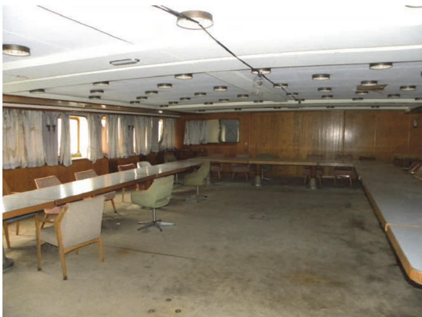
Glavni salon na brodu Galeb prije obnove

Metodologija projekata revitalizacije nasljeđa u gradskome vlasništvu provjerena je i uvelike se oslanja na apliciranje na razne EU-ove fondove, primjerice projekt Forget Heritage