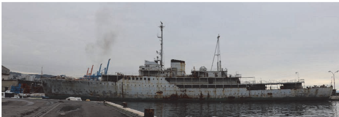
Brod Galeb u luci Porti Baroš krajem 2018.

sirovina iz talijanskih kolonija u Africi, no nedugo potom postaje pomoćna krstarica ondašnje talijanske ratne mornarice [16]. S izlaskom Italije iz rata 1943. brod preuzima njemački Kriegsmarine koji ga dorađuje i prerađuje za svoje potrebe, pretvarajući ga u minopolagač pod nazivom Kiebitz . Brod je sudjelovao u ratnim operacijama u Kvarnerskome primorju do studenoga 1944. kada je potopljen u Rijeci tijekom savezničkog bombardiranja njemačke vojske u gradu. Po završetku rata, godine 1948. izvađen je iz mora te odtegljen u pulsko brodogradilište na obnovu. Već u rujnu 1952. svečano je isporučen Jugoslavenskoj ratnoj mornarici kao školski brod za obuku pitomaca [17]. Ipak, najpoznatija je njegova povezanost s putovanjima tadašnjega predsjednika Josipa Broza Tita. Predsjednik je Galebom oplovio mnogo milja, njime je plovio na neka od svojih najvećih i najvažnijih putovanja, šireći ideju mira Pokreta nesvrstanih i obilazeći zemlje članice pokreta. Nakon obnove dio paluba koristit će Muzej grada Rijeke kao izložbeni prostor, dok će dio imati komercijalnu namjenu.