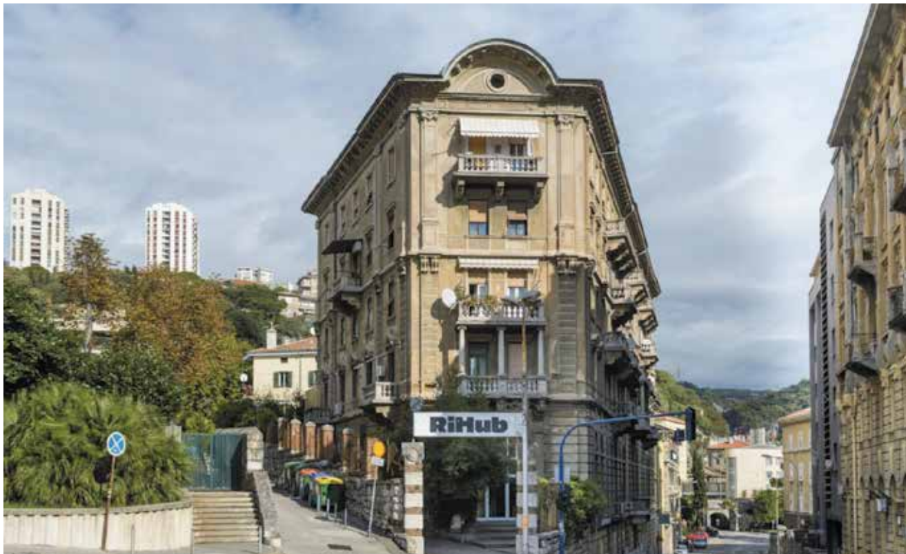
Djelomično revitaliziran Dječji vrtić Družbe sestara milosrdnica

izgrađen je 1916. prema projektu riječkog arhitekta Luigija Luppisa, no od druge polovine 20. stoljeća prostor je imao poslovnu namjenu. Tim projektom revitalizirana su dva prostora: podrumski za potrebe reuse -centra i prizemlje koje je preuređeno za potrebe RIHuba, inovativnoga kulturnog centra projekta "Rijeka 2020 - Europska prijestolnica kulture" [19].