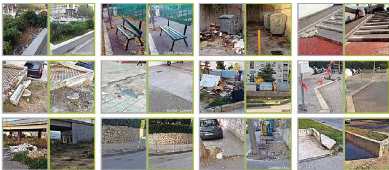
Primjeri manjih komunalnih i infrastrukturnih problema u gradovima diljem Hrvatske