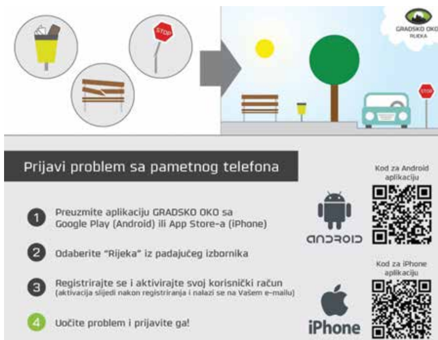
Prikaz sučelja aplikacije za rješavanje komunalne problematike u gradovima

Zaprima se najširi spektar komunalnih problema poput grafita i vandalizma, oštećenja asfalta, prometnih znakova i sprava na dječjim igralištima ili problema s javnom rasvjetom, olupinama vozila na javnim površinama, nepropisno odbačenim građevnim i komunalnim otpadom. Želja je da uz pomoć toga digitalnog sustava gradski odjeli za komunalni sustav, kroz partnerski odnos s građanima, unaprijede postojeći sustav rješavanja manjih komunalnih nepravilnosti.