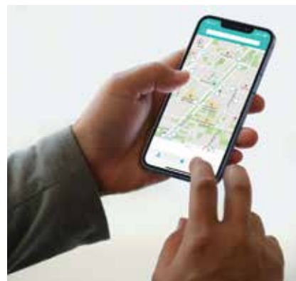
Digitalne aplikacije pomažu u povećanju kvalitete života u urbanim sredinama

Digitalna aplikacija nazvana Gradsko oko jest internetska platforma posvećena dvosmjernoj komunikaciji s građanima o pitanjima vezanima uz komunalnu problematiku u hrvatskim gradovima. Preko te besplatne aplikacije građani mogu prijavljivati različite komunalne probleme u sustav koji objedinjeno koriste sve nadležne institucije u gradovima.