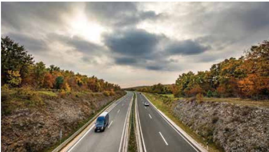
Istarski ipsilon jedan je od najprometnijih autocesta u Hrvatskoj

Dovršetakom prve faze toga projekta omogućena je povezanost Pule s Umagom i Rijekom. Druga faza realizirana je u rekordnome roku od dvije i pol godine, a okončana je puštanjem u promet prvih 100 kilometara autoceste u Istri. Zadnja faza projekta planira pretvaranje zadnjih kilometra Ipsilona u autocestu te izgradnju druge cijevi tunela Učka, čime će autocestom biti spojena relacija od Pule do Rijeka. U ovome prilogu prikazani su projekt izgradnje druge cijevi tunela Učka te neki izazovi u gradnji s kojima su se susreli inženjeri na gradilištu.