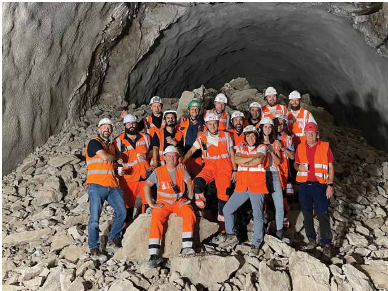
Tim inženjera snimljen u trenutku proboja tunela

metom i signalizacijom kako bi se postigli najviši standardi sigurnosti prometa u tunelu. Druga tunelska cijev tunela Učka trebala bi biti puštena u promet sredinom 2024.