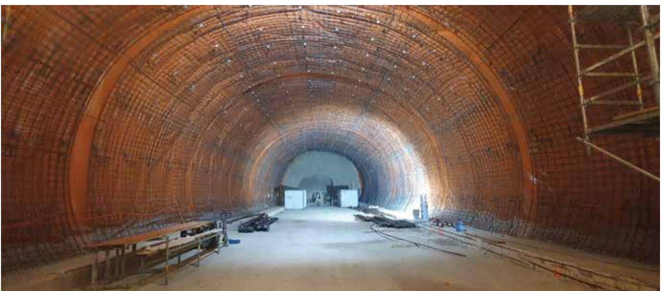
Sekundarna podgrada tunela

Nakon bušenja stijene i odvoza iskopanog materijala iz tunela na odlagalište pristupa se izgradnji primarne podgrade