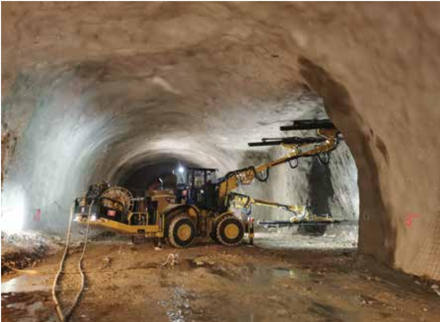
Automatizirana Jumbo bušilica s tri ruke

da je stijenska masa tunela ugrađena u cjelokupnu nosivu strukturu i stijena se aktivira na nosivi prsten oko tunela.