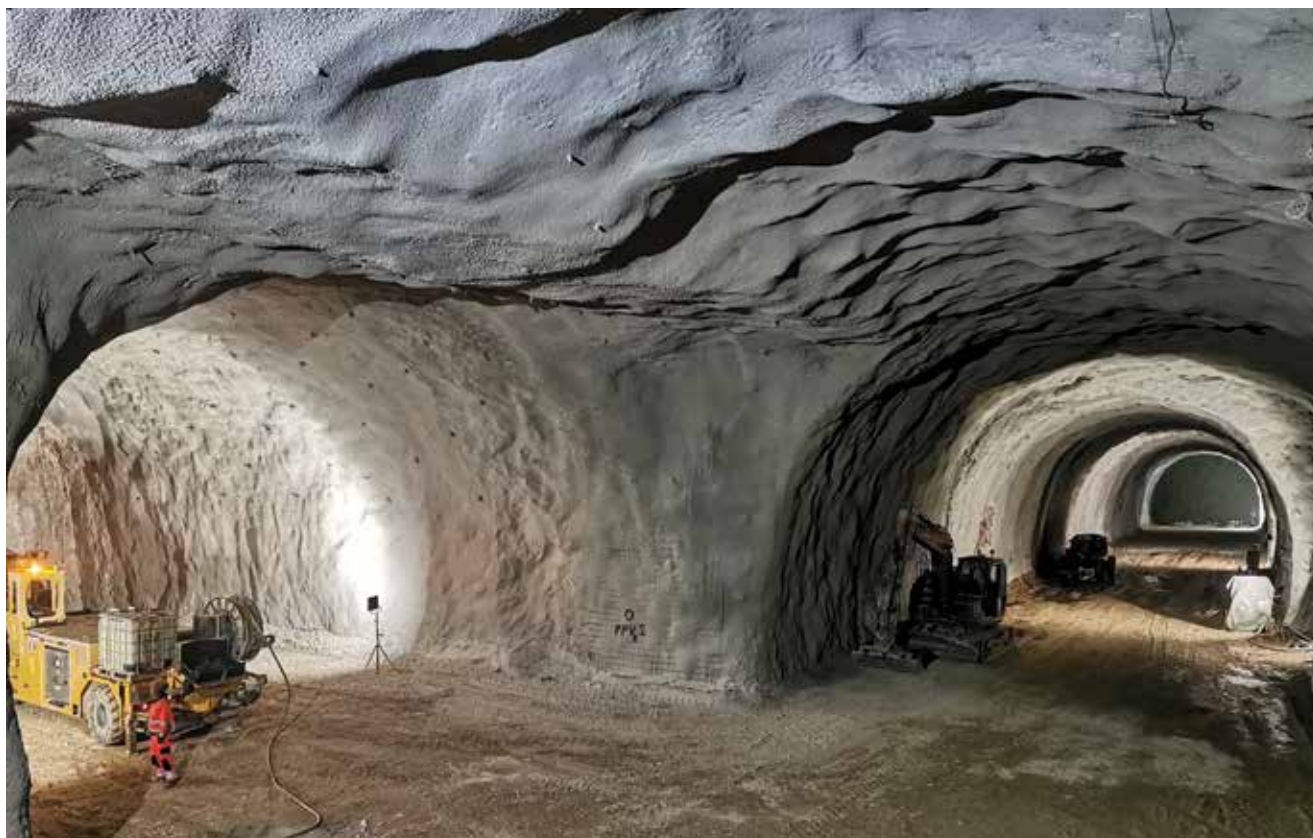
Pogled na gradilište spojnih tunela

tunela. Primarna podgrada tunela ovisi o vrsti tla u prokopu pa se kombiniraju tehnike prskanog (tzv. torkret) betona (C24/30 debljine od pet do 20 cm) i mikroarmiranoga mlaznog betona (C24/30 ojačan polipropilenskim vlaknima [4 kg/m 3 ]) te ugradnje sidara (Swellex i injektirana sidra), armaturne mreže i rešetkastih nosača. Između primarne podgrade i obloge tunela postavlja se sloj hidroizolacije od PVC folije zaštićene geotekstilom. Izolacija tunela predviđena je po cijeloj dužini tunela, i to po cijeloj kaloti i bokovima tunela, a izvodi se nakon iskopa i primarnog osiguranja tunela te nakon smirivanja eventualno zabilježениh pomaka u primarnoj oblozi tunelske cijevi. Obloga tunela izvodi se od betona C 25/30 minimalne debljine 30 centimetara.