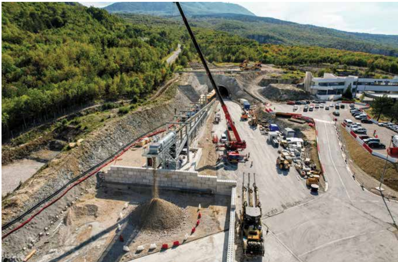
Pogled na gradilište druge cijevi tunela Učka

obilnih kiša, što je rezultiralo snažnim i obilnim prodiranjem vode u tunel. Količina vode bila je toliko velika da je vrlo brzo poplavila čitavu, već iskopanu sekciju tunela s kvarnerske strane, dosežući visinu višu od jednoga metra. Kada se voda počela povlačiti, inženjeri su pregledali kavernu i predložili da se ta pukotina zatvori, ali i da se na nju postave posebna nepropusna vrata kako bi mogli podrobnije istražiti o čemu je riječ. U nizu istraživanja podzemnoga sustava u utrobi Učke ukupno je istraženo više od kilometar i pol podzemnih dvorana i prolaza, kroz koje su najvećim dijelom tekle podzemne vode, i to u znatnim količinama, pa su speleolozi često morali i roniti. Kada su uspjeli stvoriti sliku cijelog tog podzemnog sustava, utvrdili su da se pruža otprilike okomito na cijev tunela, u smjeru od jugozapada prema sjeveroistoku, na različitim visinama. Ukupna visinska razlika u do sada istraženim dijelovima je veća od četristo metara. Tijekom istraživanja i kartiranja same podzemne mreže