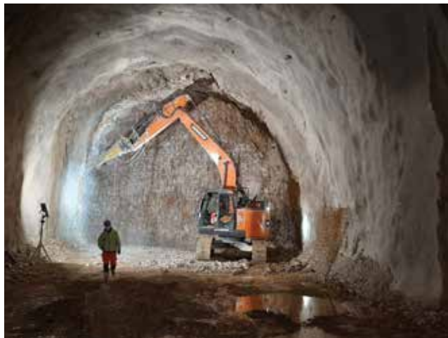
Građevinska mehanizacija korištena za iskop i podgrađivanje tunela