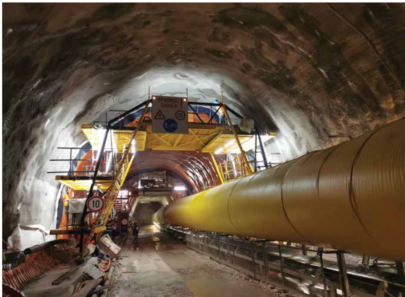
Pogled na ventilacijski sustav na gradilištu tunela

i spušenim stropom, što implicira primjenu poprečnoga ili polupoprečnoga sustava ventilacije. Međutim, postojeći tuneli već koriste uzdužnu ventilaciju za redoviti rad i zaštitu od požara. Primjena poprečnoga sustava ventilacije u postojećim cijevima tunela stvara tehničke probleme i visoke materijalne troškove jer zahtijeva povećanje presjeka cijevi i izgradnju spušenoga stropa s kanalom za zrak. Iako poprečna ventilacija može biti korisna za izvlačenje dima u kasnijim fazama požarnoga incidenta, u početnoj fazi požara i pri prelasku sustava iz redovitoga u požarni režim uzdužna ventilacija pokazala se superiornijom. Analizom rizika prema austrijskoj metodi TuRisMO (engl. Tunnel Risk Assessment Model ), koju je izradila austrijska tvrtka ILF Consulting Engineers , utvrđeno je da je primjena uzdužne ventilacije dovoljno sigurna za tunel Učka, odnosno s niskim