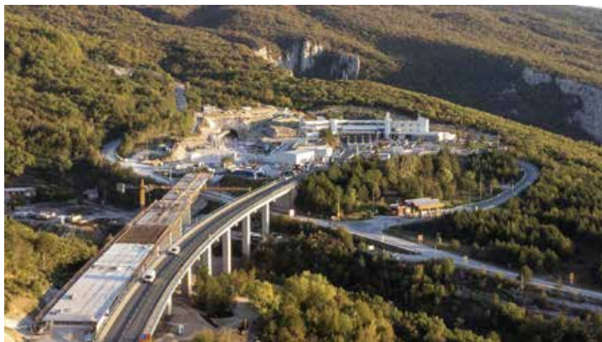
Pogled na gradilište iz zračne perspektive

Matulja uz dovršetak punoga profila na sjeverozapadnome kraku Ipsilona, odnosno vijadukta Limska draga i mosta preko Mirne. Komisija je ispitala plan u