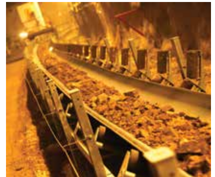
Transportna traka za izvoz iskopanog materijala

oniranje mjesta za bušotine, korišten je laser. Dubine bušotina iznosile su između 1,0 i 5,8 metara. U njih je postavljan eksploziv za miniranje stijenske mase. Za odvoz iskopanog materijala izvan tunela korišteni su tunelski utovarivač Sandvik, drobilica i traka za izvoz materijala, koja je omogućila kontinuirano izvođenje materijala čak i tijekom betoniranja sekundarne obloge, što je smanjilo zastoje i optimiralo rad na tunelu. Zahvaljujući konstantnoj količini odvoza materijala u jedinici vremena od otprilike 300 tona na sat, traka je poslužila kao vrlo učinkovito rješenje u odnosu na odvoz materijala drugim vozilima na gradilištu.