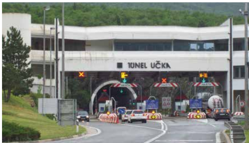
Pogled na zapadni portal tunela Učka

Od ideje do konačne realizacije tunela Učka proteklo je mnogo vremena. Uloženi su velik trud i angažman stručnjaka raznih profila: urbanista, ekonomista, projektanata, izvođača, ali i svih onih građana čiji je zajednički san bio povezivanje Istre s Rijekom odnosno s hrvatskim zaleđem. Prve aktivnosti na organizaciji izgradnje započele su sedamdesetih godina prošloga stoljeća kada je Istarska zajednica općina osnovala Koordinacijski odbor za izgradnju tunela te organizirala raspisivanje javnoga zajma za osiguranje financijskih sredstava. Osnovano je i poduzeće Učka iz Pazina sa zadaćom da pripremi dokumentaciju za izgradnju tunela Učka. Projekt tunela izradio je Institut IGH d.d., a gradile su ga tvrtke Hidroelektra i Konstruktor. Bio je to vrlo složen i zahtjevan građevinski poduhvat koji je zahtijevao inženjersku dovtljivost. Najveće iznenađenje prilikom iskopa prve cijevi tunela Učka dogodilo se u srpnju 1977., kada su izvođači stigli na 1850 metara od ulaza s kvarnerske strane, gdje se pojavila pukotina kroz koju je počela nadržati voda. To se dogodilo nakon razdoblja