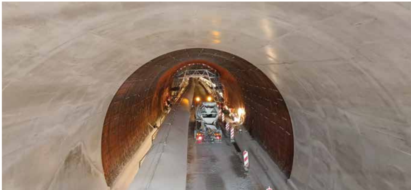
Gradilište tunela snimljeno u rujnu 2023.

skladu s pravilima EU-a o državnoj potpori za usluge od općega gospodarskog interesa, koja državama članicama, pod određenim uvjetima, dopuštaju kompenzaciju tvrtkama kojima su povjerene obveze javnih usluga za dodatne troškove pružanja tih usluga, kao i s pravilima EU-a o javnoj nabavi, posebnoj Direktivi EU-a o dodjeli ugovora o koncesiji.