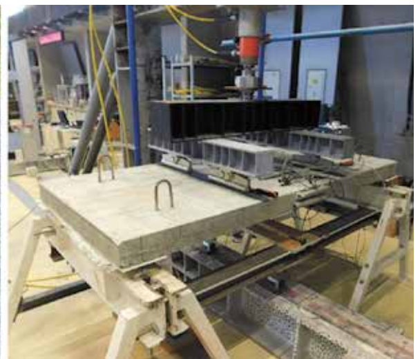
Ploča ispitana na proboj (lijevo) i statičko ispitivanje ploče (desno)