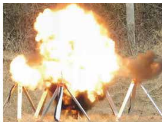
Postav instrumenata za prvu fazu eksperimenta (lijevo) i vatrena kugla (engl. blast fireball) nakon detonacije (desno)