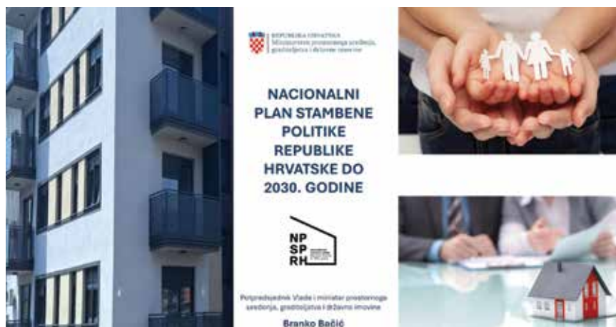
Predstavljeni su ciljevi Nacionalnog plana stambene politike

Nacionalni plan stambene politike također uključuje donošenje jednostavnije i brže procedure za gradnju obiteljskih kuća u ruralnim područjima. Procjenjuje se da će za provedbu Nacionalnog plana stambene politike trebati osigurati 1,2 milijarde eura. "A za provedbu svega", istaknuo je Ministar, "neophodno je osnovati revolving fond iz kojeg će se financirati cjelokupni Nacionalni plan". U fond će se ulagati sredstva iz Državnog proračuna,