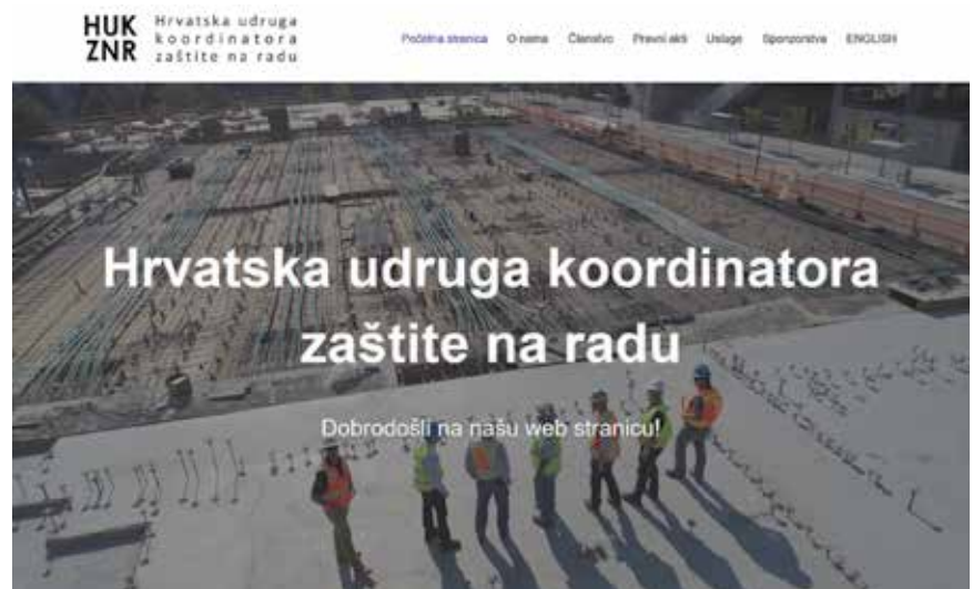
Naslovnica mrežne stranice Hrvatske udruge koordinatora zaštite na radu

Hrvatska udruga koordinatora zaštite na radu