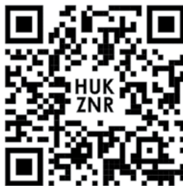
QR kod za mrežnu stranicu Udruge

mjera zaštite na radu. Metode planiranja i kontrole provođenja mjera zaštite na radu postoje, no one se ne provode dosljedno. S jedne strane broj inspektora zaštite na radu relativno je malen da bi mogli aktivno kontrolirati gradilišta, a s druge strane koordinatori zaštite na radu, čija uloga također podrazumijeva kontrolu, često nisu u mogućnosti obavljati svoje dužnosti. Za dio razloga kriva je okolina, ali i sami koordinatori.