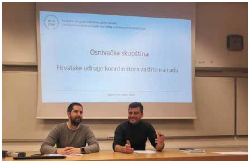
Osnivačka skupština Hrvatske udruge koordinatora zaštite na radu