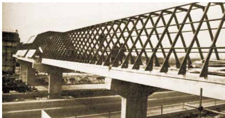
Čelična konstrukcija prijelaza preko autoceste

je Borisa Baničeka). Ujedno je navedeno da je cijeli kompleks stajao 62 milijarde ondašnjih jugoslavenskih dinara. Taj podatak ipak zbunjuje jer to je vrijeme zahuktavanja velike inflacije kada je dolar krajem 1983. vrijedio 125,35 dinara, a krajem 1984. već 203,32 (podaci su pouzdani samo za kraj godine), što bi početkom 1984., kada je kompleks i otvoren, bilo čak 494,62 milijuna dolara, a krajem 1984. godine 304,94 milijuna. Kako znamo da je ondašnji dolar bio približno triput vredniji nego danas, bilo bi to nezamislivih 1483,86 milijuna dolara (gotovo milijardu i pol) na početku, a 914,82 milijuna dolara na kraju godine odnosno više od milijardu današnjih eura na početku, odnosno 653,44 milijuna eura na kraju 1984. Dakle stvarna bi cijena bila između tih iznosa (porast vjerojatno nije bio linearan već skokovit), što se čini uistinu previsokim. Naime ako napravimo usporedbu s Arene centrom u Zagrebu, koji je proradio krajem 2010. i stajao nešto više od 350 milijuna eura, možemo zaključiti da ni kompleks Plitvice u Lučkom nije mogao stajati više, a to bi značilo najviše tridesetak milijardi ondašnjih dinara. Možda se novinar zabunio ili mu je netko nehotice ili s namjerom dao krivi podatak. No valja imati na umu da su onda postojale tzv. klizne skale kojima su se sudionici u građenju pokušavali zaštititi od prekomjerne inflacije, što je vjerojatno poskupljivalo svaku investiciju, a može biti i to da su cijene građevinskih radova i materijala danas ipak niže.