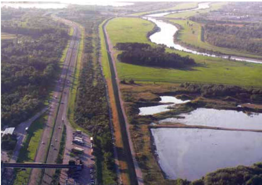
Dio kompleksa i okolice viđen iz zraka