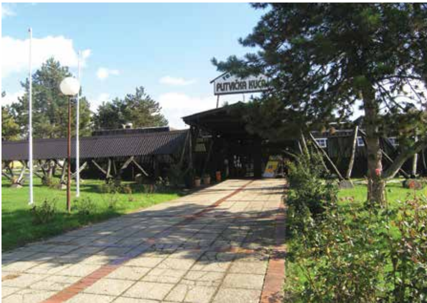
Poznati restoran Plitvička kuća

Obišli smo cijeli kompleks i uočili nekoliko kampera kao i gostiju u motelu. Nekad vrlo popularni i cijenjeni restoran Plitvička kuća zjapio je prazan, ali su nas uvjerali da obično ima dosta gostiju, posebno navečer. Primijetili smo da se vozači ipak dosta često zadržavaju, najčešće zbog goriva.