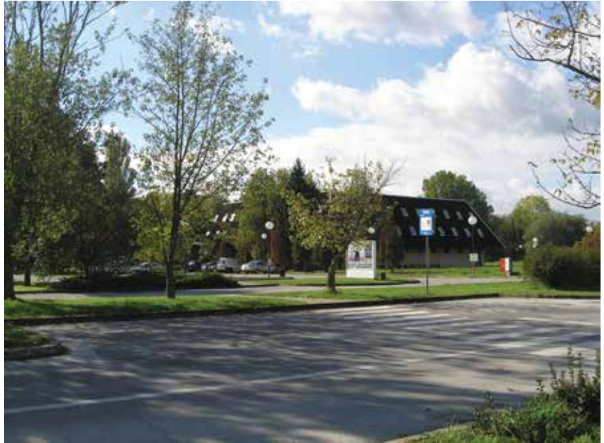
Motel u sastavu kompleksa

Nedavno smo posjetili motel Plitvice i bili pomalo zadivljeni veličinom i stilskom čistoćom cijelog kompleksa smještenog južno od Save i mnogobrojnim okolnim jezerima Šoderica Blato. Sve su građevine u kompleksu Plitvice , uključujući i vijadukt, većim dijelom obložene tamnim drvom, ali se čini, ili je to samo