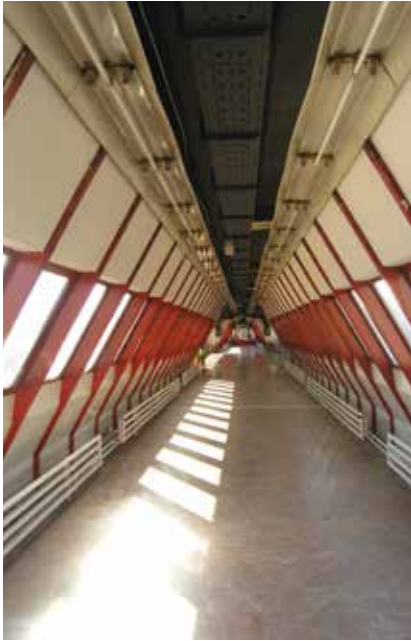
Unutrašnjost prijelaza preko autoceste