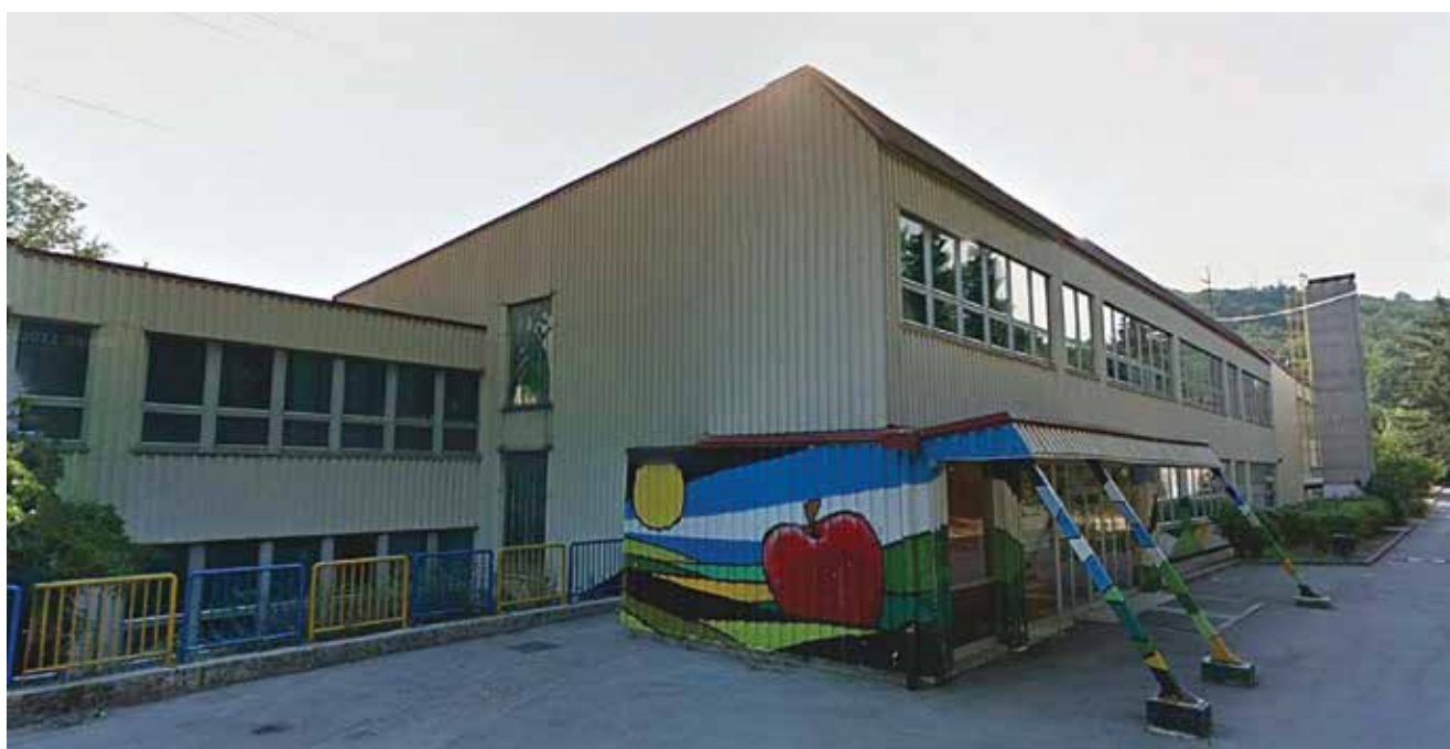
Zgrada Osnovne škole Ivan Zajc na Škurinjama u Rijeci