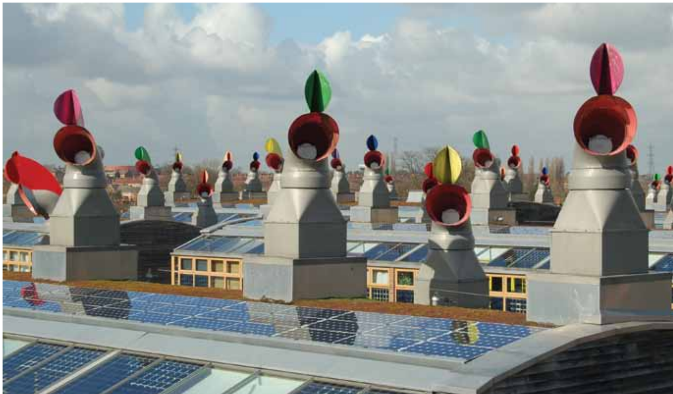
"Hvatači vjetra" za prirodnu ventilaciju stanova i poslovnih prostora - prepoznatljiva slika BedZED-a

BedZED ima posebna postrojenja za pročišćavanje vode, a postoji i zasebna elektrana koja upotrebljava drveni otpad u kombinaciji sa sunčanim kolektorima kojih je na krovovima naselja ugrađeno 770 m 2 . Iako je elektrana u stanju zadovolji potražnju cijelog naselja, troškovi i osoblje za održavanje izolirane energetske stanice takve veličine mogu ipak biti previsoki. Stoga će se taj problem pokušati prevladati tako da se obje tehnologije počnu upotrebljavati u cijelom južnom dijelu Londona. Za grijanje se vode upotrebljavala i biomasa, a spremnici su tople vode trebali zadovoljiti zahtjeve i za najveću dnevnu potrošnju jer je za grijanje potrebno vrlo malo energije. Radi se naime o niskoenergijskim građevinama (najveća potrošnja 30 kWh/m 2 na godinu) pa elektrana opskrbljuje naselje samo električnom energijom, a najčešće je isporučuje u električnu mrežu.