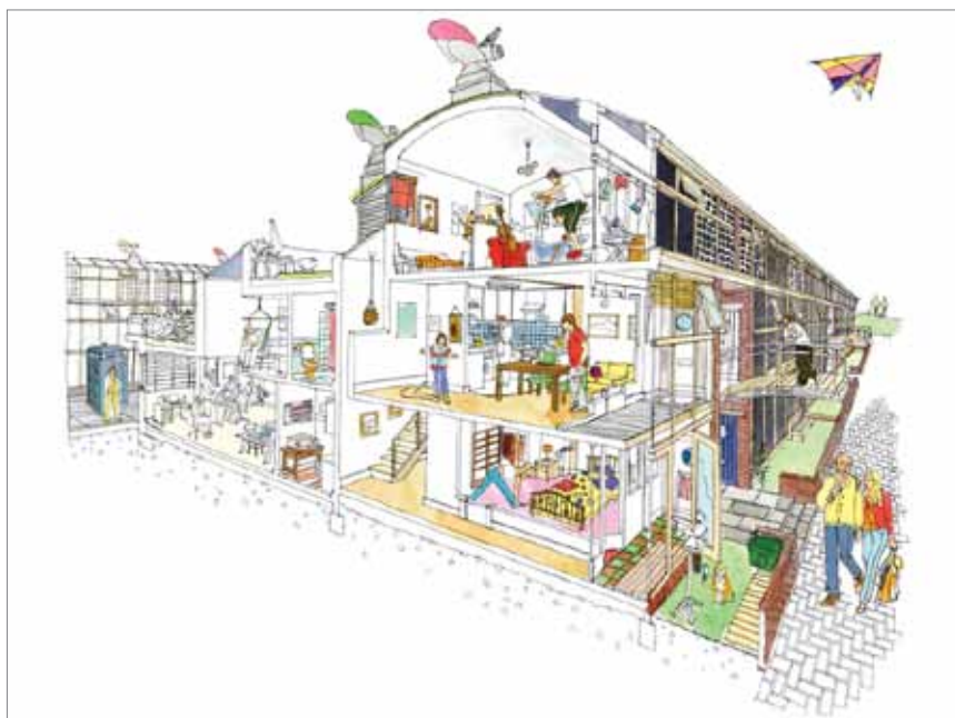
Karakterističan presjek stambene jedinice

obiteljskih kuća te jednosobnih i dvosobnih stanova uzrokovao raznolik i raznovrsnu zajednicu koja se prilagođuje položaju planiranom u prostornoj dokumentaciji i organizaciji prostora. Pritom se radni prostor može dodatno dijeliti u manje sobe od kojih svaka ima svoja ulazna ulična vrata ili se rušenjem zidova spojiti u velike radne prostore duž cijele terase, s dovoljno radnih mjesta za trideset do četrdeset ljudi. To je pridonijelo tome da su se i male i srednje tvrtke integrirale u ovu zajednicu.