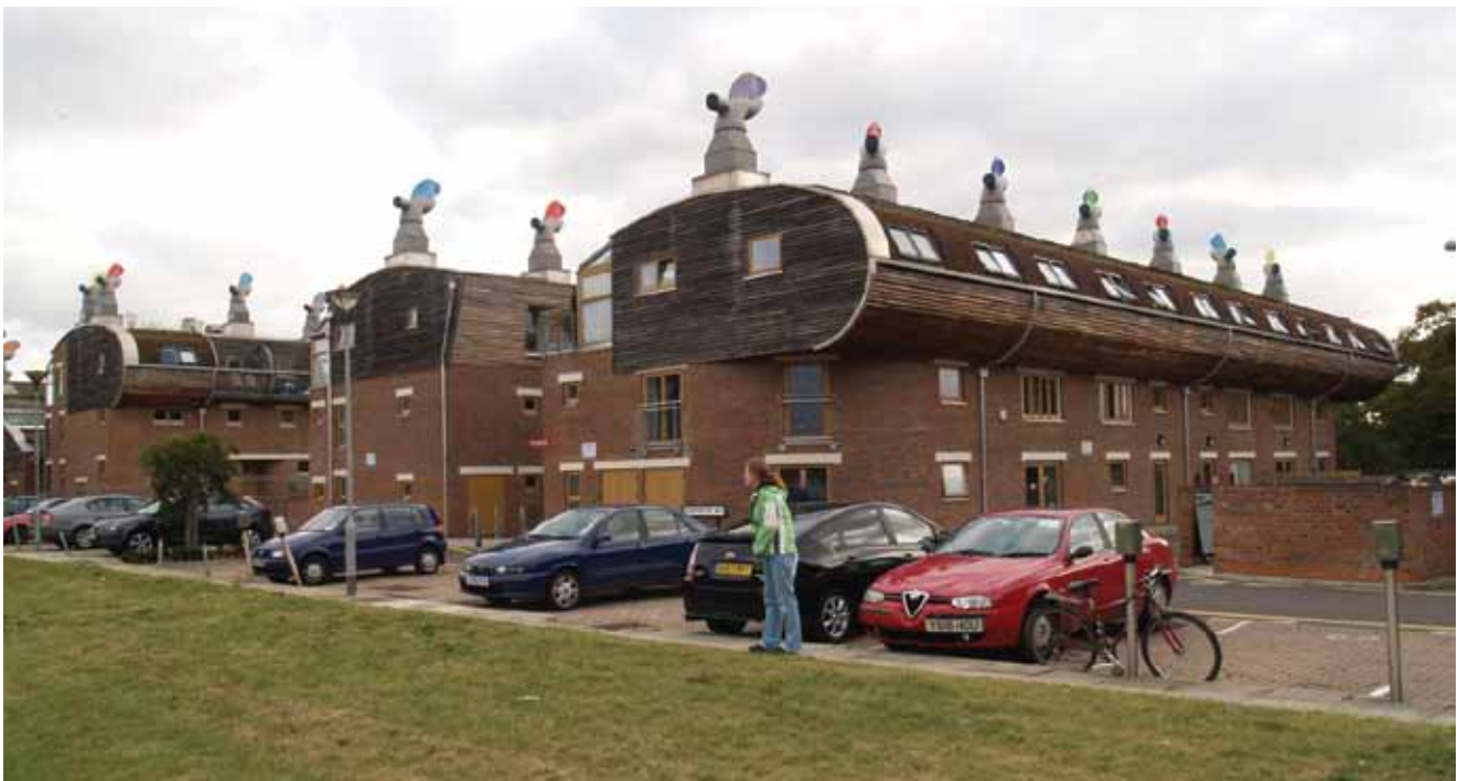
Parkirališta imaju uređaje za punjenje električnih automobila.

Stoga je projekt BedZED, zapravo, izravno utjecao i na sve veće gradove u Velikoj Britaniji.