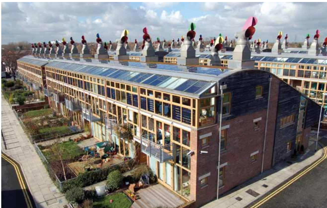
BedZED - najveće stambeno naselje u Velikoj Britaniji nultoga energetskega razreda

razliku od "greenfield" projekta koji se odnosi na novogradnje). Investitor Peabody Trust je uz pomoć konzultantske kuće Ellis & Moore Consulting Engineers u izradi projektne dokumentacije osim s tvrtkom Bill Dunster Architects (sada Zed Factory ) surađivao i s drugim poznatim britanskim projektantskim biroima, kao što su BioRegional i Arup . Slobodno se može reći da je BedZED postavio nove standarde u održivoj gradnji. To je zasad dom za približno 220 stanovnika koji žive u ukupno 82 stambene jedinice (jednoetažnim i dvoetažnim stanovima te obiteljskim kućama), a u naselju je i gotovo 2500 m 2 radnih uredskih prostora. Riječ je o posebnom urbanom sustavu koji na-