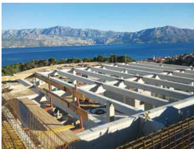
Prva montažna okvirna konstrukcija od stupova i nosača

sječne visine 8,3 m, a omeđena je dilatacijama D1, D4 i D6. Taj je dio građevine namijenjen prostorima kotlovnice, strojnarnice hladnjače, prostorima mehaničke radionice te prostorima za održavanje ribarskih mreža. Predviđena je montažna armiranobetonska konstrukcija s dvostrešnim laganim limenim krovom i vanjskom oblogom od armiranobetonskih troslojnih panela, dakle kao kod D2 i D3. Posljednja je šesta dilatacija tlocrtnih dimenzija 50,5 x 28,7 m i prosječne visine 9,3 m, a smještena uz dilataciju D1. U tom su prostoru predviđeni hladnjača i tunel za smrzavanje. Montažna krovna konstrukcija izvest će se od armiranobetonskih primarnih i sekundarnih nosača T presjeka pokrivenih limom, a vanjska je obloga predviđena od armiranobetonskih troslojnih panela, dakle isto kao D2 i D3.