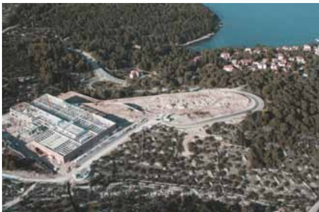
Gradilište nove tvornice u Postirama snimljeno iz zraka

Brač je s površinom od 395,4 km 2 treći po veličini hrvatski otok (iza Cres i Krka) i najveći dalmatinski. Na otoku prema rezultatima popisa i živi 13.996 stanovnika koji su raspoređeni u čak osam jedinica lokalne samouprave. Po broju je stanovnika najveći grad Supetar (4096), a najmanja općina Sutivan (822) koja je i najmanja po površini (22,19 km 2 ), dok su najveća Pučišća (103,37 km 2 ). Prosječna je gustoća naseljenosti 35,4 st./km 2 , što je znatno manje od Splitsko-dalmatinske županije (108,2 st./km 2 ). Valja istaknuti da sve bračke jedinice lokalne samouprave zbog blizine kopna i Splita kao velikog središta te dobre prometne povezanosti prema Indeksu razvijenosti gradova općina svrstane od III. do V. kategorije. Najbolji su Sutivan (131,24 %) i Bol (126,32 %), dok su Supetar i Milna u IV. (100 - 125 %), a svi ostali u III. kategoriji (75 - 100 %).