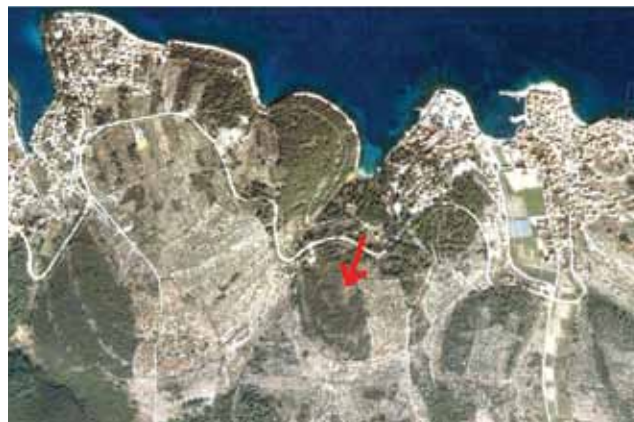
Položaj Gospodarske zone Ratac u Postirama