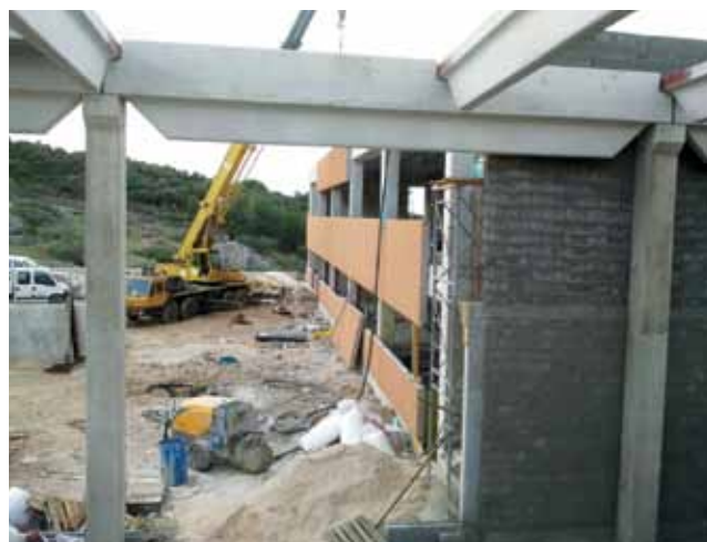
Postavljanje prvih horizontalnih troslojnih panela