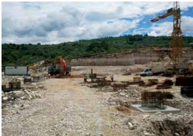
Prvi građevinski zahvati na očišćenom platou za novu tvornicu