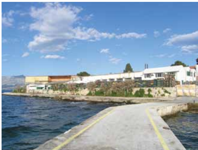
Stari pogoni tvornice sardina u Postirama

Nismo odoljeli da našeg sugovornika ne upitamo o razlozima propasti toliko tvornica sardina. Dobili smo odgovor da je svaki slučaj drugačiji, ali da se uglavnom radilo o lošem menadžmentu. Kada su u Sardini ustanovili da se ne može živjeti samo od konzervi okrenuli su se uzgoju ribe s južne strane otoka Brača na području općina Milna i Nerežišća. Najprije su se počeli baviti uzgojem komarče ili orade ( Sparus aurata ) i lubina ( Dicentrarchus labrax ), a potom i uzgojem domaće tune ( Thunnus thynnus ) odnosno plavorepe atlantske tune koja se lovi i potom hrani domaćom sardelom i drugom ulovljenom plavom ribom. Ribogojilišta imaju na južnoj strani otoka Brača u uvalama Maslinova, Grška i Smrika. Ukupna je proizvodnja na godinu približno 3000 tona ili više od 20 milijuna konzervi, 200 tona ribljeg brašna, 500 tona visokokvalitetne bijele ribe i 700 tona plavoperajne tune iz uzgoja. Kvalitetnu jadransku sardelu ( Sardina pilchardus ) i drugu sitnu i krupnu plavu ribu love vlastitom flotom ili otkupljuju od kooperanata iz svih dijelova Jadrana. Danas zapošljavaju 286 radnika.