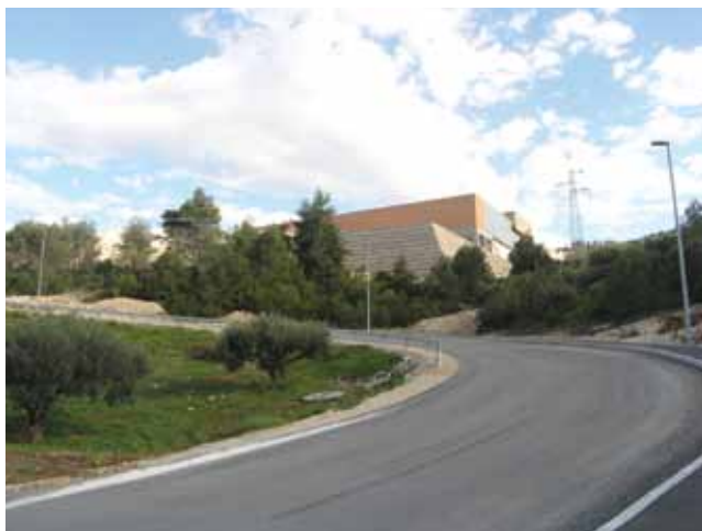
Gabionska zaštita Gospodarske zone Ratac