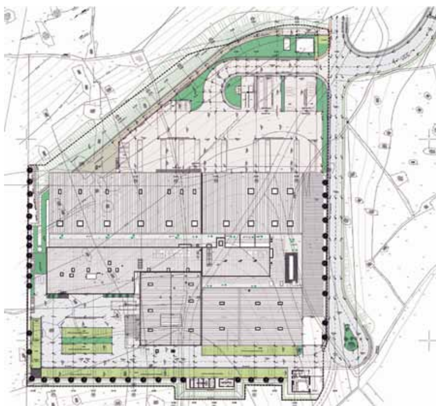
Situacija nove tvornice

Trivium d.o.o. iz Splita (projektant Miroslav Jakovčić, dipl. ing. građ.), a projekte kabelskog raspleta i transformatorske stanice biro Posebni projekti d.o.o. iz Splita (projektant mr. sc. Juraj Buzolić). Za vodoopskrbu poslovne zone predviđen je dijelom ukopani vodospremnik zapremine 250 m 3 na brdskoj padini iznad naselja na posebnom platou s pristupnim putem. Vodoopskrba i odvodnja gospodarske zone uključuje opskrbni vodovod dug 1078,3 m koji započinje od vodospremnika i spaja se na postojeći vodovod u mjestu, a ukupna je duljina kanalizacije 505,35 m i predviđen je spoj na postojeći kanalizacijski sustav u Postirama.