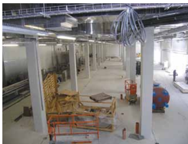
Jedna od budućih hala za proizvodnju ribljih konzerva