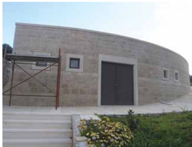
Nova mrtvačnica na groblju u Postirama