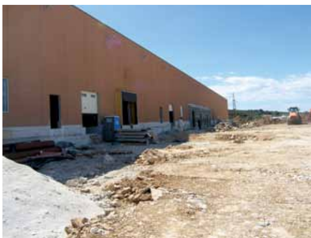
Buduće sjeverno pročelje nove tvornice