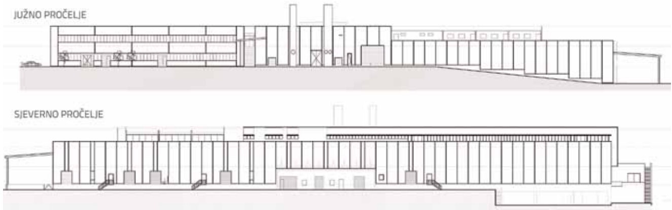
Crtež budućega južnog i sjevernog pročelja tvornice