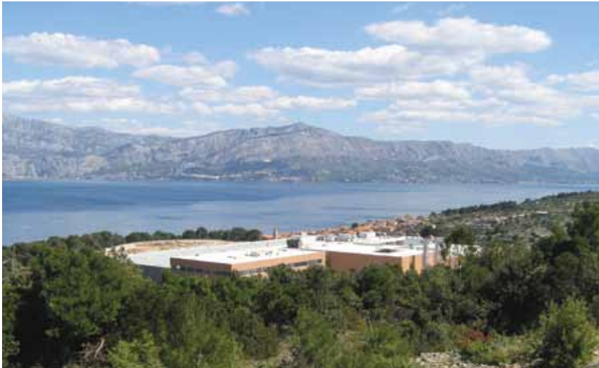
Nova tvornica i Postira snimljeni s novog vodospremnika

Nakon posjeta gradilištu iskoristili smo prigodu da temeljito razgledamo cijelo mjesto. Obišli smo i izvana poslikali stare tvorničke pogone, ali i neobičan plavičasti hotel Pastura nadomak tvornice koji je zamijenio negdašnji Park . Neobičan je i hotel Lipa u negdašnjoj zgradi Poljoprivredne zadruge usred rive. Zgodno je pogledati rodnu kuću književnika Vladimira Nazora, ali i novi lukobran te stare ulice koje vode do župne crkve Sv. Ivana Krstitelja, a pokraj koje su 1988. otkriveni ostaci starokršćanske crkve iz 5. ili 6. st. Sve se doimlje nekako skladno i umiveno, ali najuočljivija je opća čistoća.