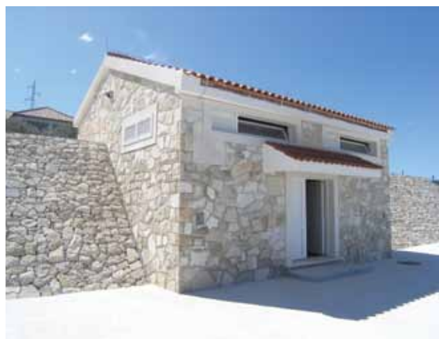
Zgrada novog vodospremnika iznad gospodarske zone