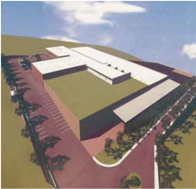
Prikaz budućeg izgleda nove tvornice u Postirama