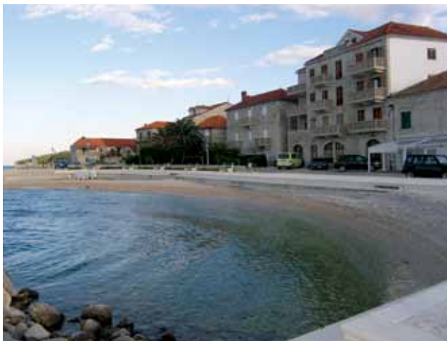
Kupalište uređeno iza novog lukobrana

Priča o neobičnom i učinkovitom postirskom načelniku posredno ima i jedan sportski začim. Naime njegov je sin Vatroslav Mihačić (drugi Hrvoje pomorski je časnik) bio vratar Hajduka i nastupio je u slavnoj pobjedi 8. svibnja 1991. u kup utakmici nad Crvenom zvezdom koja je krajem tog mjeseca postala europskim prvakom. Zahvaljujući toj pobjedi veliki 19 kg težak srebrni pehar maršala Tita zauvijek je ostao i vitrinama splitskog kluba. Bilo je to samo tjedan dana nakon pokolja hrvatskih policajaca u Borovu Selu, pa se Hajduk dugo nećkao hoće li uopće nastupiti. Trener Hajduka bio je Joško Skoblar, Crvene zvezde Ljupko Petrović, jedini je gol postigao Alen Bokšić, a u toj su gruboj utakmici bili isključeni Igor Štimac i Siniša Mihajlović, sadašnji izbornici Hrvatske i Srbije. Vatroslav Mihačić je sjajno branio, ali je zapamćen po tome što je tek nakon utakmice ustanovljeno