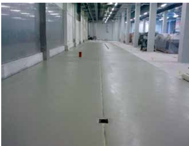
Izrada jednog poda s epoksidnom zaštitom

Spustili smo se nešto niže u Gospodarsku zonu Ratac i uočili da je osigurana zidovima od gabiona tako da se zaista doimlje lijepom i atraktivnom. U obilasku nove tvornice pridružio nam se