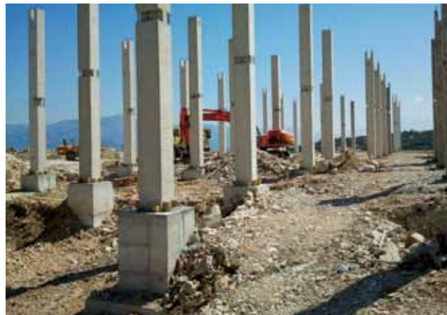
Postavljanje prvih montažnih armiranobetonskih stupova

zervi i riblje hrane, ali i pogon za proizvodnju i skladištenje ribljeg brašna. Konstruktivno je ta dilatacija istovjetna kao D2.