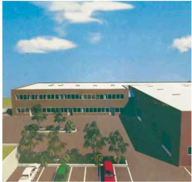
Detalj budućeg izgleda nove tvornice

U novom će i najsvremenijem pogonu jedini na ovim prostorima ribu smrzavati i skladištiti s pomoću ugljikova dioksida kao rashladnog medija, a investiciju su financirali iz vlastitih prihoda i zajma. Namjeravaju i obogatiti asortiman proizvodnjom riblje paštete te soljenjem i mariniranjem inčuna i sardele, ali i proizvodnjom ribljeg ulja. Nadalje, uskoro se planiraju početi baviti i uzgojem i plasmanom školjki. Imaju flotu od četiri broda za lov na plavu ribu i od toga su dva suvremena tunolovca opremljena za ribolov na Sredozemlju, ali i tri manja broda za potrebe ribogojilišta. Svu tunu uglavnom izvoze u Japan jer je vrlo cijenjena i stoga je najpogodnija za japanska nacionalna jela sashimi i suchi . Sadašnja su vlasnici Sardine d.o.o. Frane Gattin, Niko Bezmalinović i Davor Gabela.