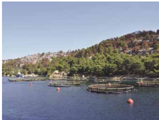
Uzgajalište tuna uz južnu obalu otoka Brača