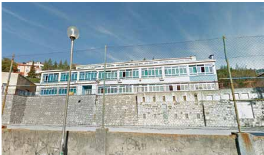
Sadašnja OŠ Škurinje u Rijeci

pločama i čeličnim limom. Rečeno je, između ostalog, kako će u toj hali raditi 260 radnika u dvije smjene i 140 radnica.