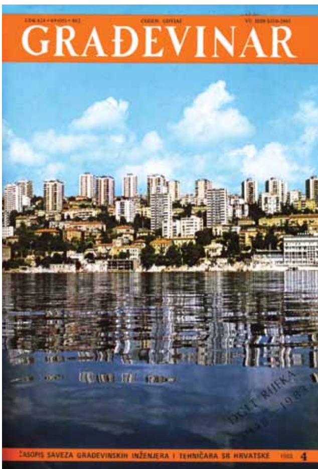
Naslovna stranica broja posvećenog obljetnici DGIT-a Rijeka

Svi su takvi posebni brojevi obično zadržali u cijelosti ustaljenu formu časopisa, pa su objavljeni i znanstveno-stručni članci, s tim da ih je ovaj put bilo pet umjesto uobičajena četiri. Prvi je bio pregledni rad ondašnjeg magistra, a danas profesora emeritusa Građevinskog fakulteta Sveučilišta u Rijeci Andrije Pragera pod naslovom Točnost proračuna nosača na elastičnoj podlozi . Zapravo razmatrana je točnost aproksimativnog proračuna metodom konačnih razlika Lagrangeove diferencijalne jednadžbe elastičnog nosača.