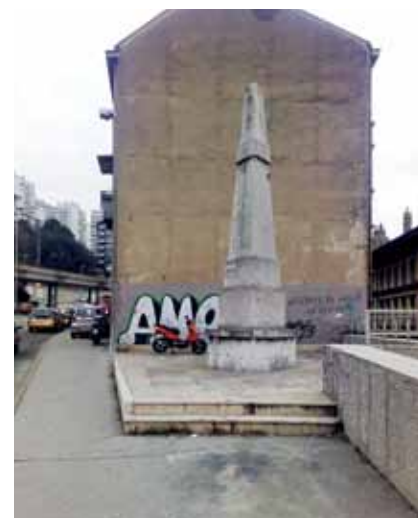
Premještena kamena piramida

predstaviti riječko građevinarstvo. Očito je da "ljubav" između novinara i građevinarstva nije od jučer. Ipak na kraju je dodano nekoliko podataka o gradilištu, pa doznajemo da se gradio željeznički nadvožnjak i cestovni podvožnjak te magistralna cesta, da je projektnu dokumentaciju izradio IPZ iz Zagreba, a da je izvođač bio riječki Konstruktor .