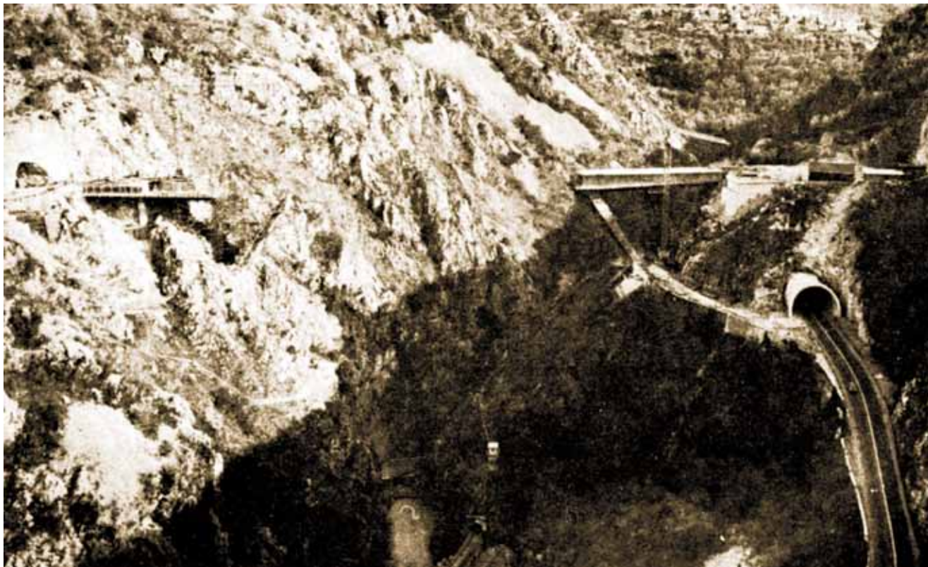
Početak gradnje mosta preko Rječine