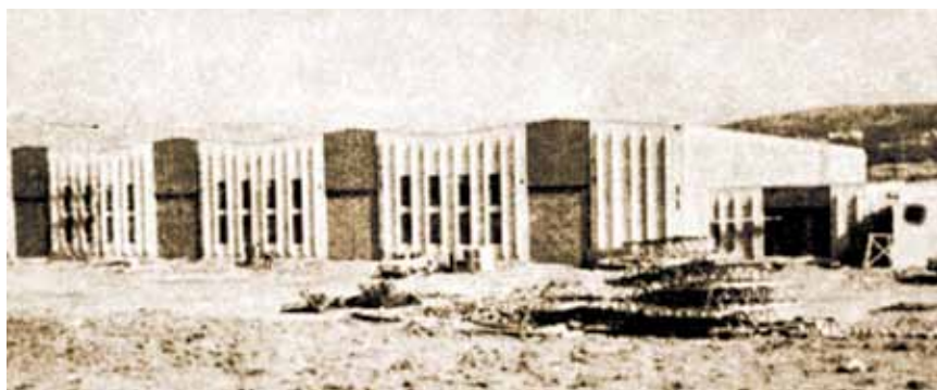
Hala Rade Končara u Kukuljanovu (iz članka)

Za kraj valja dodati da je ovo kratko podsjećanje na neka davna riječka gradilišta ipak podsjetilo na negdašnja velika riječka građevinska poduzeća za koja neki mlađi građevinski inženjeri i tehničari čak i ne znaju da su postojala. A radilo se o poduzećima s više od tisuću radnika.