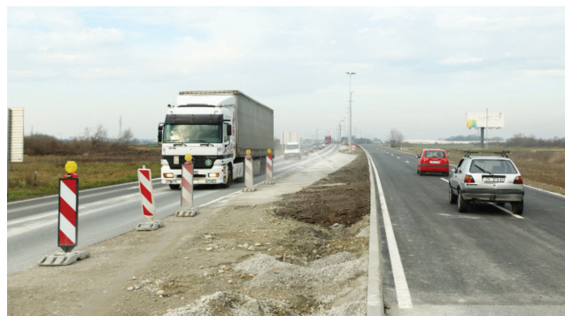
Puštanje u promet oba kraka istočne obilaznice

tri desetljeća triput manja, to znači da je vrijednost radova veća od 6 milijuna dolara (6.040.471 dolara), što je ipak više nego danas. Doduše s prilaznim je cestama bilo izgrađeno više od pet kilometara kolnika.