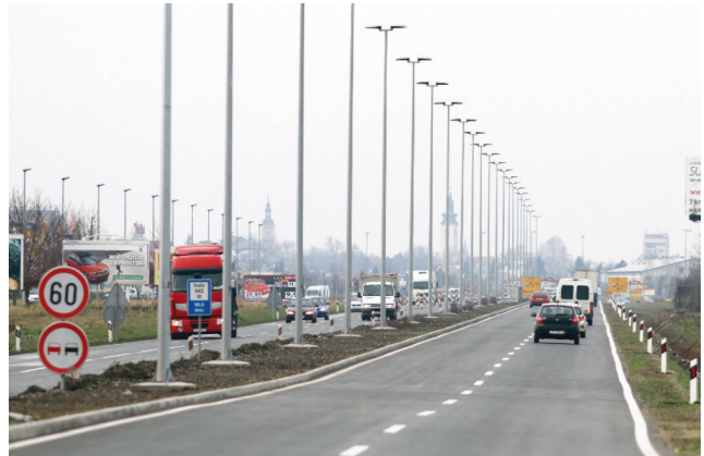
Istočna obilaznica Varaždina pod punim prometnim opterećenjem

promet na autocesti stagnira. Razloge vide u naplati cestarine.