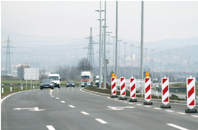
Promet je još tekao uz neka ograničenja