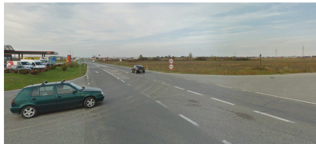
Promet istočnom obilaznicom prije gradnje novoga kraka