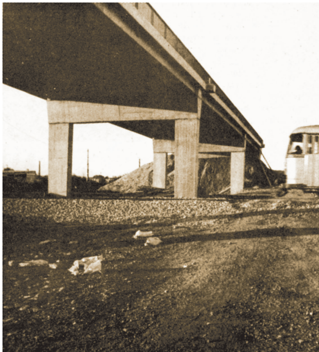
Dovršeni vijadukt preko željezničke pruge (iz reportaže)