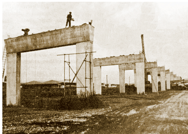
Izgradnja jednog vijadukata (iz reportaže)