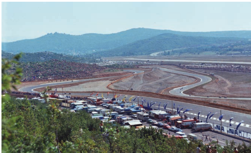
Detalj jedne motociklističke utrke na Grobniku

Ricarda Torne (u klasi 50 cm 3 ) i Angela Nieata (125 cm 3 ) te dvostrukog pobjednika Australca Grega Hansforda (250 cm 3 i 350 cm 3 ) koji je postavio i prvi apsolutni brzinski rekord staze od 153,11 km/h. Svi su sudionici bili oduševljeni smišljenom kombinacijom ravnih dijelova i zavoja koji su omogućavali mjestimičnu brzinu i do 300 km/h. Svjetski su brzinski asovi isticali da je za pobjedu na Grobniku uz tehničku perfekciju motocikla ključan i ljudski faktor.