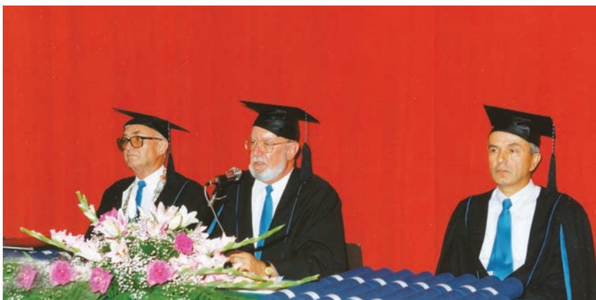
Dekan i prodekani Građevinskog fakulteta u Rijeci na dodjeli diploma 1988.

od kojih se posebno ističe automotodrom Grobnik iz 1978. (o čemu će poslije biti više govora). Osim toga, izradio je projekte deniveliranog čvorišta na Jadranskoj turističkoj cesti za Krk (1983.), sanacije Lujzinske ceste u kanjonu Rječine (1987.) i vanjske autocestovne obilaznice Rijeke (1995.), ali i projekt sanacije stajanke Zračne luke Split (1997.) te rekonstrukcije jedne rulne staze u Zračnoj luci Zagreb (1997.). Tome valja pridodati više od 200 km cesta, sedamdesetak projekata rekonstrukcija ili novogradnji gradskih ulica i raskrižja te dvadesetak manjih i srednjih mostova, nadvožnjaka i podvožnjaka. Kao ovlašteni revident za kolničke konstrukcije obavio je više od 200 revizija projekata autocesta i državnih cesta te kolničkih konstrukcija u zračnim lukama Zagreb, Split, Brač i Ploče.