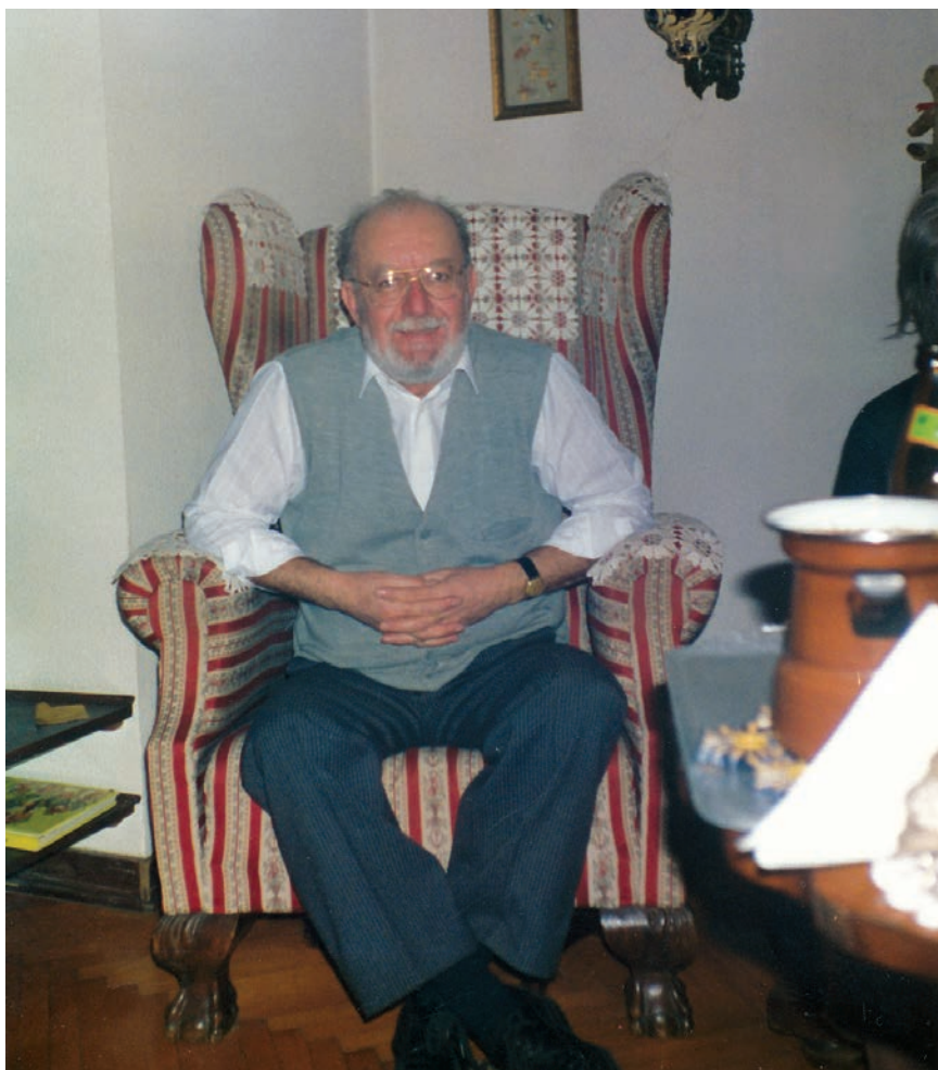
Detalj boravka u kući u Krasici