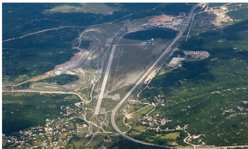
Pogled iz zraka na Grobničko polje s automotodromom (lijevo), poletno-sletnom avionskom pistom (sredina) i autocestom Zagreb - Rijeka (desno)