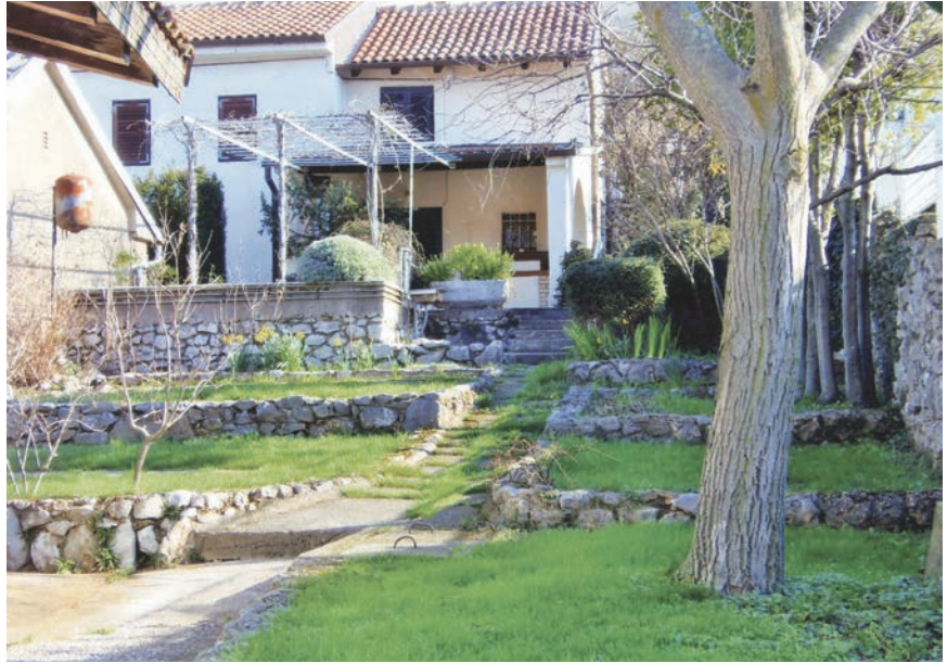
Kuća u Krasici